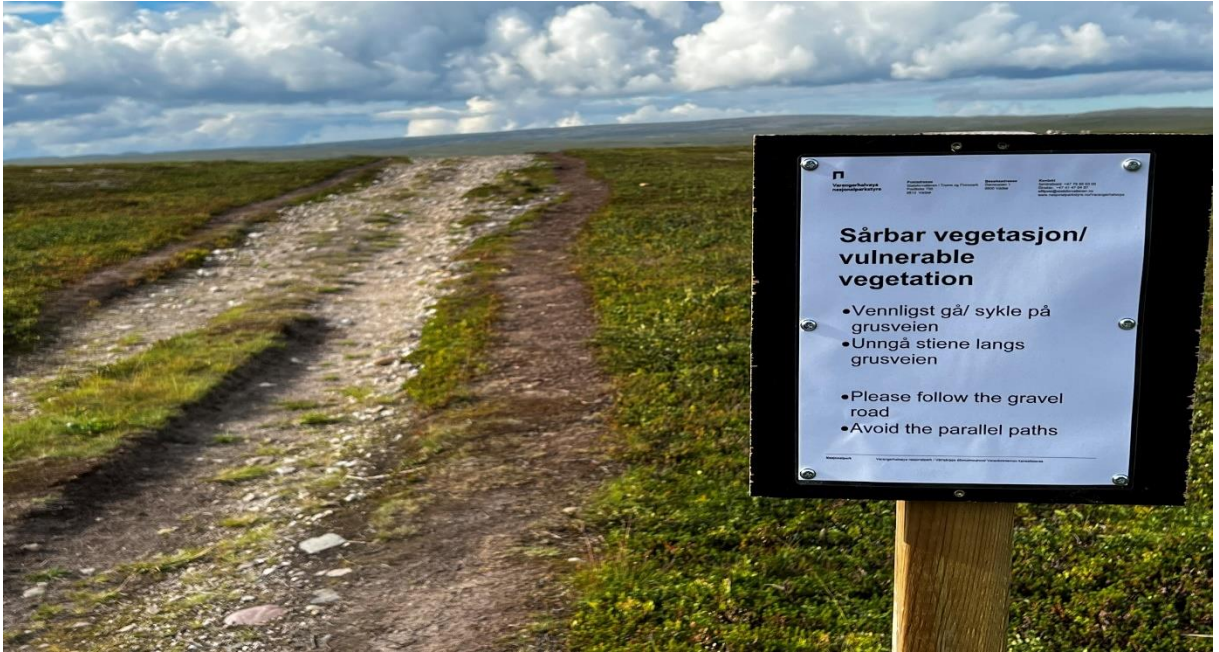
Parallele stier av ATV spor – omsøkt tiltak i 2024 – legge grus i 1,4 m bredde i midten av kjøresporet 500 meter for å spare kantvegetasjonen. Utsatt fra 2023. Vurdert i samarbeid med stiskolen hos Statens naturoppsyn.