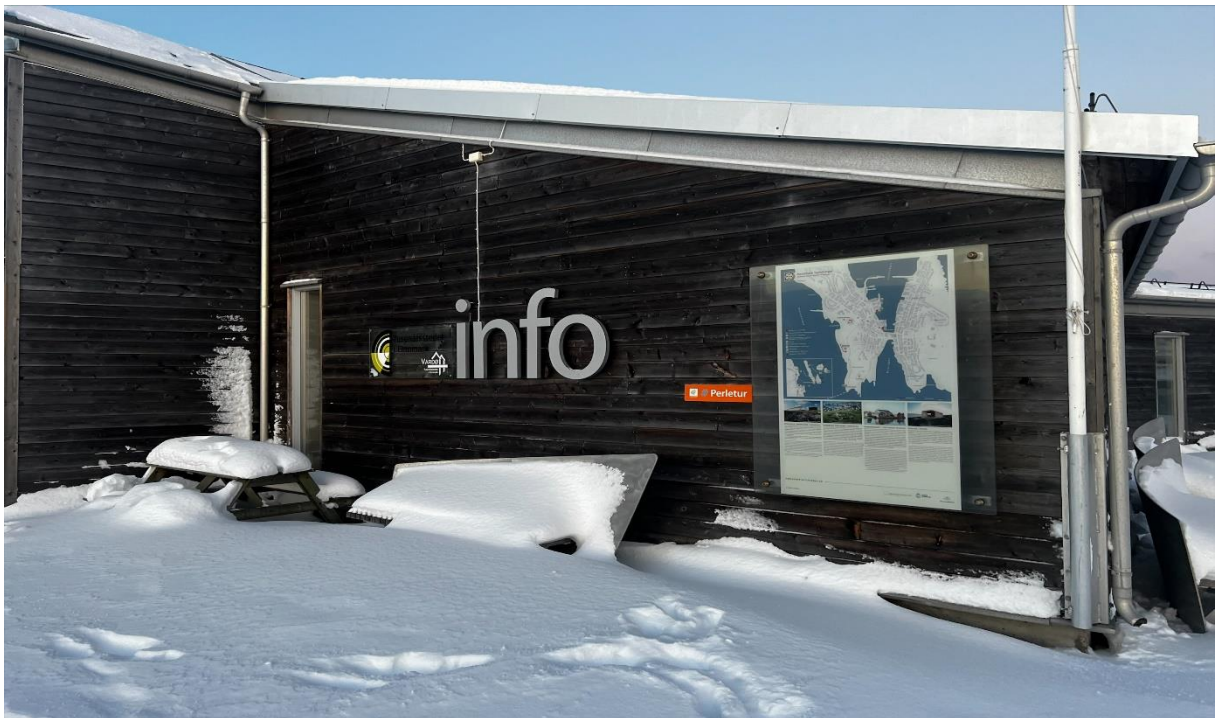
Turistinfo Vardø kommune, Infopunkt Hornøya NR

Infotavler om nasjonalpark etableres. Mer informasjon innendørs om nasjonalparken.