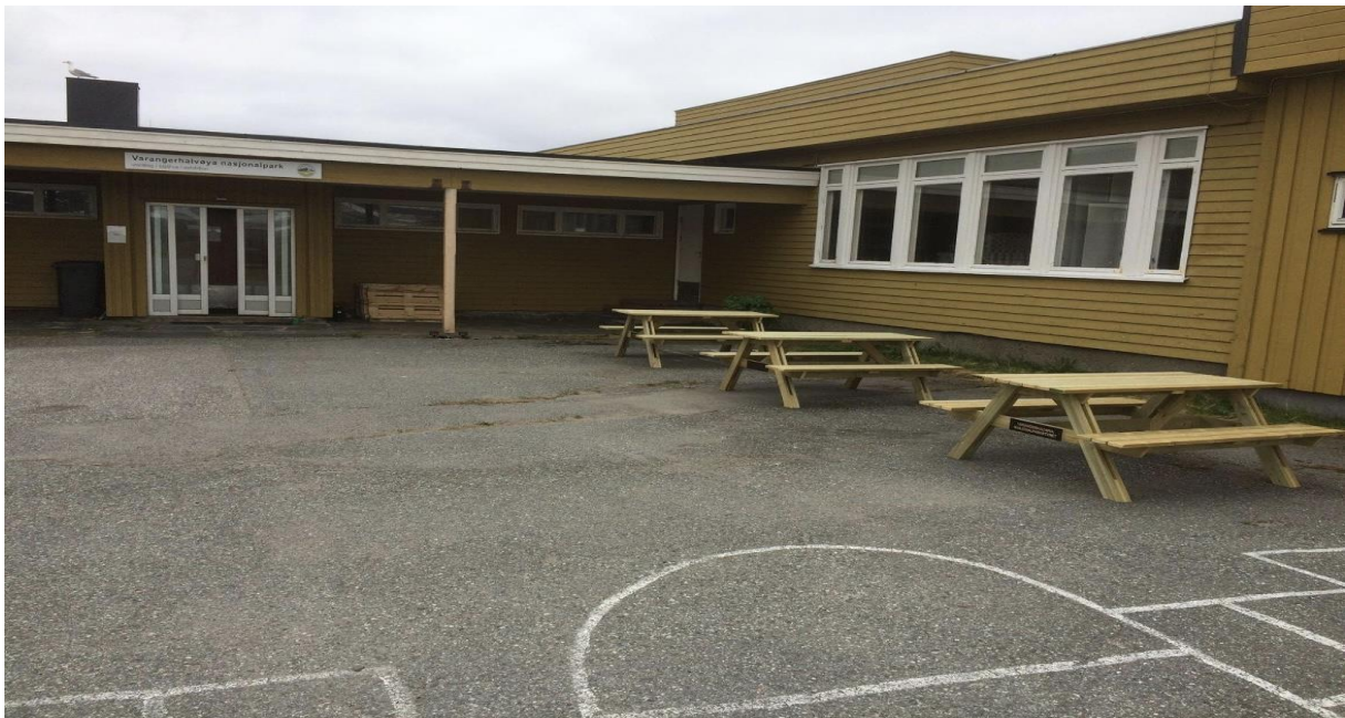
Driftsutgift: Leie av lokale for innendørs Infopunkt Kiberg