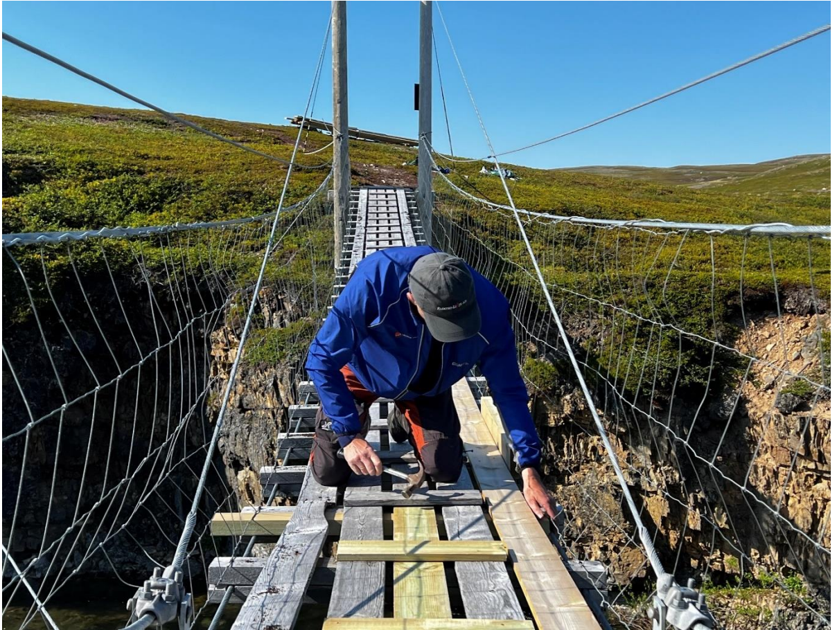
Driftsutgift: Årlig tilsyn av hengebru i Komagdalen med hengebrueksper.