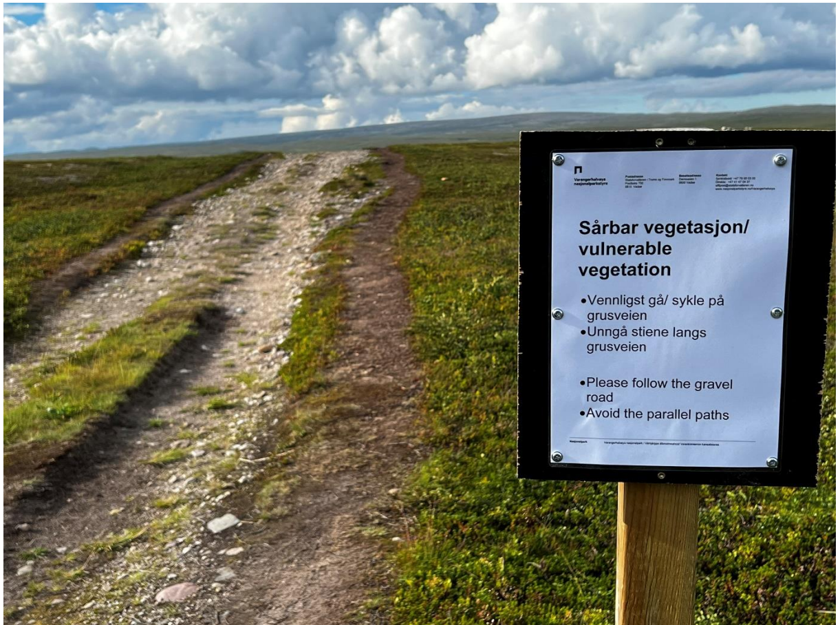
Parallele stier av ATV spor – omsøkt tiltak i 2023 – legge grus i 1,4m bredde i midten av kjøresporet for å spare kantvegetasjon. I 2022 ble det skiltet for å be folk gå i kjøresporet fremfor ved siden av.