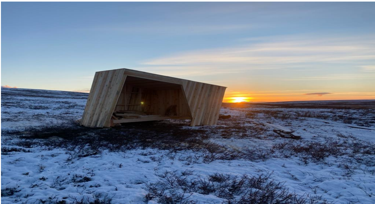
Ny gapahuk langs sti til Nattfjelldalen – bålpanne og arbeid med bålvedkasse gjenstår. Åpningsarrangement.