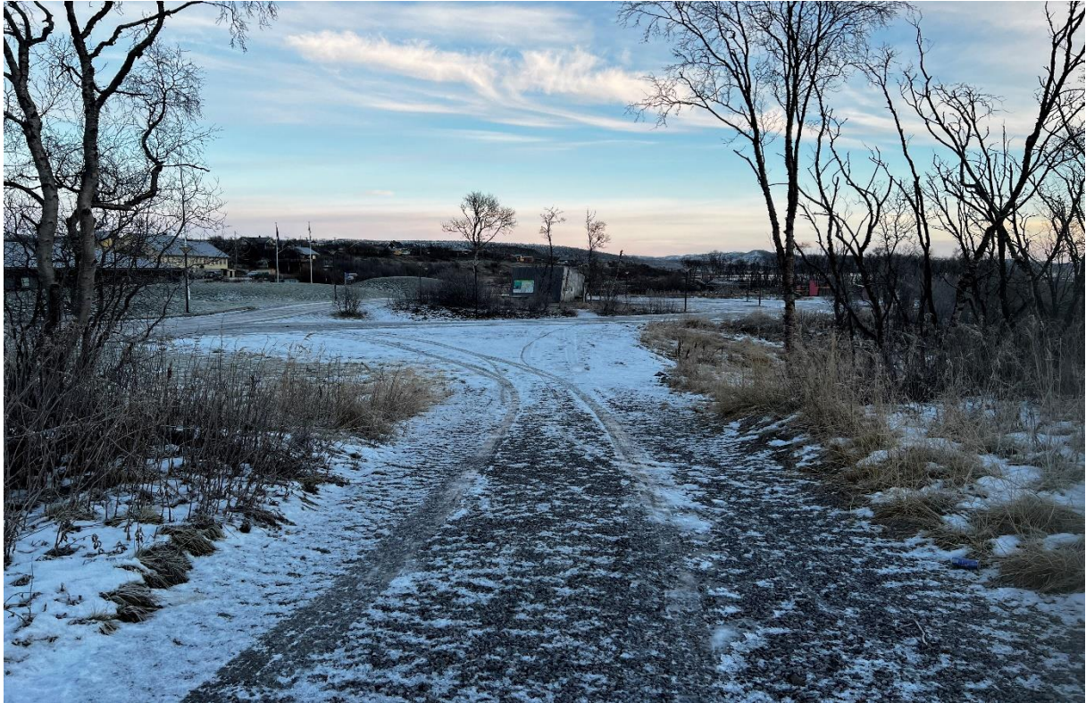
Bilde fra sti fra utvidet parkering ved E75, og område hvor sti skal anlegges fra parkering ned mot gapahuk, smales inn og gapahuk lyssettes – infopunkt Varangerhalvøya nasjonalpark – Vuonnabahta - Varangerbotn -