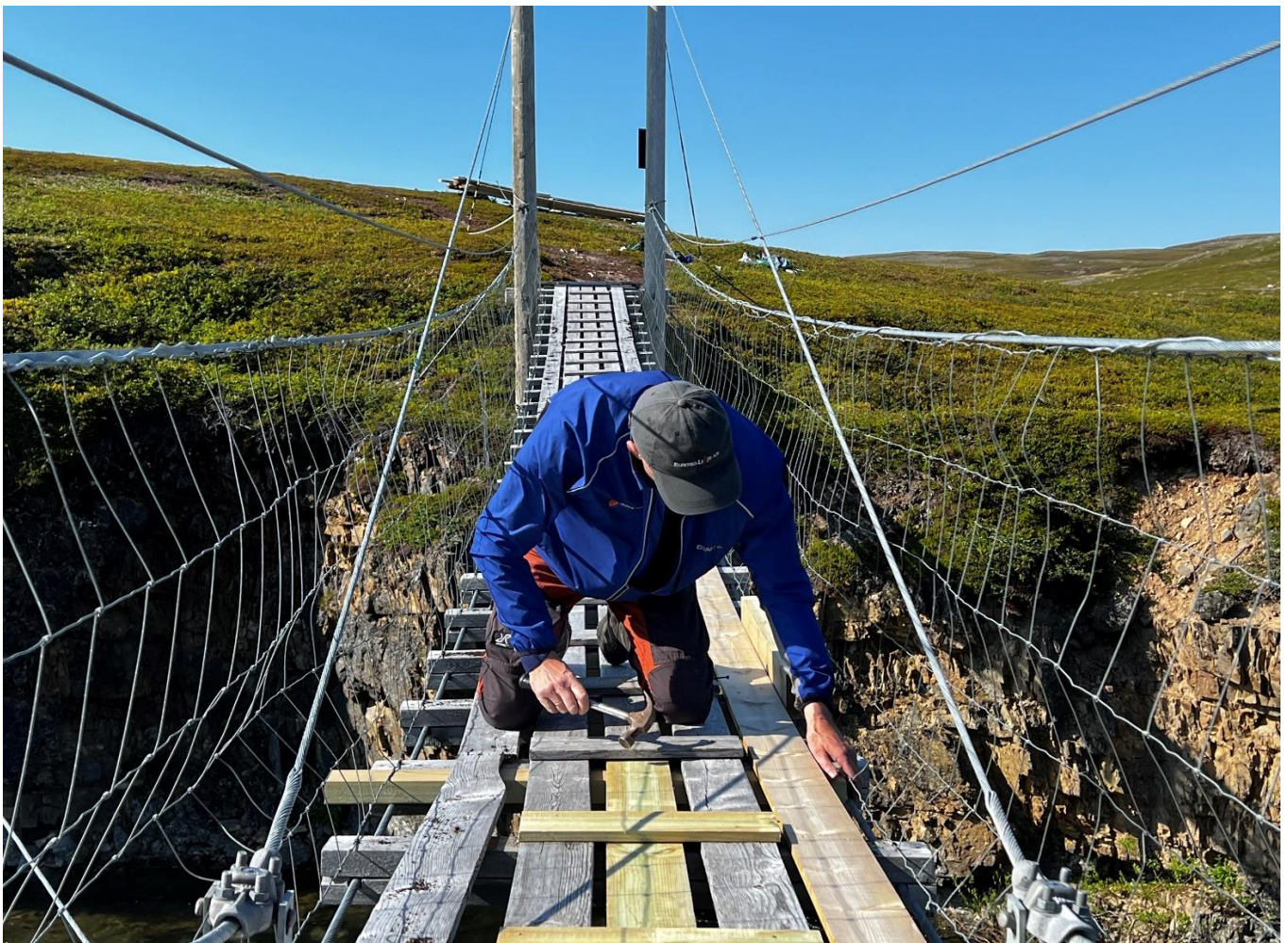
Tilsyn og reparasjon av hengebru i Komagdalen

Sandfjordneset Naturreservat og Ytre Syltevika Naturreservat