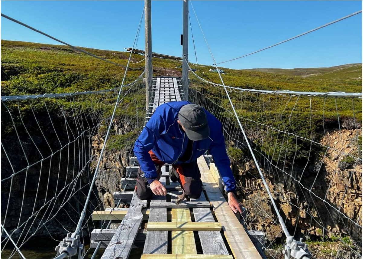
Årlig tilsyn av hengebru i Komagdalen med hengebruekspert. Vi vil utbedre brudekket