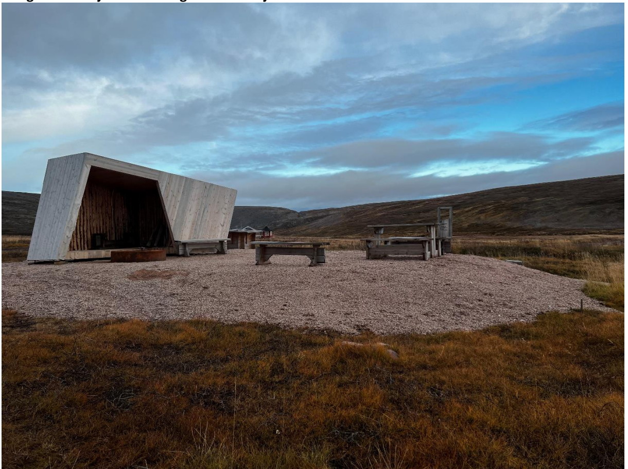
Startpunkt Ordo – gapahuk har fått topplag med grus.