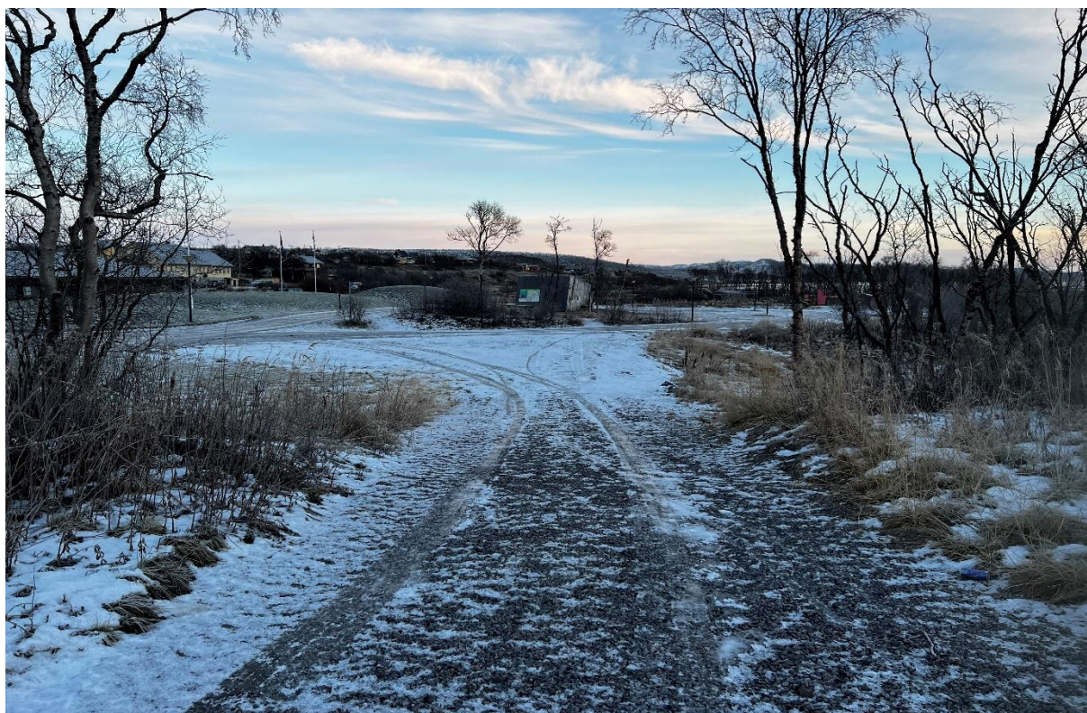
Bilde fra sti fra utvidet parkering ved E75, og område hvor sti skal anlegges fra parkering ned mot gapahuk, smales inn og gapahuk lyssettes – infopunkt Varangerhalvøya nasjonalpark – Vuonnabahta - Varangerbotn -

Sum omsøkt tiltaksmidler for nasjonalparkstyret i 2023 - 1 875 000 kr.