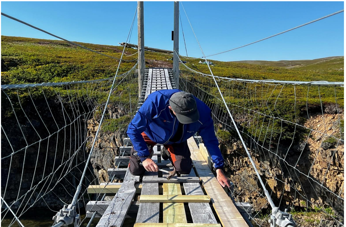
Tilsyn og reparasjon av hengebru i Komagdalen

Sandfjordneset Naturreservat og Ytre Syltevika Naturreservat