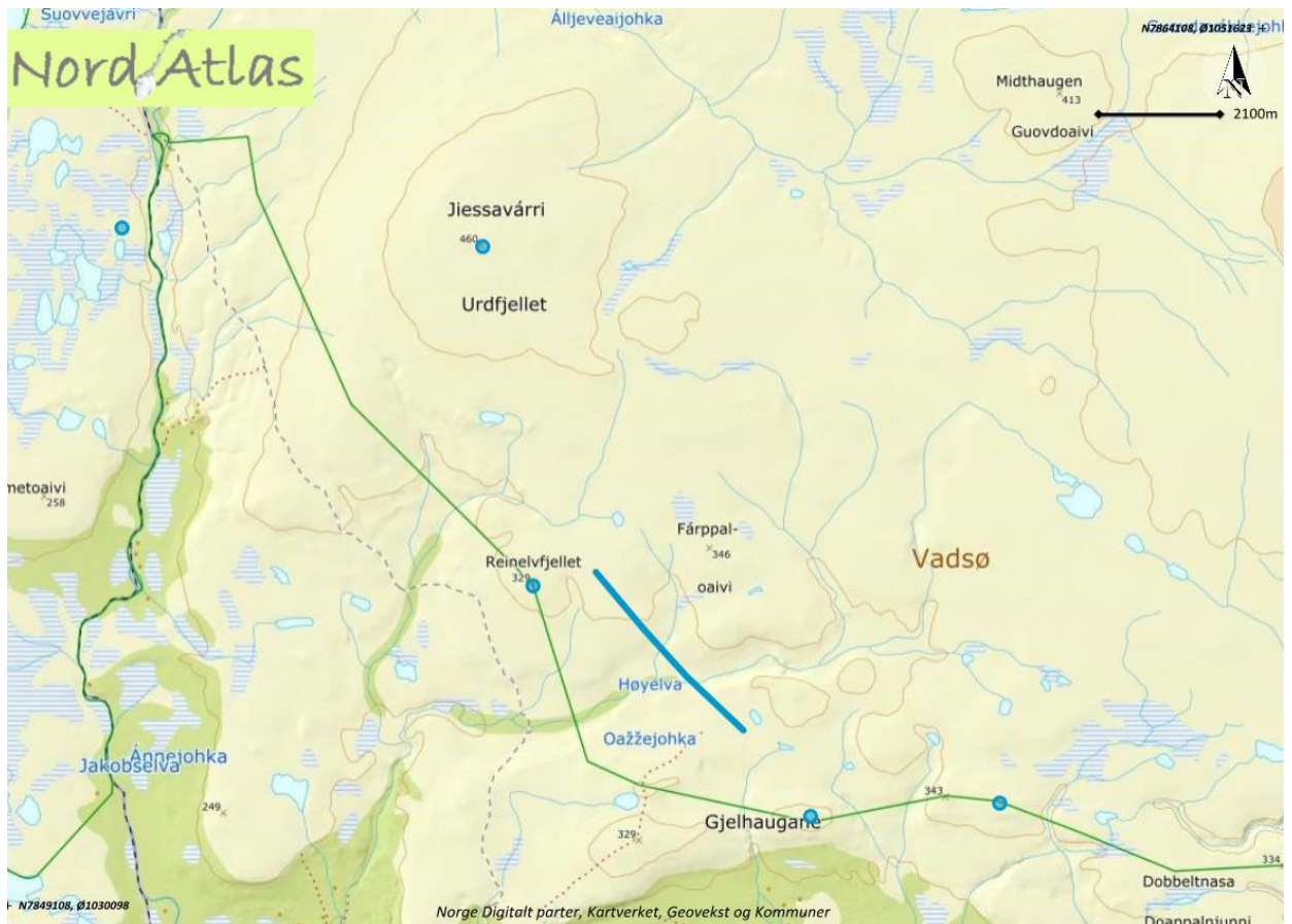
Kart 1. Obligatorisk waypoints (blå punkt) mellom Bergebyvatn og Vadsø, for å unngå sårbare områder. Trase vest for linje i Høyelva. Fra 345. m.o.h via Dobbeltnasa til Vadsø.