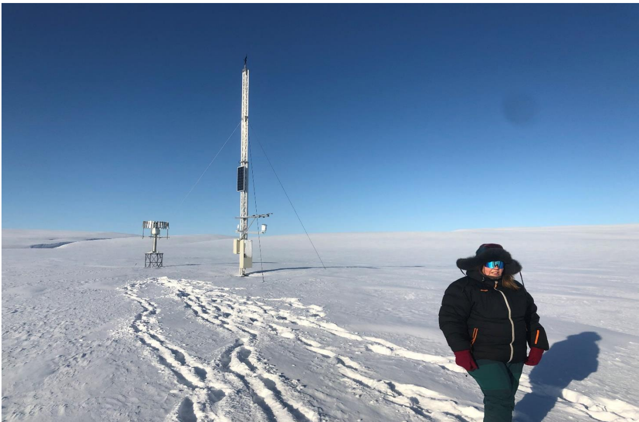
Befaring av fullskala værstasjon utenfor nasjonalparken i mars 2021.