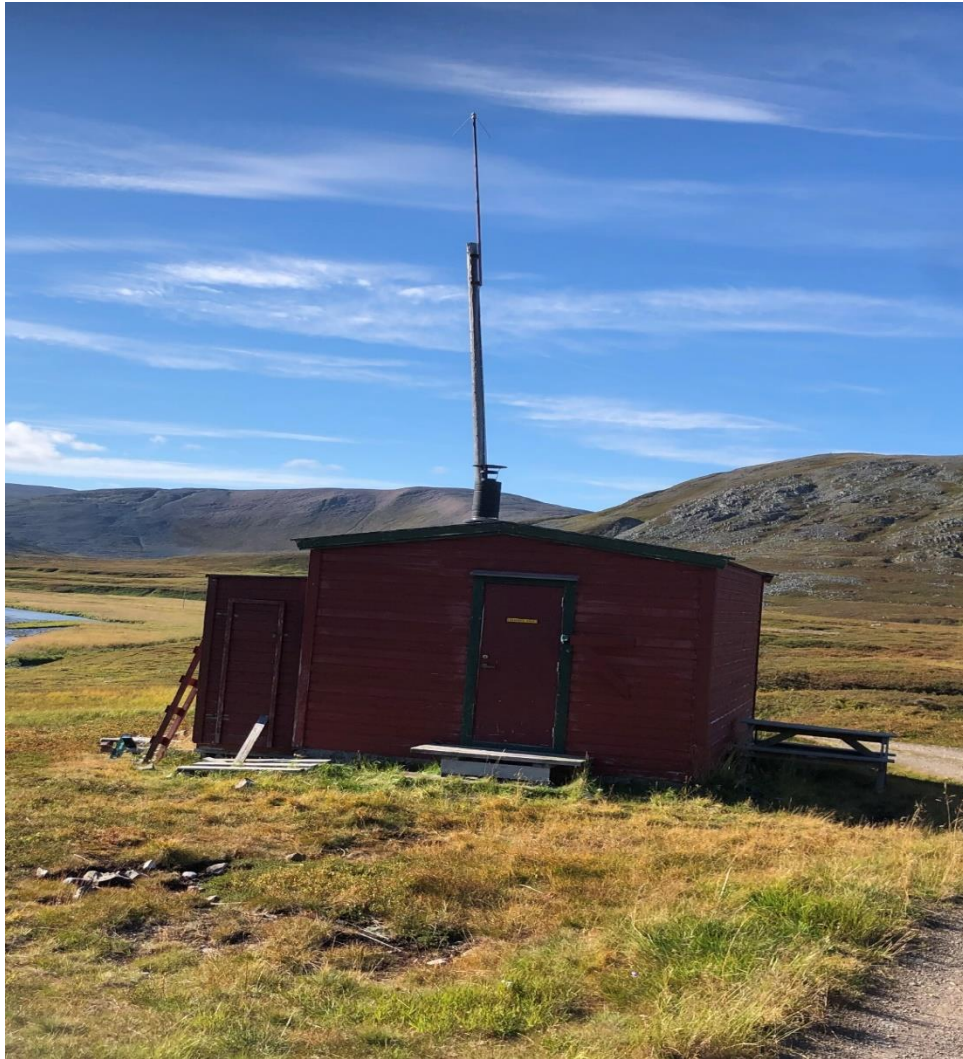
Gammel Varanger kraft hytte, Syltevikmoan. Overtatt av nasjonalparkstyret tiltenkt til bruk for naturoppsyn, arbeid med skjøtsel i verneområdene etc. 4 sengeplasser.