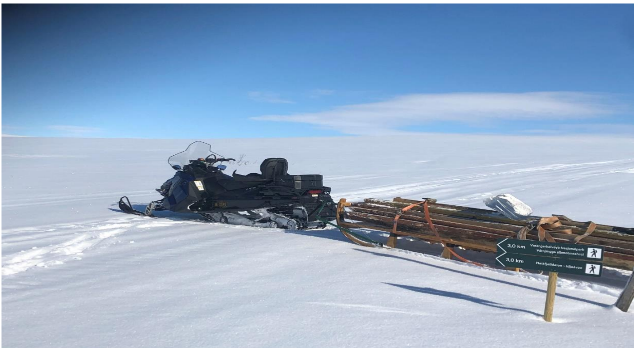
Klopper på vei ut til sti Nattfjelldalen, april 2021.