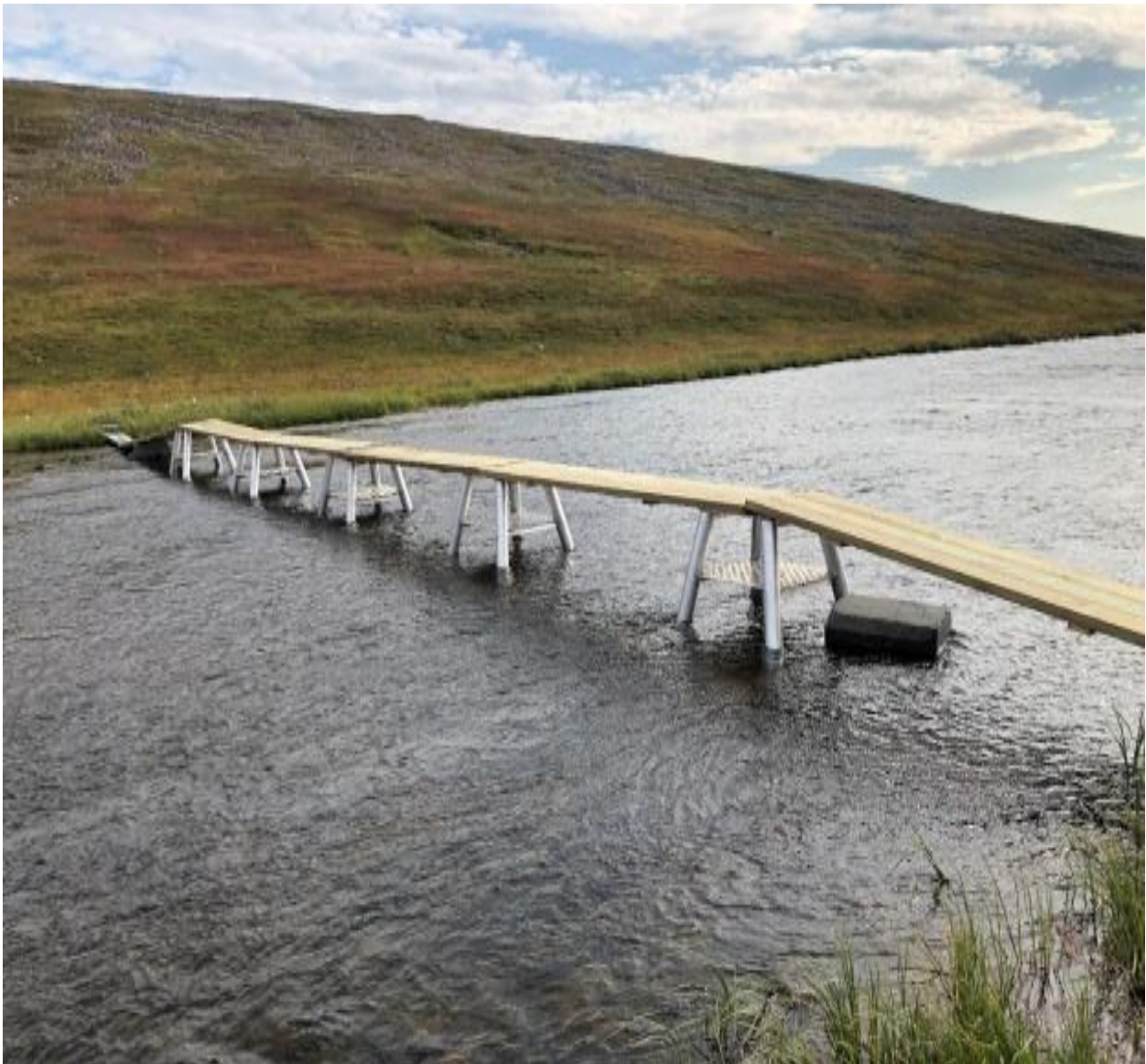
Løsning for bru ved utløp av Oarddojávri, Kloppbru, 2021.

Varangerhalvøya nasjonalparkstyre/ Várnjárgga álbmotmeahccestivra/ Varenkinniemen Kansalistaras styyri