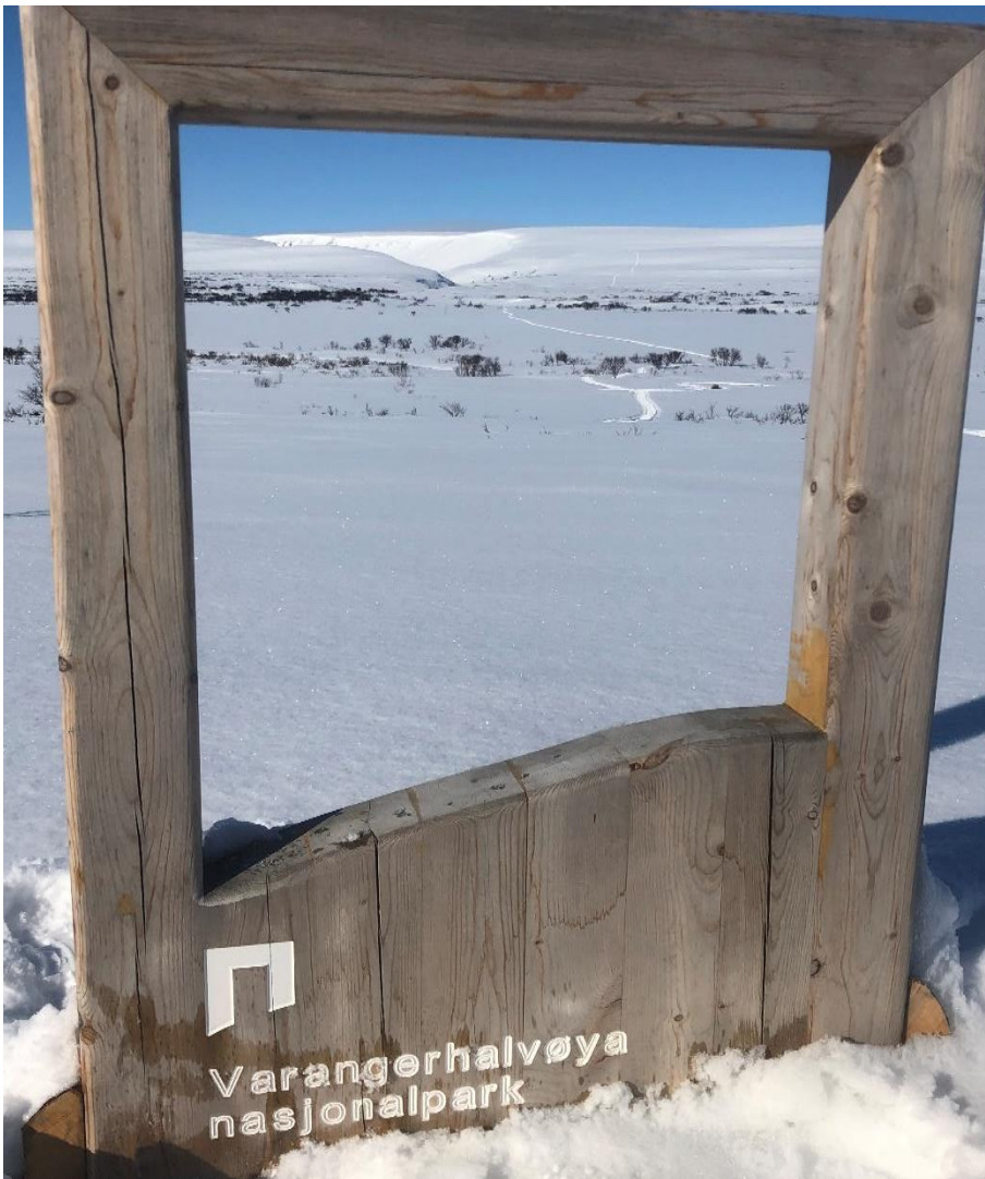
Portalen ved Nattfjelldalen ble plukket ned, og gravert med «Velkommen Inn» på kvensk «Tervetulema sisäle»