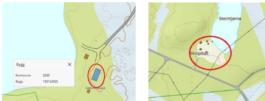
Figur 1. Til venstre er Gjøkvannskoia ringet inn med rødt. Til høyre er Gjøkhotellet.

Nasjonalparkstyret har en opsjonsavtale med FeFo om bruk av Gjøkhotellet og flytting av Gjøkvannskoia hit, se vedlegg. Planen er å bruke tømmeret/laftekassa i dette bygget som utgangspunkt for et nytt hovedhus. Hovedhuset ved Gjøkhotellet brant som kjent ned til grunnen den 21.12.2014. Se også vedlagte mulighetsstudie fra Biotope AS.