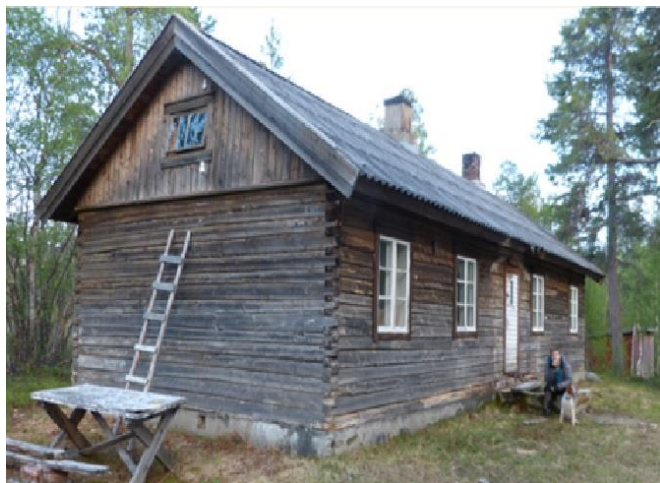
Figur 3. Gjøkvannskoia på dagens tomt.