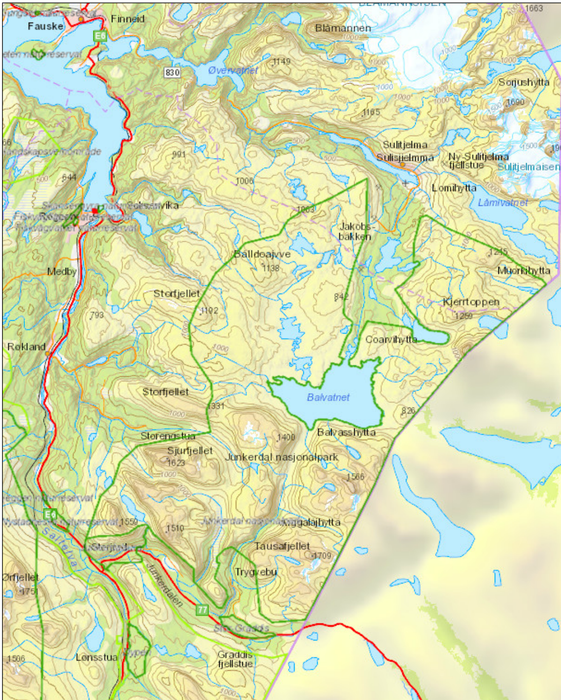
Figur 1. Kart over Junkerdal nasjonalpark med omland

Junkerdal nasjonalpark ble opprettet ved Kronprinsreg. Res. 9. januar 2004. Nasjonalparken dekker et areal på 682 km 2 og ligger i kommunene Fauske og Saltdal. Nasjonalparken grenser opp til Sverige og områder på svensk side vernet som et Natura 2000 – område, jfr. EU's Habitatdirektiv.