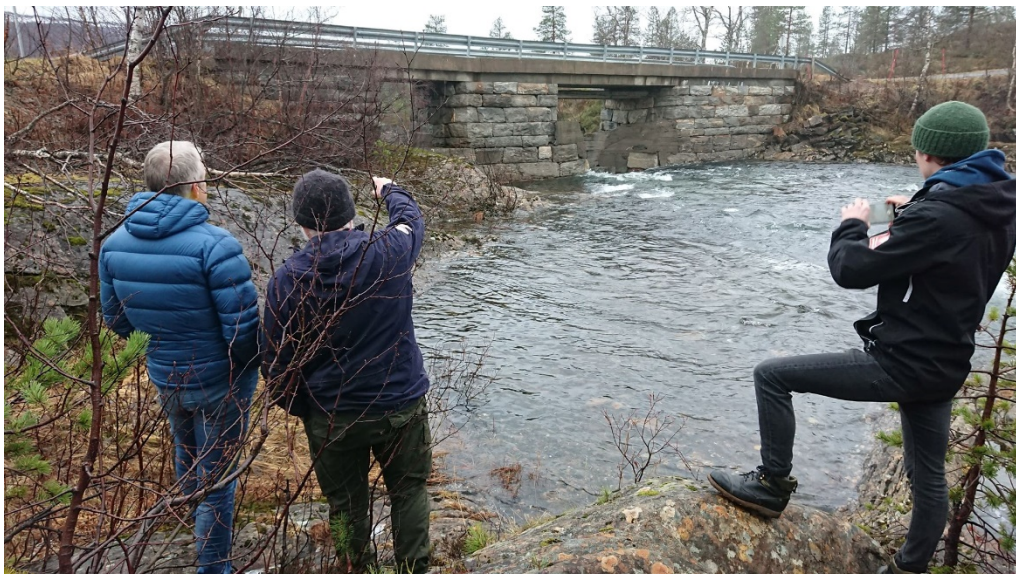
Bilde 1 Dambrua ved utløpet av Graurvassvatnet.

Ved utløpet av Graurvassbekken er det laget en bru/kulvert. Det er utfordringer med at denne fryser tett, og det legger seg issvull ut på veien. Fauske kommune må nesten årlig «steame» opp bekken under isen slik at den ikke tar nye løp ute på veien og ødelegger toppdekket. Isen fra bekken dekkles også av og til med snø slik at idet ikke danner seg issvull ut på veien. Dersom det skal gjøres noe med Dambrua, og veien for øvrig, er det viktig at det gjøres utbedringer her.