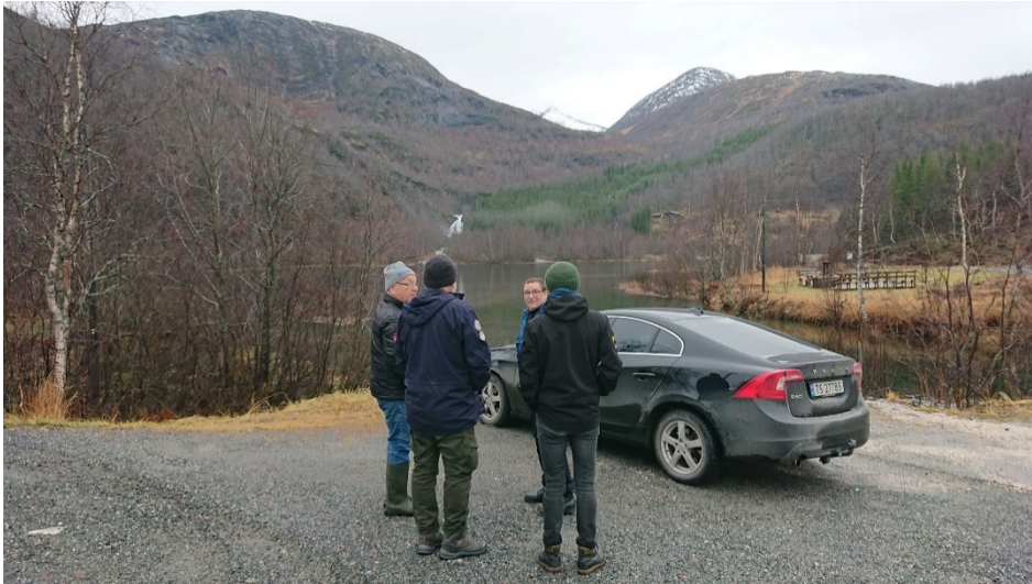
Bilde 3 Ved den innerste brua i Håla.