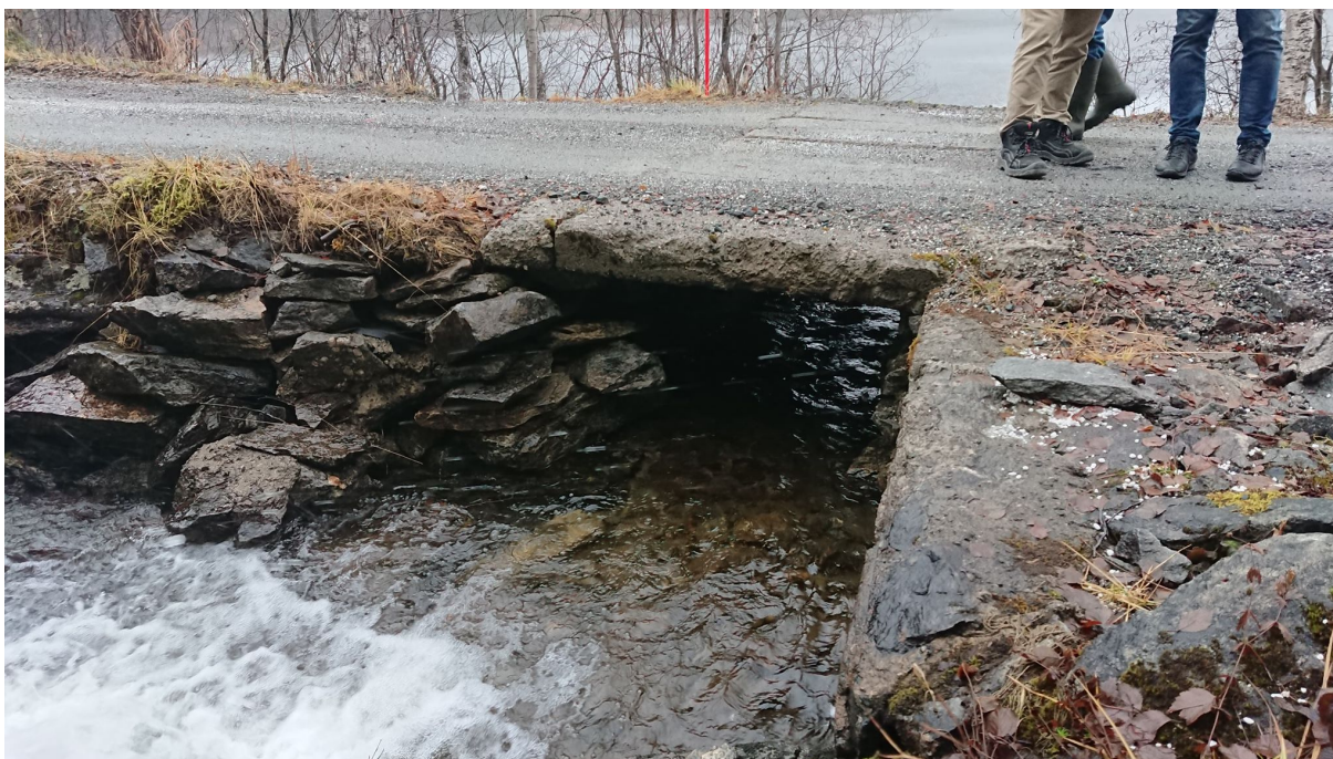
Bilde 2 Bru/kulvert over Graurvassbekken

Ved utløpet av Graurvassbekken er det laget en bru/kulvert. Det er utfordringer med at denne fryser tett, og det legger seg issvull ut på veien. Fauske kommune må nesten årlig «steame» opp bekken under isen slik at den ikke tar nye løp ute på veien og ødelegger toppdekket. Isen fra bekken dekkles også av og til med snø slik at idet ikke danner seg issvull ut på veien. Dersom det skal gjøres noe med Dambrua, og veien for øvrig, er det viktig at det gjøres utbedringer her.