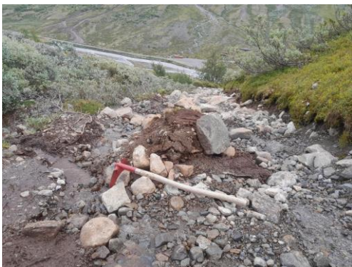
Utvasking av stien i Visdalen etter uværet Hans i august