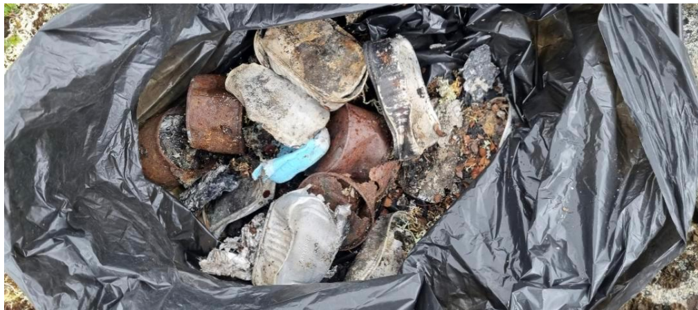
Søppel funne ved Bessvatnet