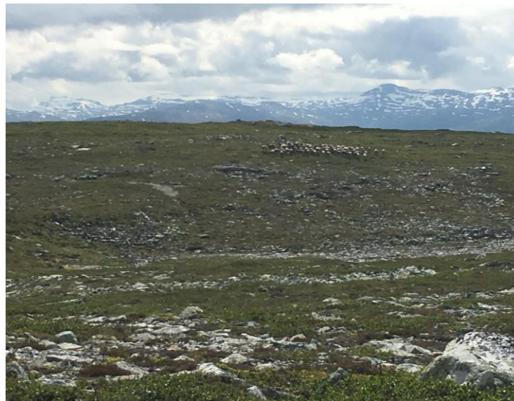
Villrein på beite ytst ute på halvøya i juli.

! Ferdslar av folk i området Tindevegen og austover har auka dei seinare åra, både vinter og sommar. Dette gjeld ikkje minst på Luster si side, men også i Årdal. Kan dette vere medverkande årsak til at villreinen held seg lenger vest heile året?