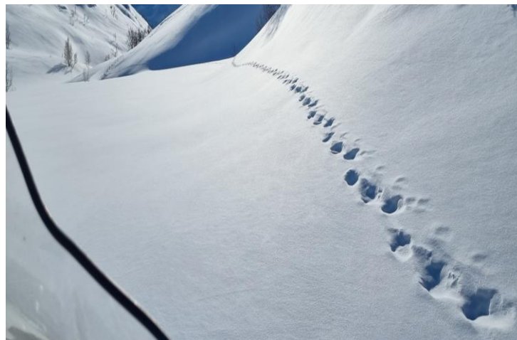
Jervsporing i Storutladalen i mars

Sporing i februar - mai Ingen sporfunn i Vang Størst sporaktivitet nord i Jotunheimen Ingen jervar tekne ut i verneområda i Jotunheimen sist vinter.