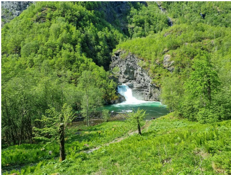
Lauveng ved Høljafossen i Utle etter slått