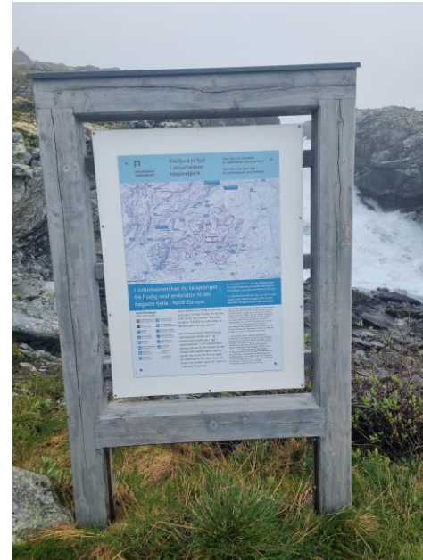
Bommen og infotavla ved vernegrensa i Koldedalen. Infoplakaten er falma og trengs fornying neste år.