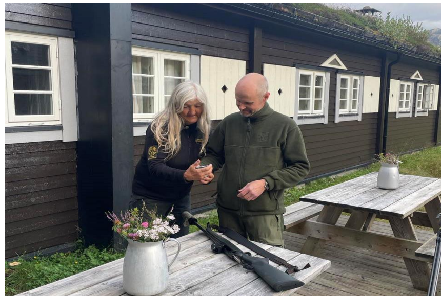
Kontroll av hjortejeger ved Skogadalsbøen