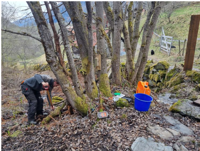
Ferdselstellar ved Vetti