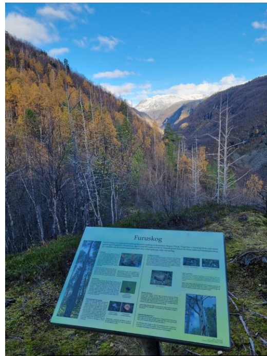
Natursti Avdalen - Furuhaugen