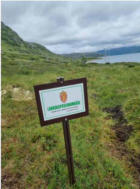
Verneskipt ved Buvassbekken ved Tyn.