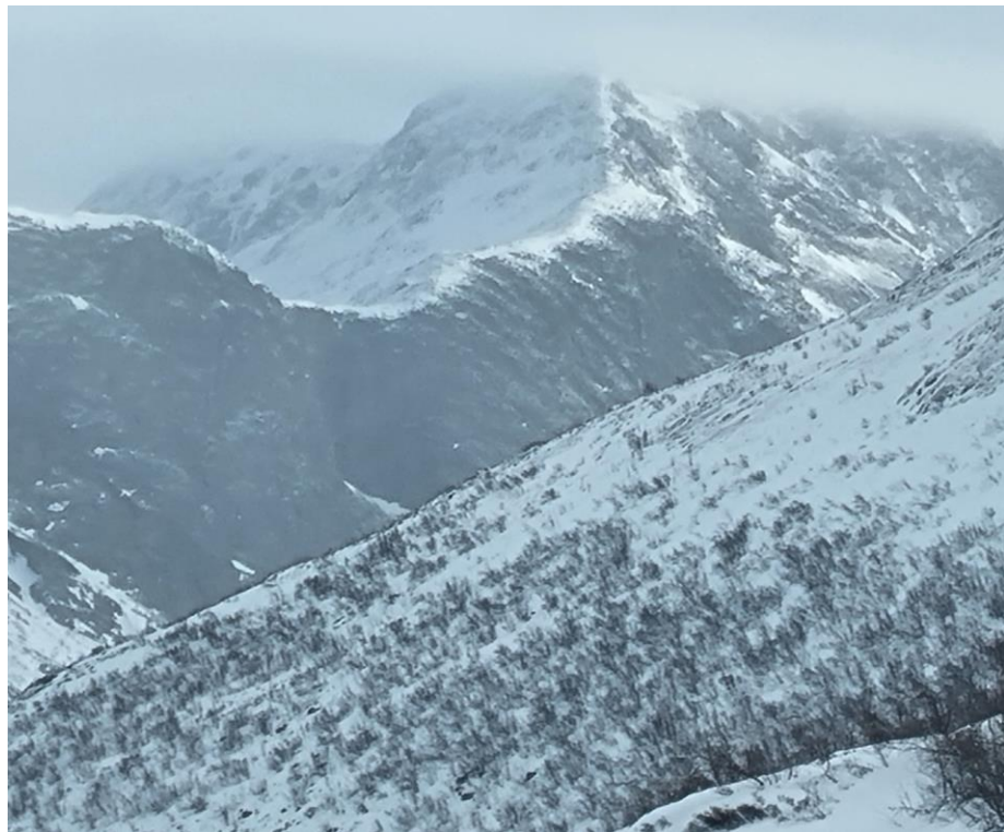
Besseggen i mars