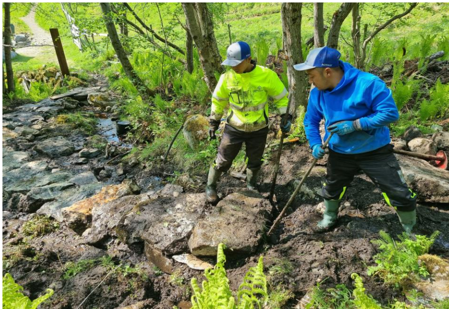
Steinsetting ved bruk av stadeigen stein ved Vetti