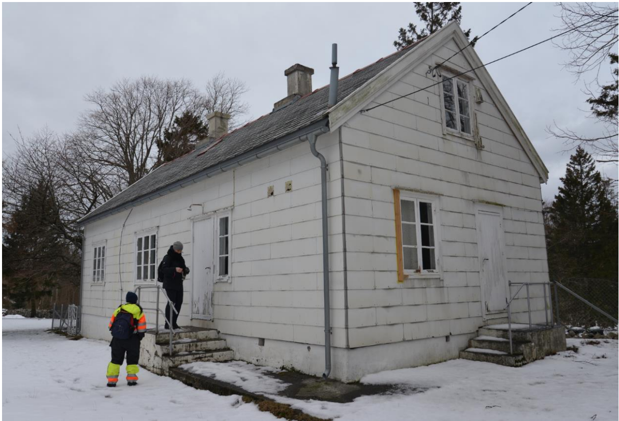
Assistentboligen sett fra det nyeste fyret.