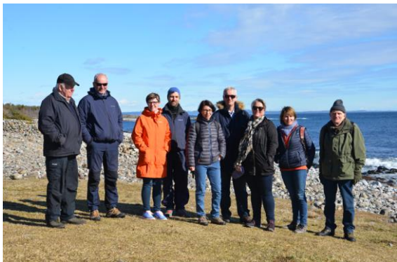
Tangplassen mars 2017