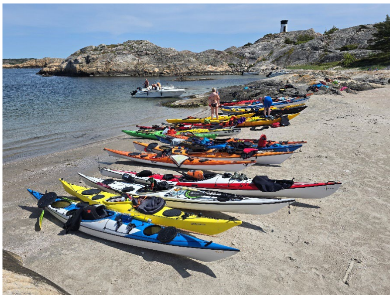
Pause på Tjurholmen utenfor Strømstad på en av padleturene på lørdag