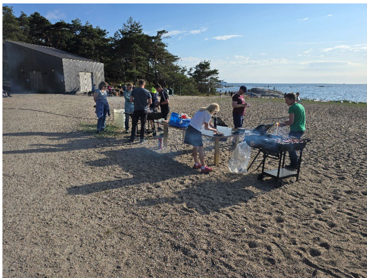
Bilde viser grilling på fredagskvelden