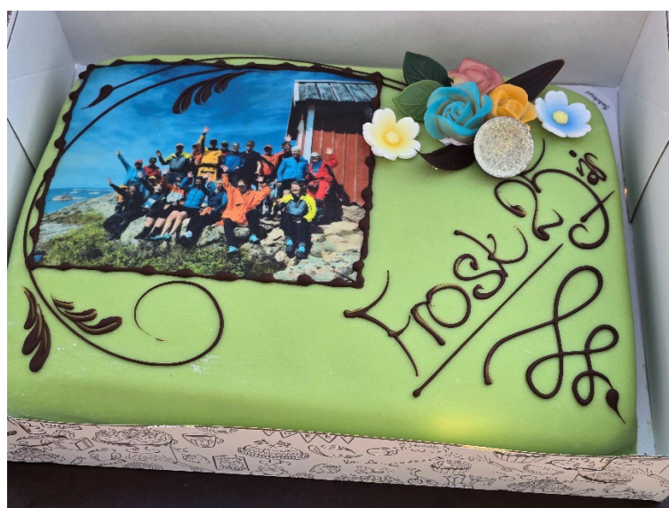
Frosk feiret 25 år med jubileumskake til alle deltagerne under leiren