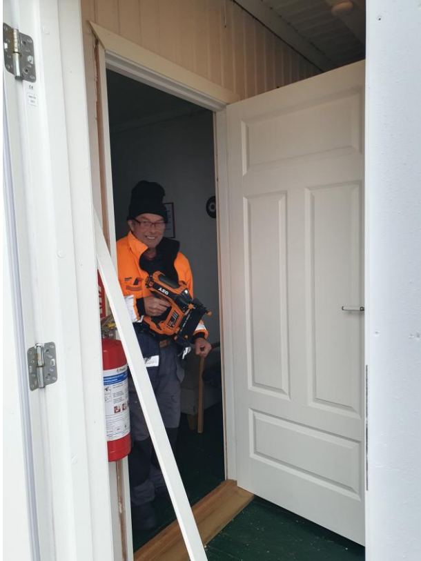
Justering hengsler og nye låsefester dør i naustet