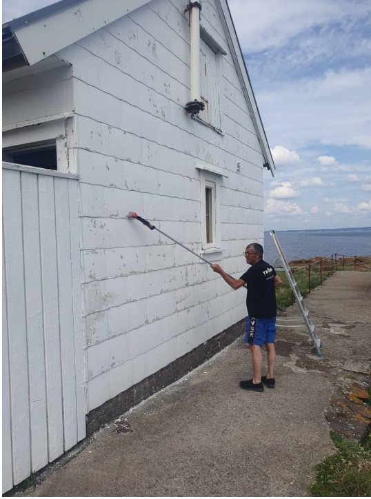
Skrape og male anneks