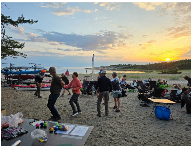
Bilde fra lørdagskvelden