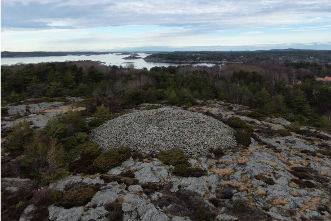
Dronefoto av Herfølsåta, tatt før det ble gjort vegetasjonsskjøtsel og plassering av skilt.