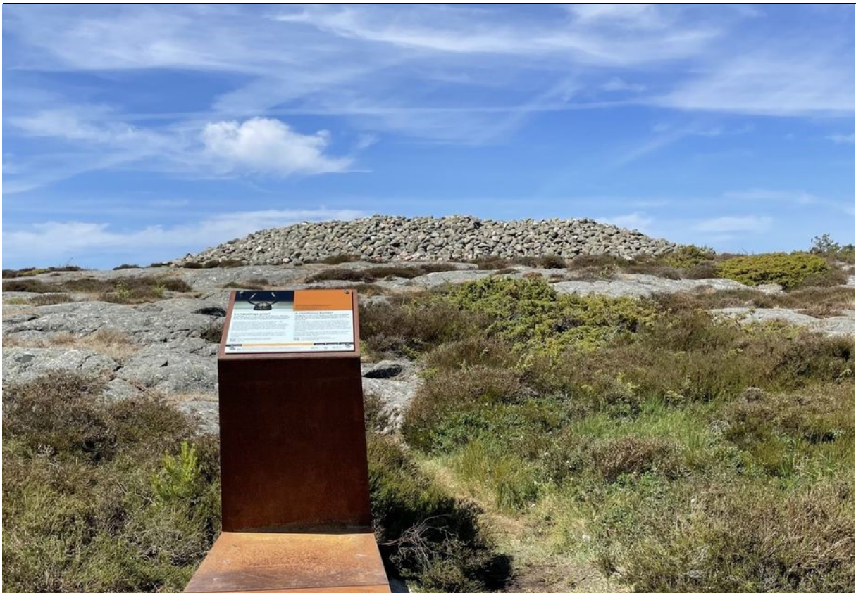
Nytt informasjonsskilt ved Herfølsåta, Hvaler kommune.

Merk: Dronefoto er tatt med tillatelse av Ytre Hvaler Nasjonalpark.