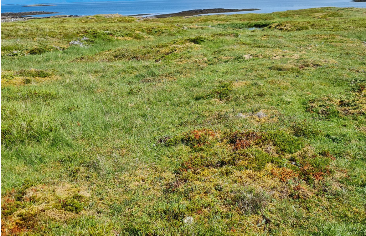
Figur 13. Vegetasjonen bærer preg av fuglegjødsling og opptrer i mosaikk med heivegetasjon.