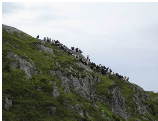
Gammelnorsk sau er godt tilpassa beiting i kystlynghei.

Vanlig norsk kvit sau og andre norske langhalet raser med regional utvikling og tilpassing (steigar, cheviot, ryggja), spælsau og eventuelt andre saueraser kan også beite i kystlynghei lenge utover høsten der det er vilkår for det, og i deler av vinteren når det blir kombinert med innefôring som sikrer dyra tilstrekkelig med energi og protein. Driftsmåten som kombinerer utegangerdrift og innefôring er lite brukt i dag sammenlignet med tidligere, men er fortsatt i bruk m.a. i området ved Lindesnes i Vest-Agder, Rogaland, Hordaland og enkelte steder videre nordover langs kysten. Beiting med de langhala sauerasene eller spælsau i kystlynghei gjennom sommeren vil ofte gi mindre tilvekst på lamma enn annet utmarks- eller fjellbeite. Mengdeinnslaget av gras og urter er viktig, det gjelder å få en god start på tilveksten hos lamma fra våren av, og at tilveksten ikke stagnerer og blir for lav når en kommer utover sommeren og seinsommeren. Ved større innslag av strandeng i tilknytning til kystlynghei, kan beitet være tilfredsstillende som sommerbeite både til tyngre saueraser og stedvis til storfe (sinkyr, kviger, kastrater, ammekyr). Naturtypen strandeng er det generelt mer av på deler av Trøndelagskysten og særlig i Nordland (Helgelandskysten) enn hva som er tilfelle på Vestlandet.