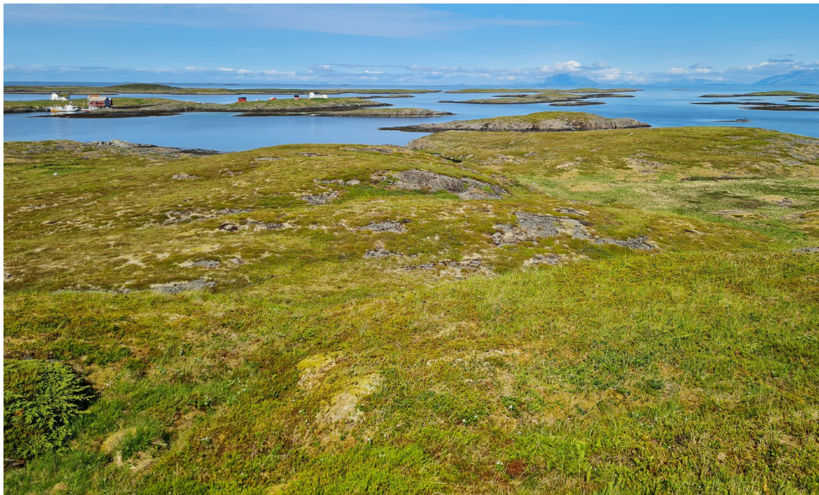
Figur 10. Fra den høyeste toppen og nordøstover er vegetasjon klassifisert som kystlynghei.