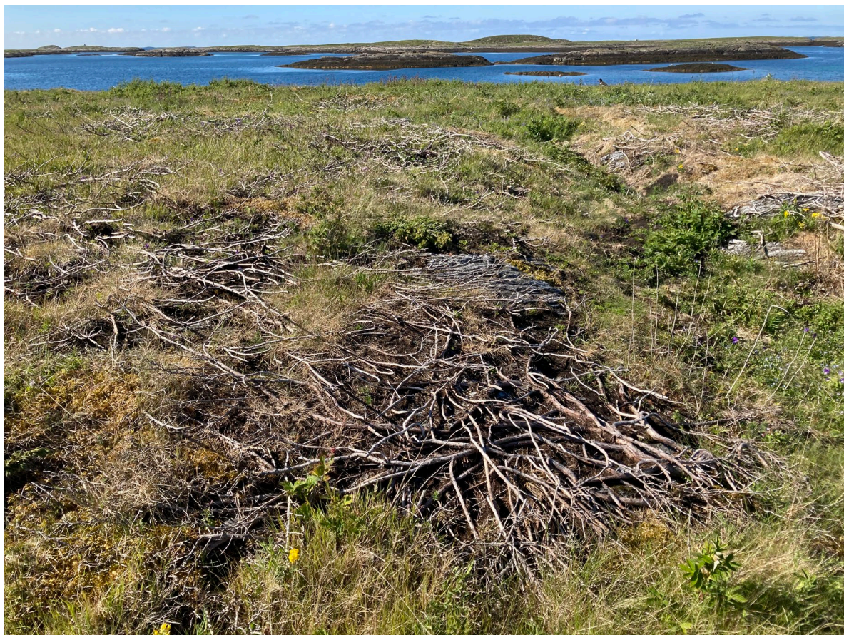
Figur 17. Parti med avsvidd einer på øy søt for Steinsholmen.