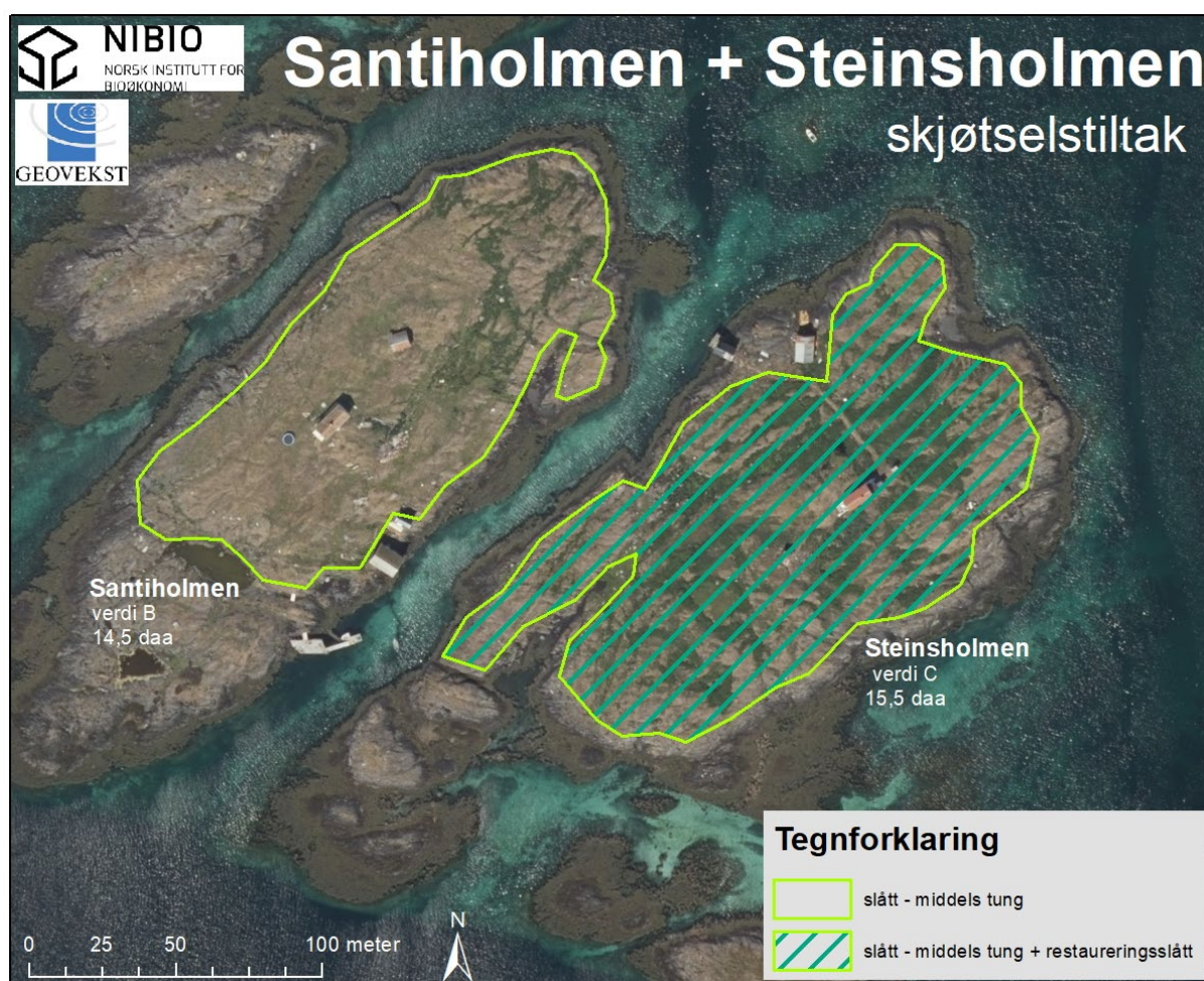
Figur 2. Oversiktskart som viser registrerte slåttemarker med tiltak på Santiholmen og Steinsholmen.