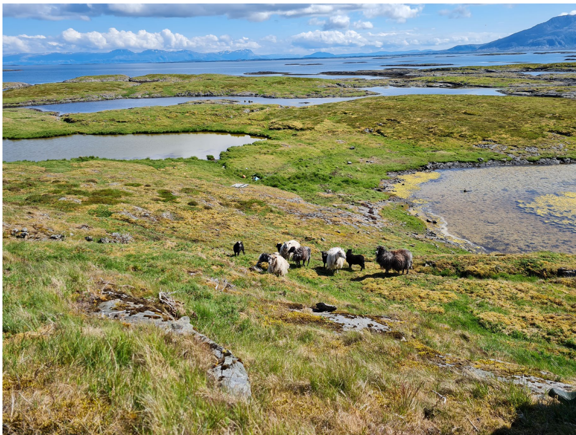
Figur 11. Naturbeitemark vises i bakgrunnen til venstre. Ellers består området av en mosaikk av heivegetasjon, fuglegjøslet eng, strandeng, grunnlendt mark og bart berg.