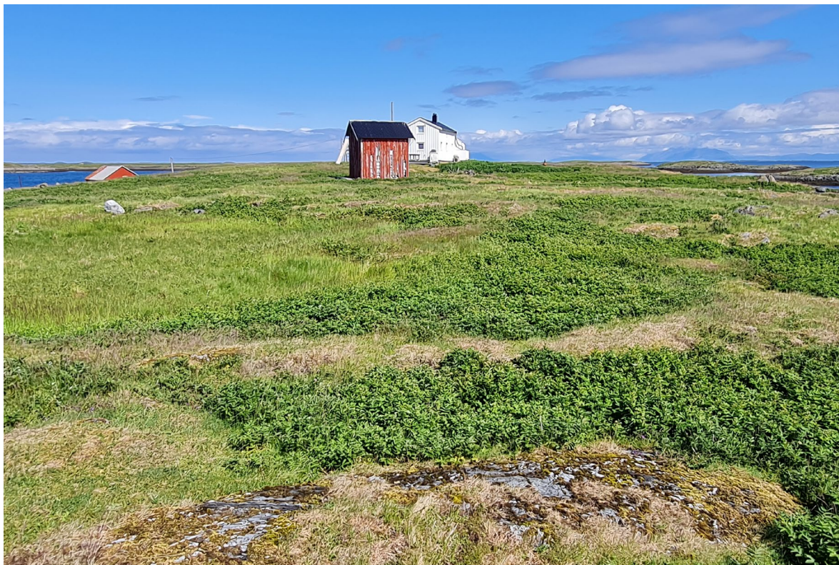
Figur 7. De skrinne partiene i slåttemarka på Steinsholmen er mer grasrike enn de frodige partier der mjøddurt dominerer.