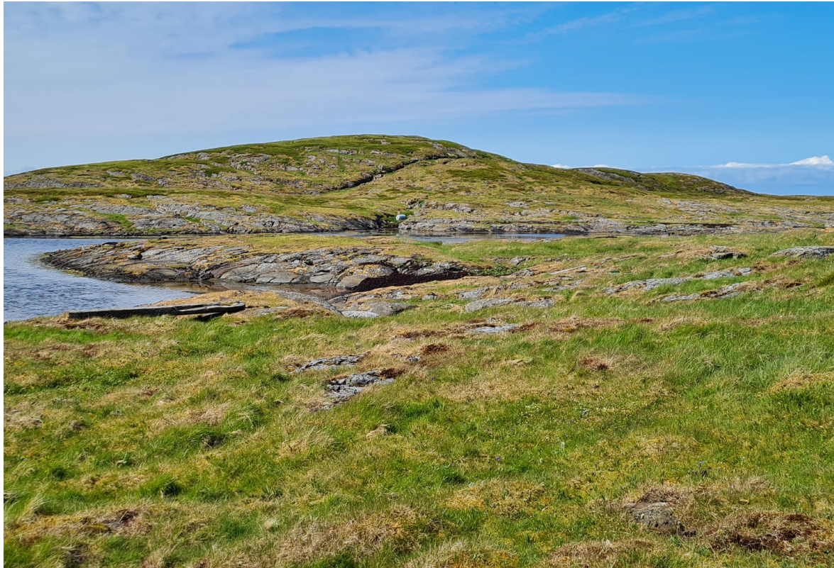
Figur 9. Den høyeste toppen på Mangdalsøya er avgrenset som kystlynghei.