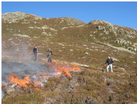
Lyngsviing er ei vanleg skjøtselsform i kystlynghei.

Selve avsviingsarbeidet må også planlegges nøye med hensyn til hvor ilden skal starte og avsluttes. Myr- og vannkanter kan være naturlige avslutningslinjer, men det hender at man må lage branngater (5-6 m) for å sikre en god avslutning. Man må sørge for å ha brannslukkingsutstyr tilgjengelig og man må varsle brannvesenet på forhånd. Naboer bør også varsles. Det er viktig å være mange nok for å sikre at man kan styre brannen. Brenning må bare gjennomføres under gunstige værforhold og med tele eller fuktig jord, dvs. i perioden fra sein høst til tidlig vår. Hvis man ikke selv har erfaring med lyngsviing, bør man få hjelp fra noen med erfaring, i hvert fall første gangen.