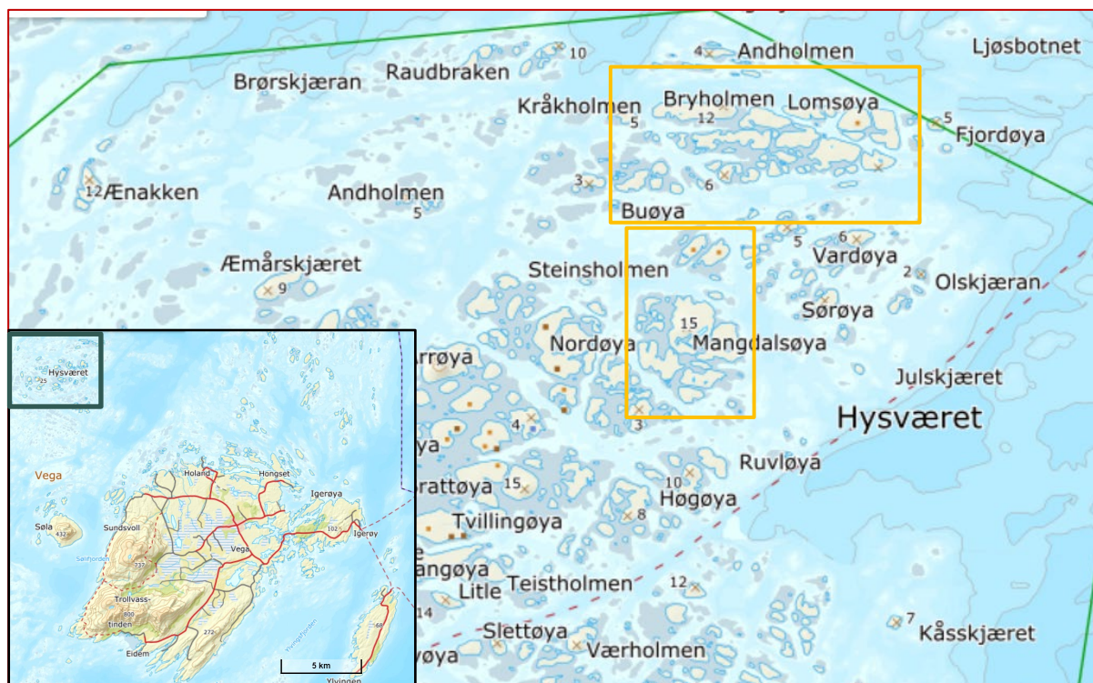
Figur 1. Oversikt over registrerte naturtypelokaliteter (avgrenset med oransje) for de nordlige øyene i Hysværet.