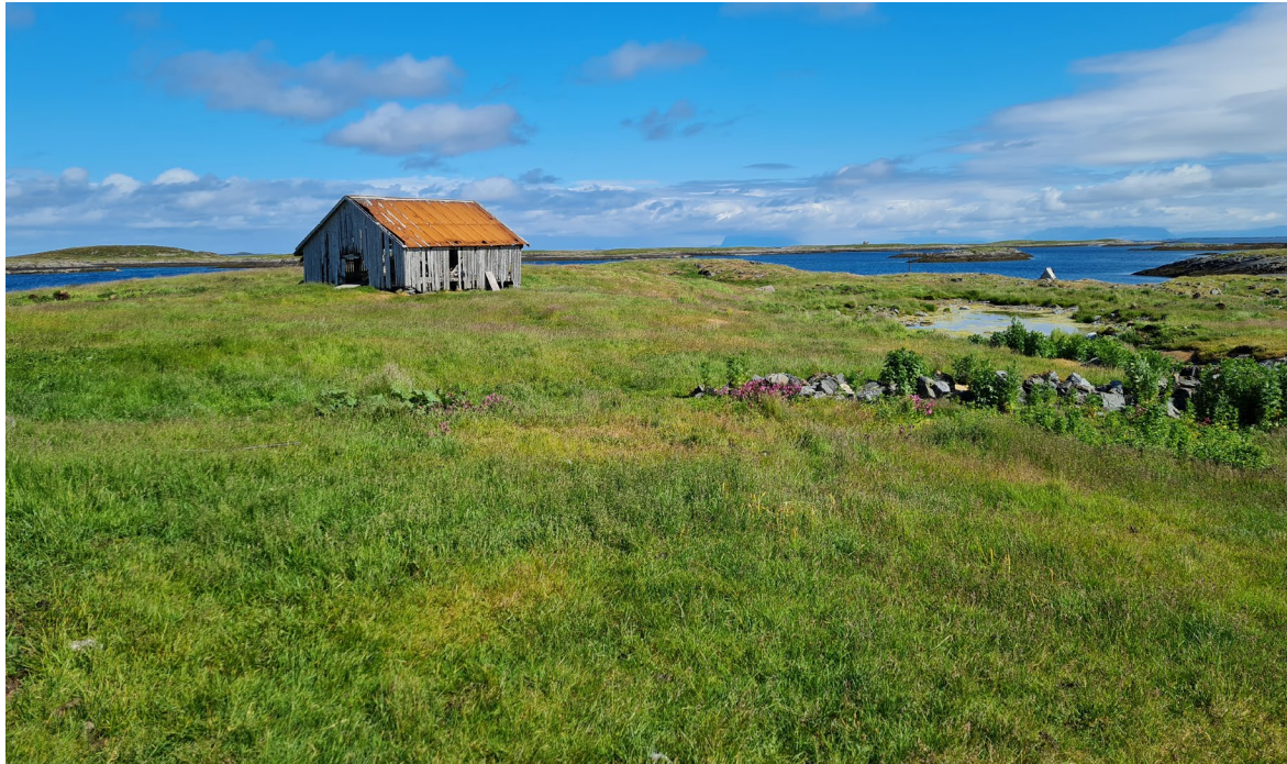
Figur 5. Slåttemarka på Santiholmen.