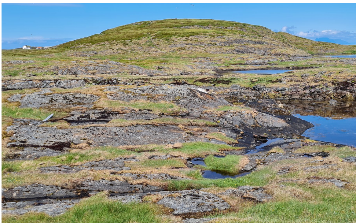
Figur 12. Store arealer i Mangdalsøya er skrint og bart berg stikker fram.