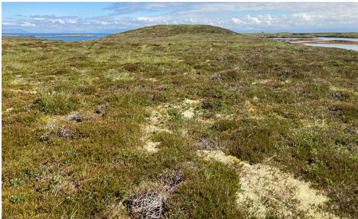
Figur 15. Kystlyngheia på Bryholmen.