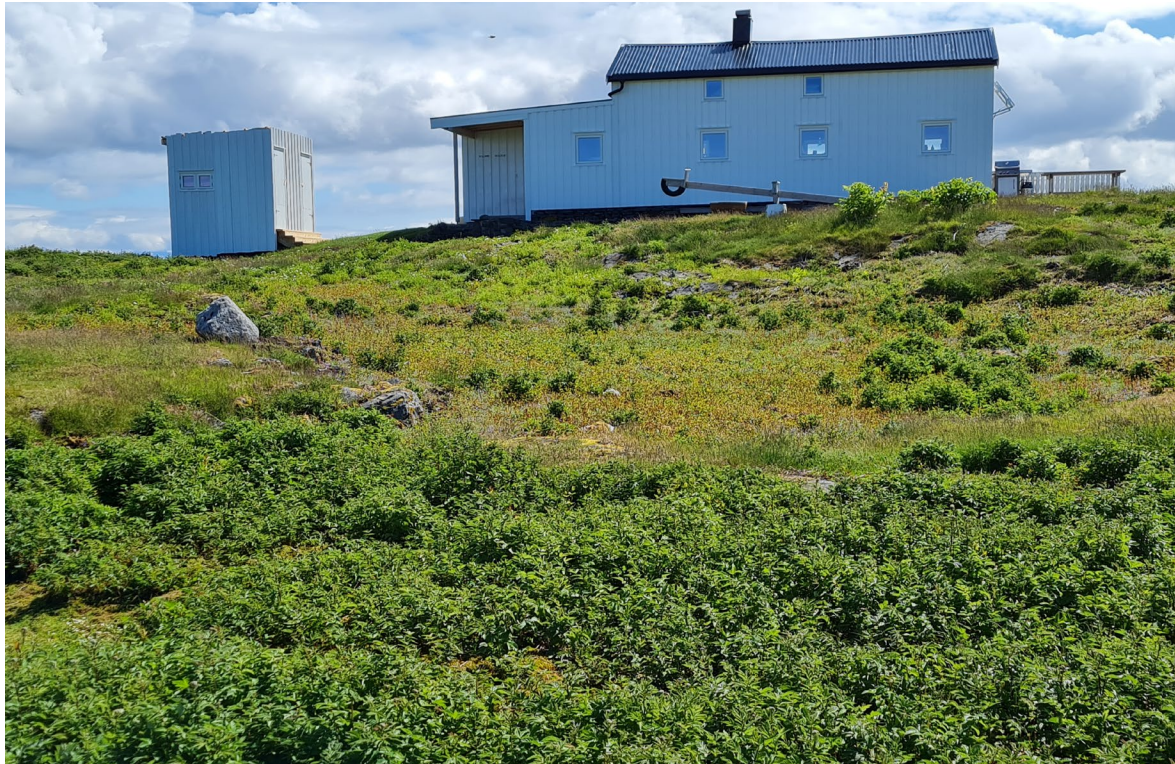
Figur 6. Slåttemarka på Steinsholmen barer preg av at den ikke har blitt slått i flere år og mjøddurt dominerer i større partier.