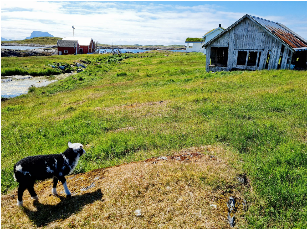
Figur 4. Det går kopplam på Santiholmen.