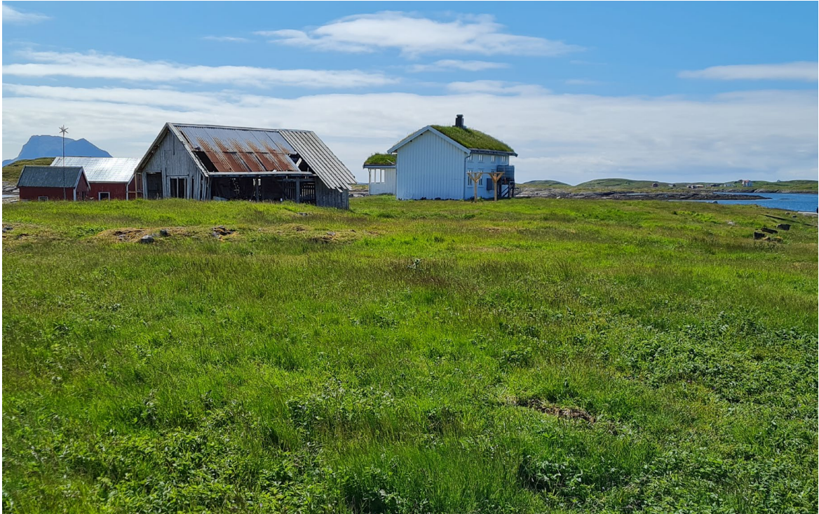
Figur 3. Slåttemarka på Santiholmen er i god tilstand.