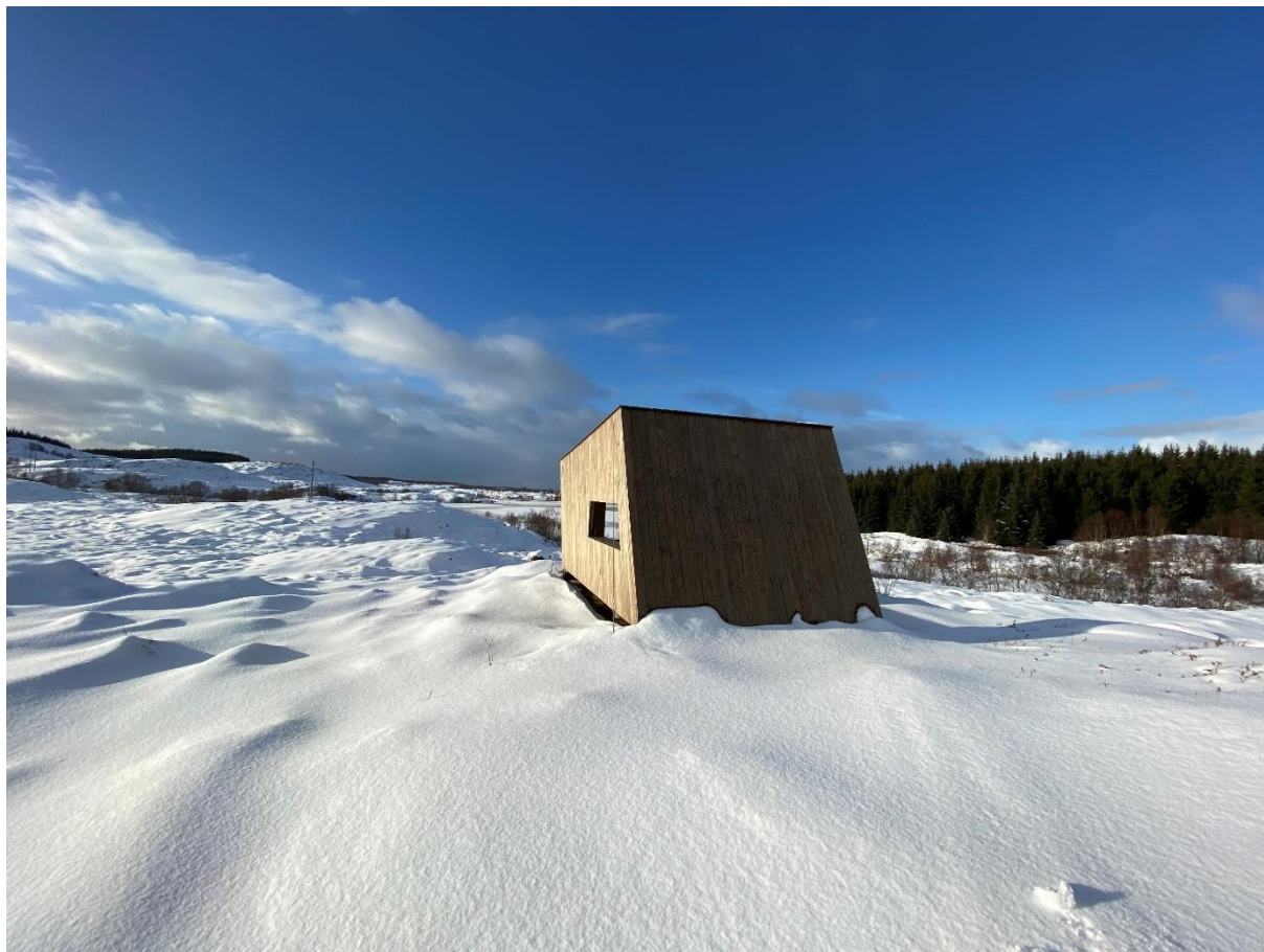
Bilde 4 Det nye fuglekikkerhuset med utsikt mot Sveavatnet.

I Eidemsliene naturreservat er det to merkede stier. Stien som går til Ervika brukes av lokale og andre turister som enten går til Ervika og tilbake eller fortsetter videre på merket sti til Sundsvoll. Vega verneområdestyre sluttførte i 2019 en kloppet sti på 80 meter på denne delen av stien for å hindre mer skade på vegetasjonen.