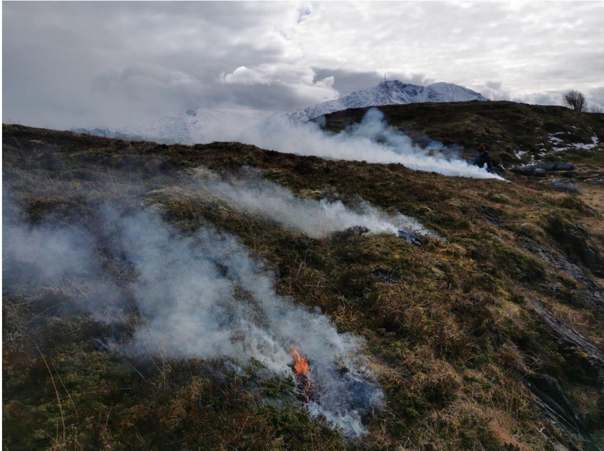
Bilde 2 Lyngbrenning i Holandsosen naturreservat (april 2021)

Grunneiere på Hysvær har tradisjon med å svi lyng på flere øyer i Hysvær/Søla landskapsvernområde.