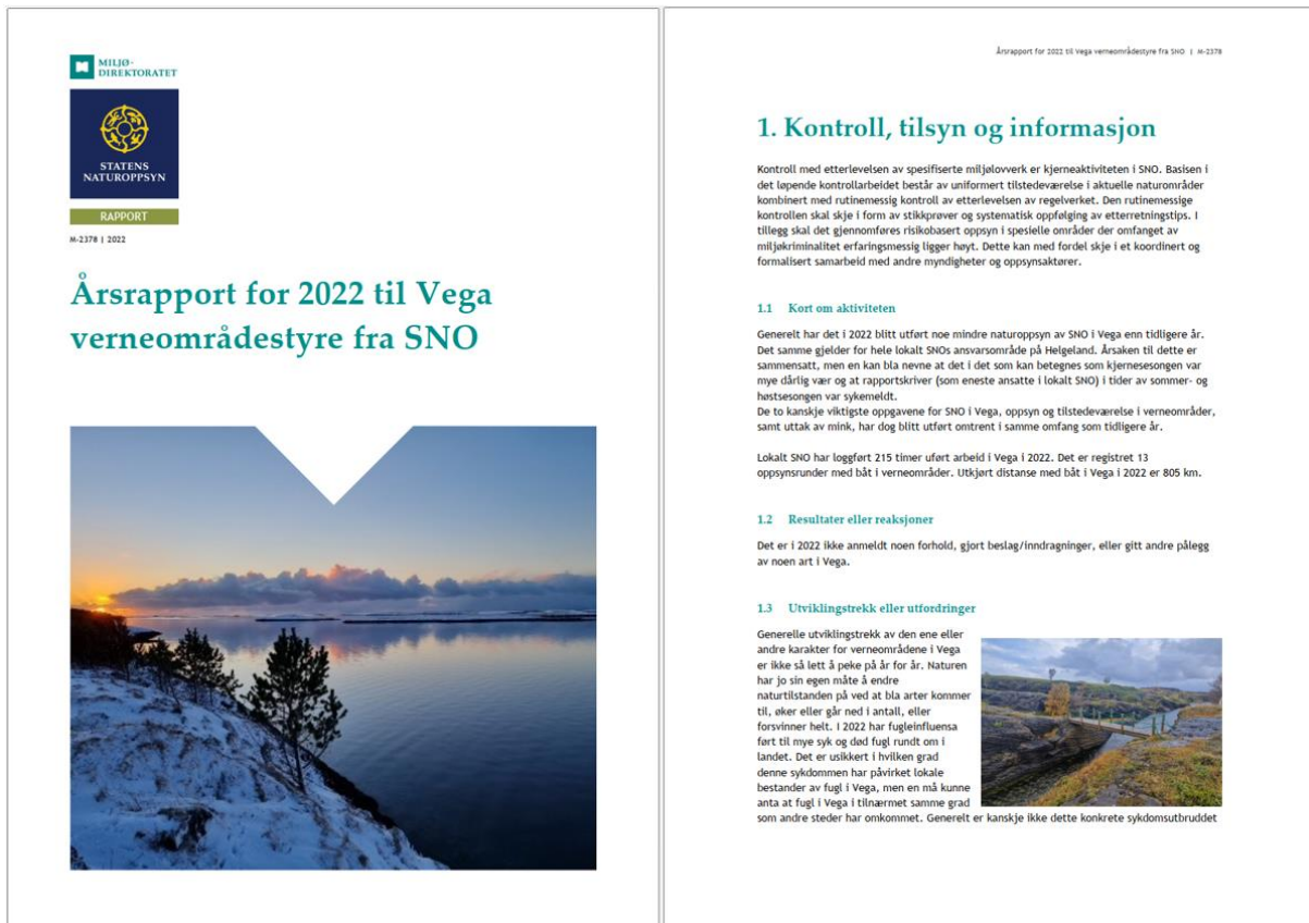
Bilde 6 Årsrapport til Vega verneområdestyre fra SNO for 2022

SNO har loggført 215 arbeidstimer i Vega i 2022, hvorav deler av dette er relatert til minkarbeid. Det er med tjenestebåt loggført totalt 805 km kjørt oppsyn/tilsyn og gjennomføring av tiltak i verneområder/verdensarvområdet i Vega. Det ble i 2022 utført noe mindre naturoppsyn av SNO i Vega enn tidligere år, det samme gjelder for hele SNOs ansvarsområde på Helgeland. Årsaken er blant annet mye dårlig vær i kjernesesongen, og at eneste ansatte i lokalt SNO var sykemeldt i deler av sommer- og høstsesongen.