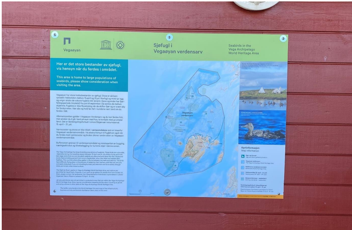
Bilde 5 Plakat med info om sjøfugl og ferdsel med båt i verdensarvområdet, hengt opp i gjestehavna på Igerøy.

Vega verneområdestyre og Stiftelsen Vegaøyen Verdensarv har spleiset på 5 plakater om ferdsel på sjø med hensyn på sjøfugl. I løpet av 2022 har disse blitt hengt opp på gjestehavner i Brønnøysund, Herøysundet Marina, Igerøy og Ylvingen. Den siste skal settes opp på gjestehavna i Skogsholmen.