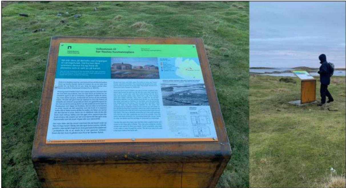
Bilde 3 Informasjonstavle om bosetting i Sør-Nautøya, Holandsosen naturreservat (desember 2020)

I Kjellerhaugvatnet finnes det to innfallsporter og en sti gjennom Kjellerhaugvatnet naturreservat. I tillegg har Vega verneområdestyre etablert en parkeringsplass ved hovedveien på Nes med informasjonstavle med vei/sti videre til gapahuken. Stien mellom Nes og Svea skal, ifølge Besøksstrategien for verneområdene på Vega, være lokal og skal ikke markedsføres.