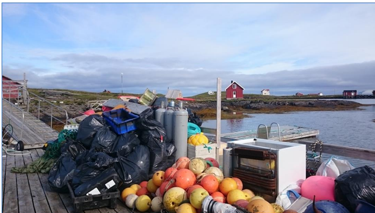
Bilde: Sjøppelet som ble samlet i Hysvær av elever fra Vega skole september 2015.