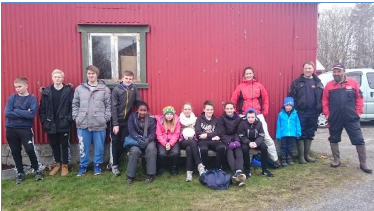
Bilde: Elever fra Vega skole deltok i april 2015 på sanking av grågåsegg i samarbeid med grunneier

Det ble i juni 2015 gjort en telling av bestanden på hovedøya Vega. Rapporten ligger på Vega verneområdestyre sin hjemmeside: http://www.nasjonalparkstyre.no/Vega/