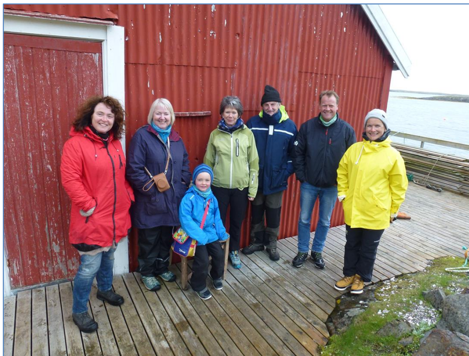
Bilde: Vega verneområdestyre på Befaring i Hysvær juni 2015.