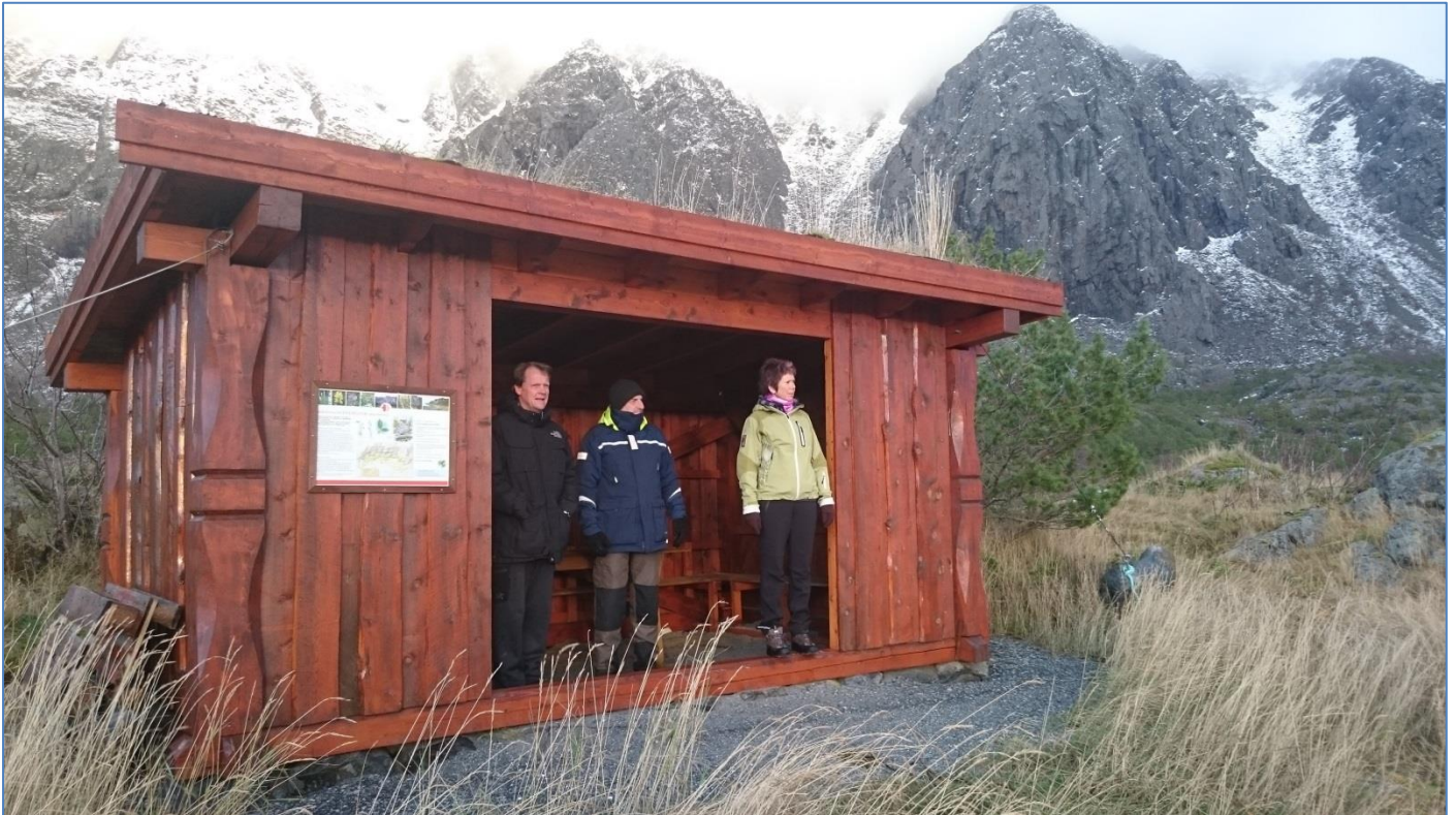
Bilde: Vega verneområdestyre på befaring til informasjonspunkt ved Eidemsliene naturreservat.