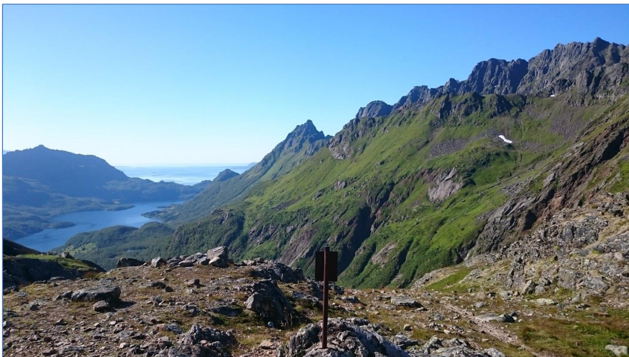
Bilde av Møysalen nasjonalpark august 2015