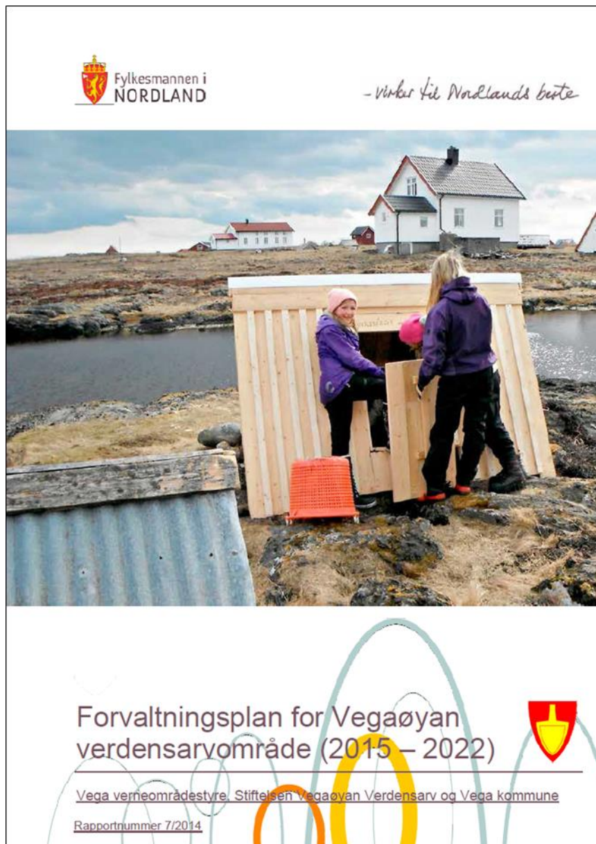
Bilde: Forsiden av Forvaltningsplanen for Vegaøyen verdensarvområde (2015 – 2022)

Midlene disponeres av styret. Forvaltningsplanen for Vegaøyen verdensarvområde ble endelig godkjent av Miljødirektoratet 23.10.2014 og Vega kommune sluttet seg til planen i kommunestyret 19.3.2015. Utgifter til arbeidet med forvaltningsplanene ble i 2015 brukt til trykking av 250 eksemplar samt porto til utsending av planen til relevante mottakere.