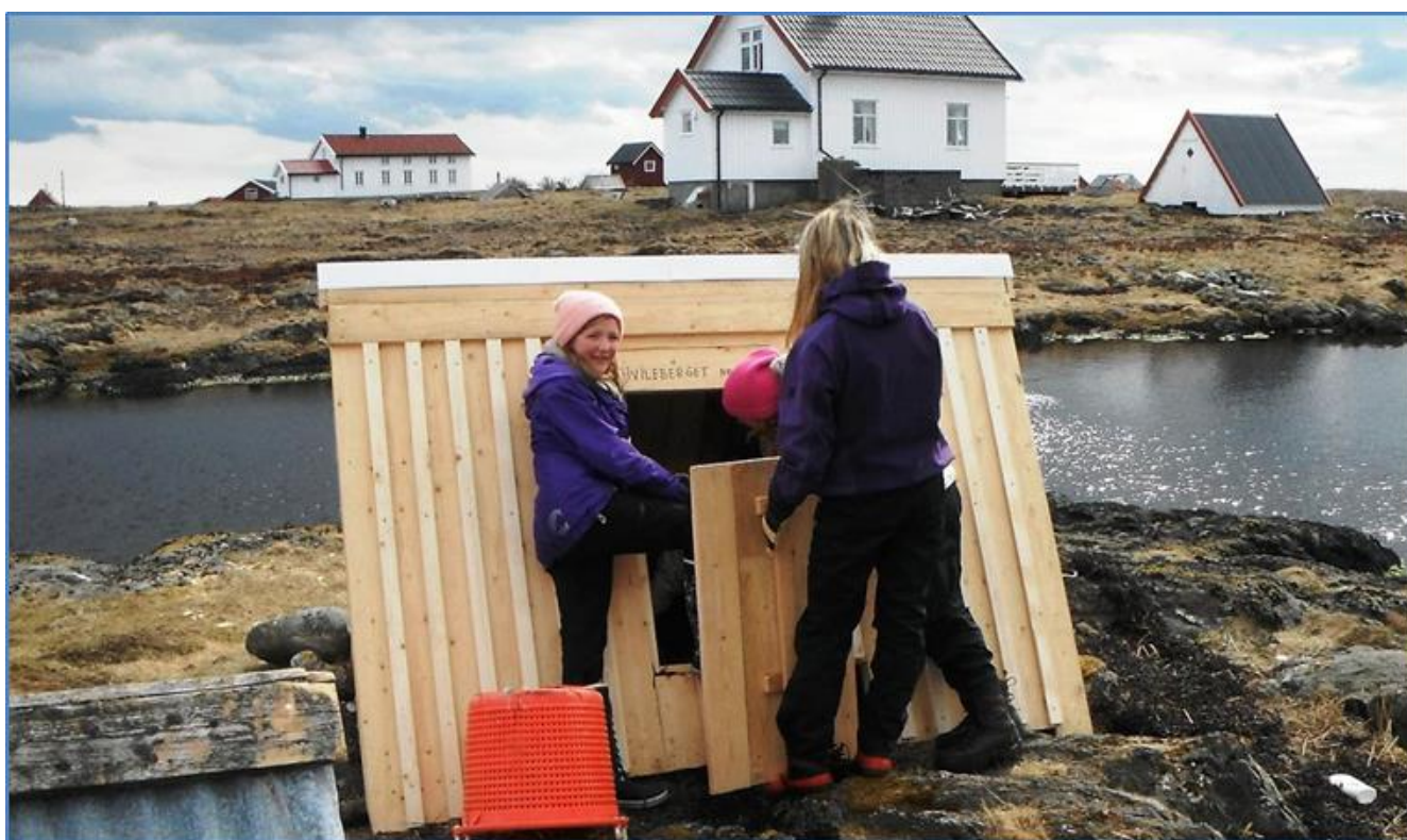
Bilde: Barn og unge i verdensarvområdet

Utkast av forvaltningsplanen ble godkjent i Vega verneområdestyre 24.6.2014. Den ble endelig godkjent av Miljødirektoratet 23.10.2014. Det som gjenstår for 2015 er at Vega kommune slutter seg til planen og deretter trykking. I tillegg skal et sammendrag oversettes til Engelsk.