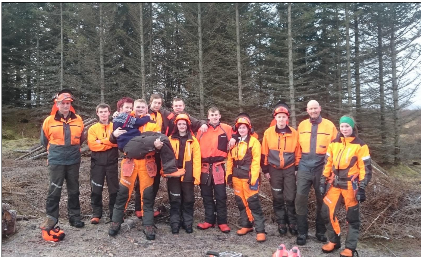
Bilde: Skogbrukselever fra Mosjøen videregående skole i Kjellerhaugvatnet mars 2015.

Vega verneområdestyre fikk 470 000 kr (uten moms) gjennom bestillingsdialogen til tiltak i verneområdene. I tillegg fikk Vega verneområdestyre etter tildelt 325 000 (inkl moms) gjennom supplerende tildelinger i løpet av 2015. Se hvordan disse ble fordelt i kapitlene under.