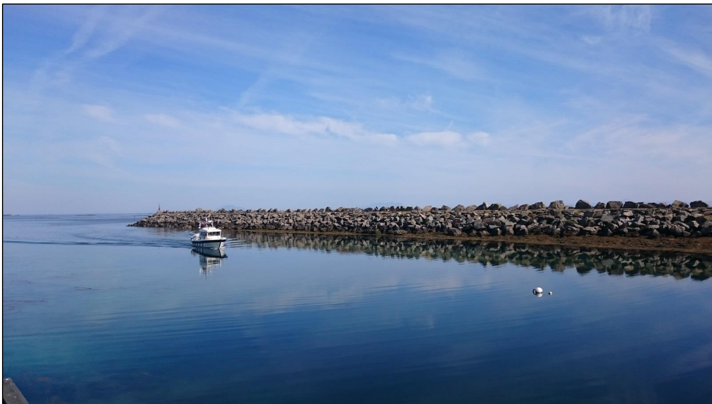
Bilde: SNO på befaring i Skjærvær, august 2015.

Forvaltningsmyndigheten og SNO lokalt kan avtale å gjennomføre slikt feltarbeid gjennom bestillingsdialogen. SNO lokalt vil avstemme disse oppgavene ift andre pålagte oppgaver og kapasitet.