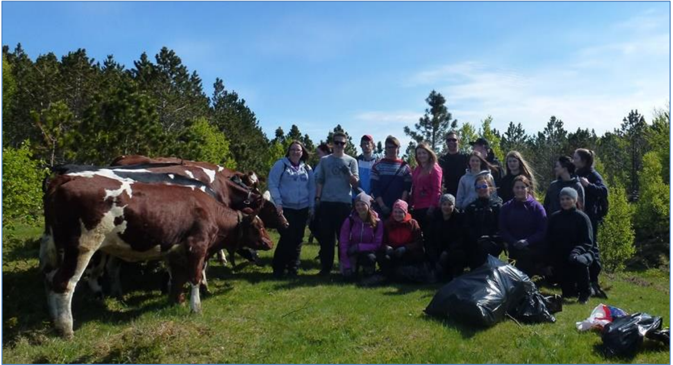
Bilder av elever fra Mosjøen vgs. i Holandsosen naturreservat for å plukke sitkaplanter, juni 2015.