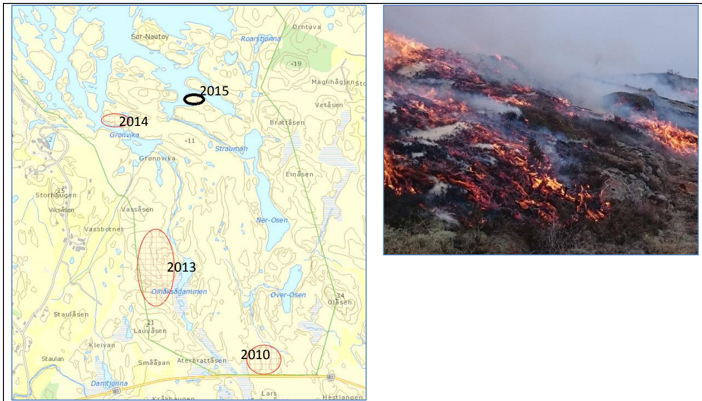
Kart og bilde av svidde flater i Holandsosen naturreservat fra 2010 - 2015