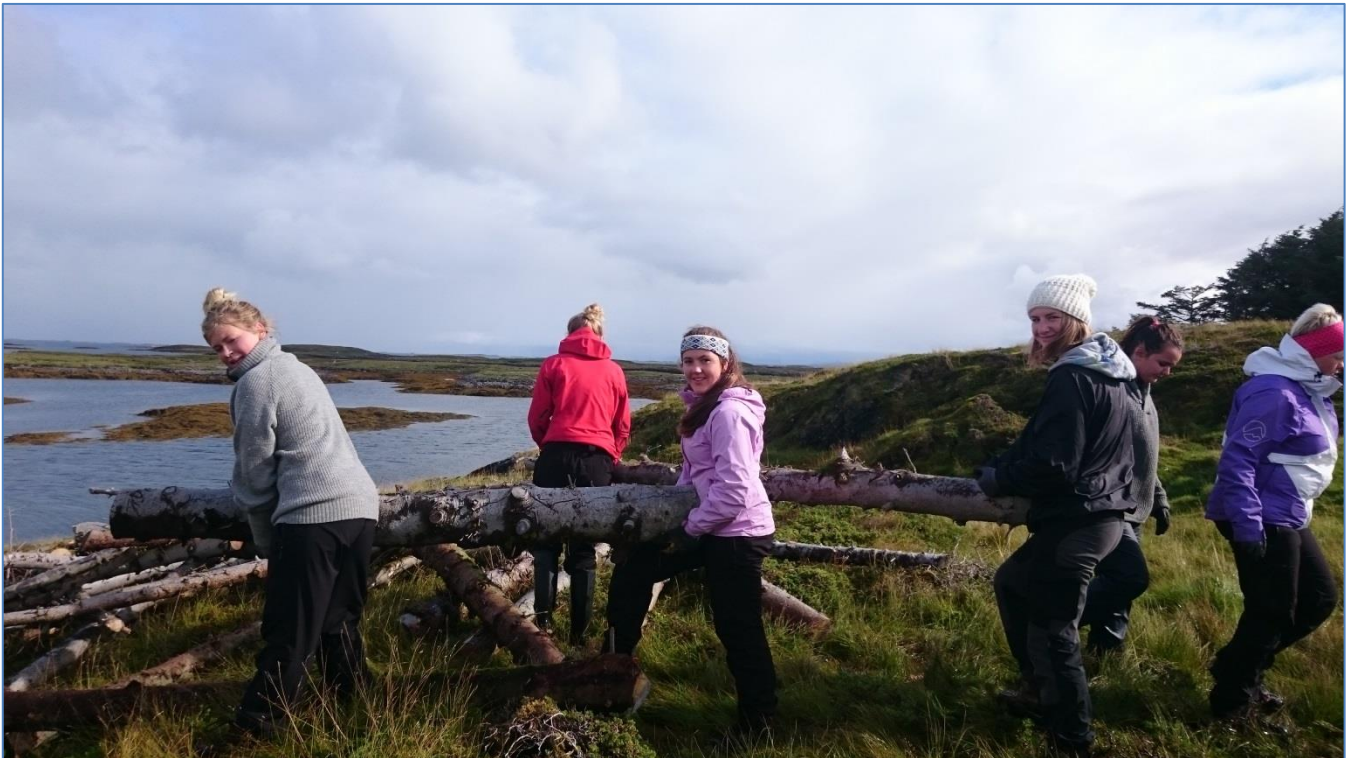
Bilde: Elever fra Vega skole bærer tømmer av sitkaskog i Hysvær september 2015

Elevene tok bilder underveis (med egen mobil) som ble brukt i etterarbeidet samt en presentasjon av arbeidet som de gjorde i Hysvær. Sjøppelet ble levert inn på SHMIL i Brønnøysund.