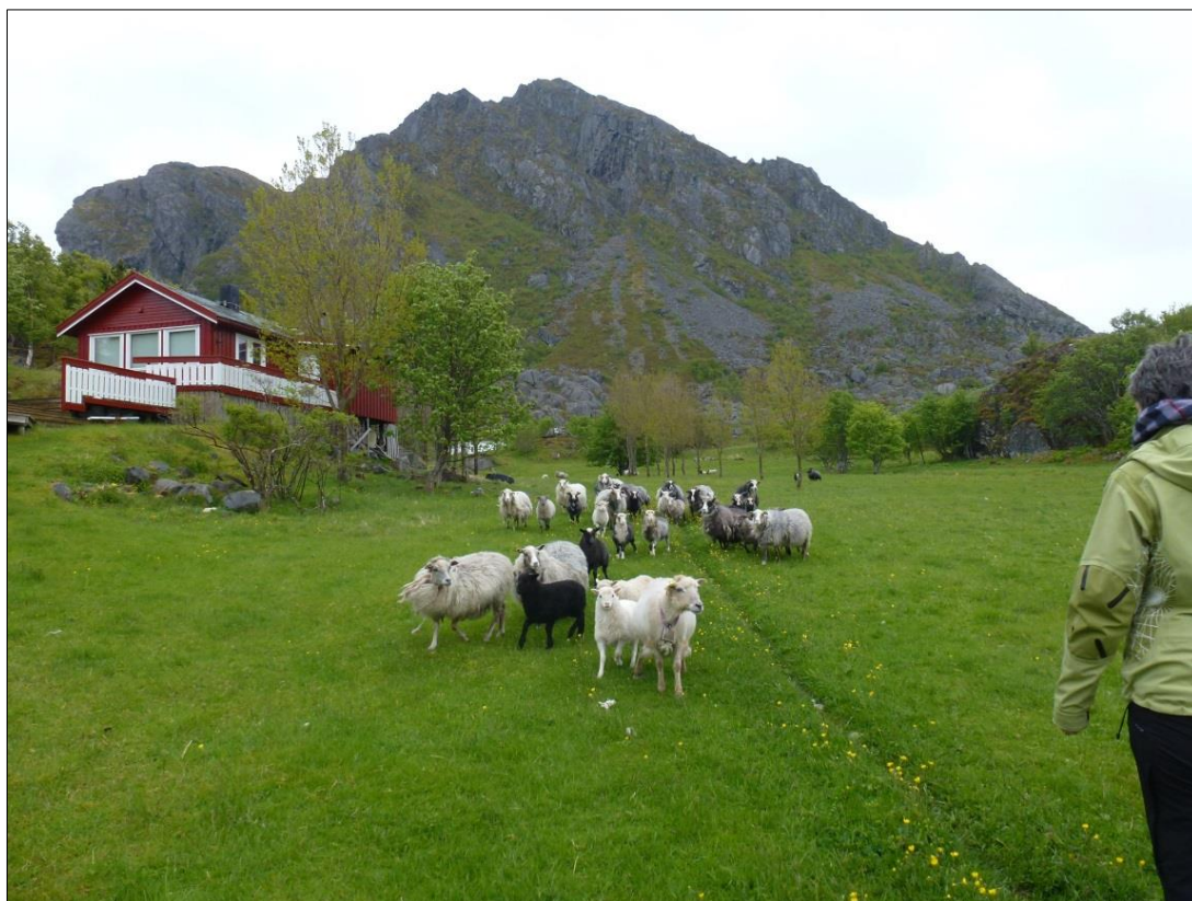
Bilde: Styret på befaring til Sjøla, juni 2015

Midlene disponeres av styret. Reise og møtegodtgjørelse for Vega verneområdestyre. Vega verneområdestyre hadde i 2015 fire styremøter og to befaringer, hvor den ene befaringen gikk til verneområder i sjø og den andre til verneområdene på hovedøya Vega.