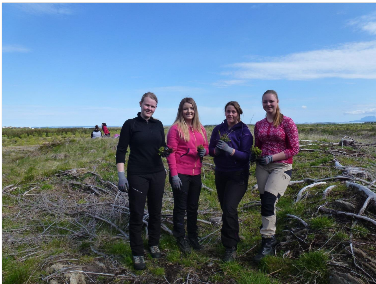
Bilder av elever fra Mosjøen vgs. i Kjellerhaugvatnet naturreservat for å plukke sikaplanter, juni 2015.

I juni 2015 lånte verneområdeforvalter elever fra Mosjøen vgs. og satte dem inn i denne problemstillingen, de blir med til Holandsosen og Kjellerhaugvatnet å «napper» opp små sitkatrær.