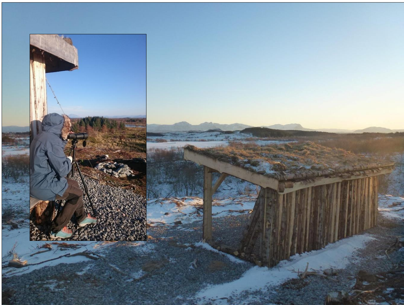
Fuglekiking fra Kjellerhaugen, høst 2016.