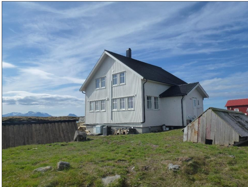
Vega verneområdestyre på befaring i Lånan, mai 2016.