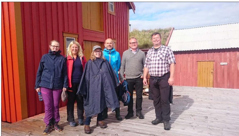
Kommunikasjonsavdelingen ved KLD besøker Skjærvær fuglefredningsområde