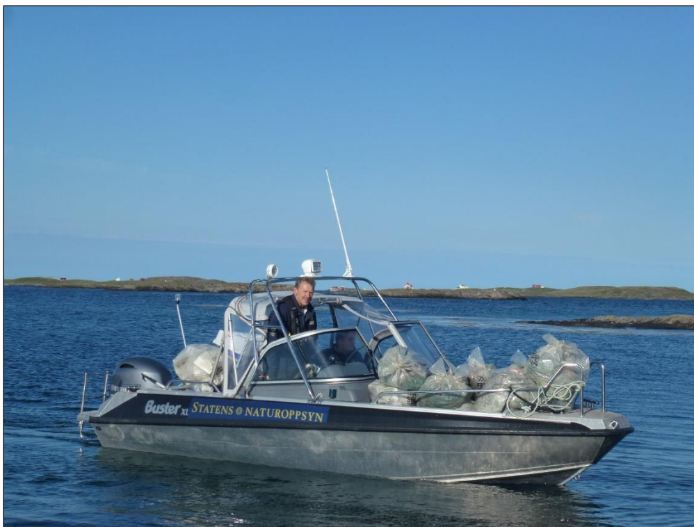
SNO var en av samarbeidsaktørene i søppelsanking i Hysvær, september 2016.

SNO er selv ansvarlig for planlegging, prioriteringer, personell og økonomi for gjennomføring og rapportering av disse "kjerneoppgavene". Det vil likevel være av stor betydning at forvaltningsmyndigheten gir SNO faglige premisser og forslag til prioriteringer for aktiviteten som ligger i SNOs egen oppgaveportefølje. Forvaltningsmyndighetene kan i tillegg ha behov for å få utført feltoppgaver ut over SNOs egne, faste kjerneoppgaver, som registreringsarbeid, særlige tiltak i verneområder (informasjons-, skjøtsels- eller tilretteleggingstiltak) og lignende. Forvaltningsmyndigheten og SNO lokalt kan avtale å gjennomføre slikt feltarbeid gjennom bestillingsdialogen. SNO lokalt vil avstemme disse oppgavene ift andre pålagte oppgaver og kapasitet.