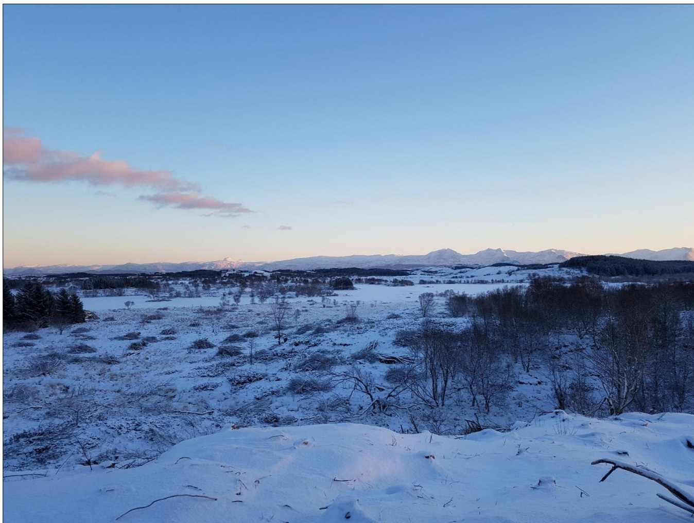
Bilde er tatt fra Kjellerhaugen med utsikt mot hogstfeltene, hogst av lauvtrær nærmest.