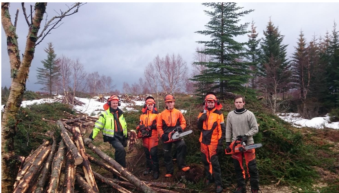
Bilde av skogbrukselever fra Mosjøen videregående skole i Kjellerhaugvatnet naturreservat, mars 2016

Dette er et samarbeid mellom Vega verneområdestyre og Mosjøen vgs. Det er femte sesongen vi fikk besøk av elever og lærere fra Mosjøen vgs.