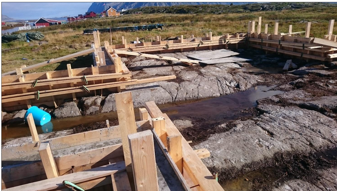
Nybygging i Muddvær fuglefredningsområde, september 2016.

Se nærmere beskrivelse i SNO lokalt sin årsrapport 2016, i vedlegg.