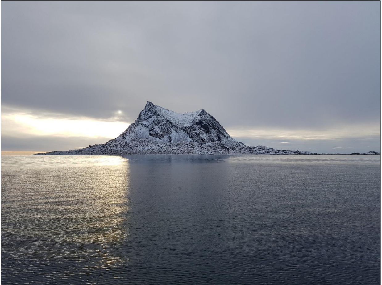
Sjøla i vinterdrakt. Hysvær/Sjøla landskapsvernområde.