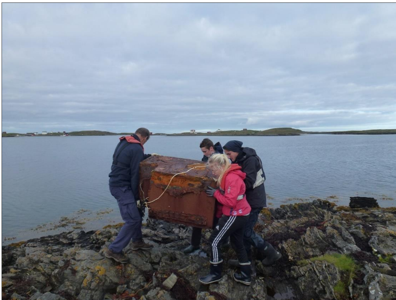
Innsamling av søppel fra øyene i Hysvær, september 2016.

Dette er et samarbeid mellom grunneiere, Vega skole, SNO og Vega verneområdestyre.