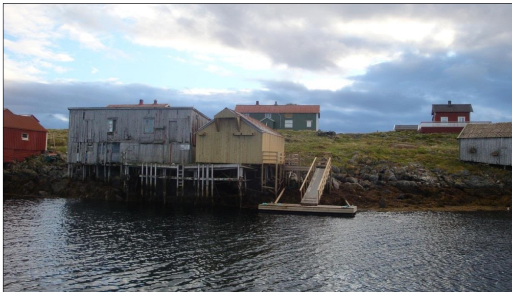
Bilde: Muddvær fuglefredningsområde