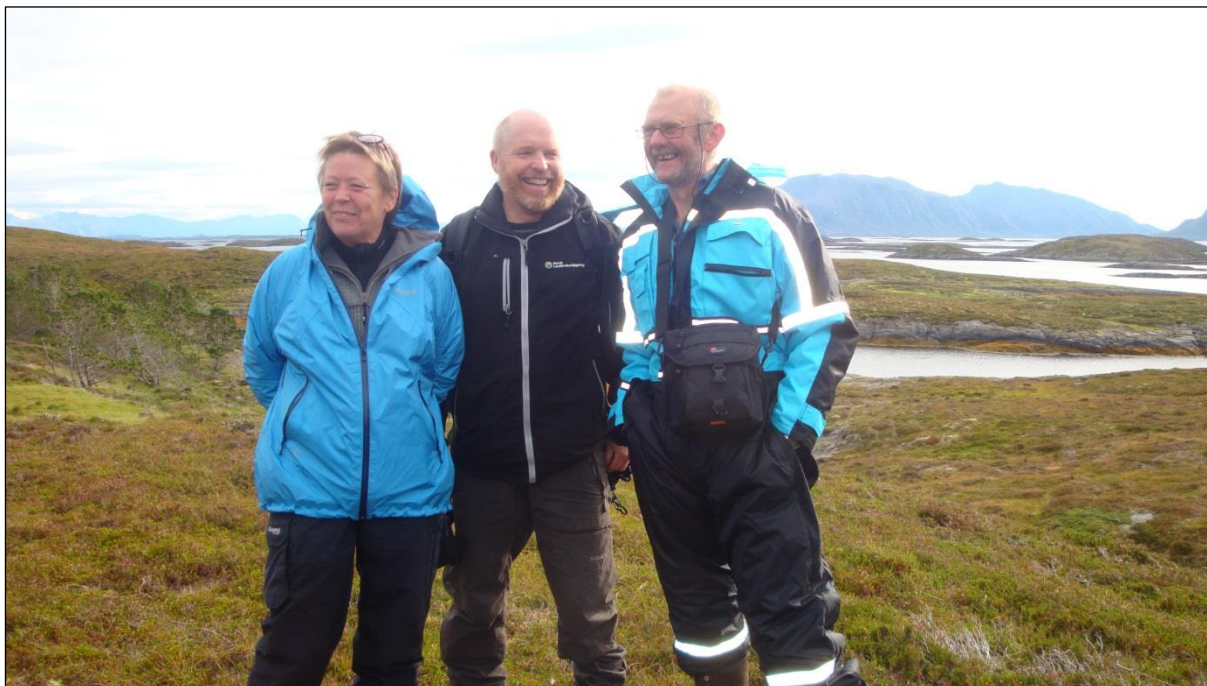
Bilde: Markdag om gammelnorsk sau i Hysvær, september 2012.