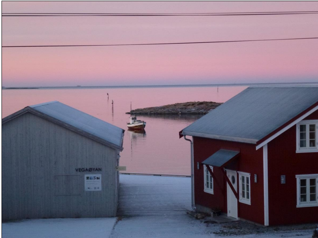
Bilde: Nes, porten til Vegaøyen Verdensarv

Vedlegg: «Årsrapport SNO-Helgeland 2012»