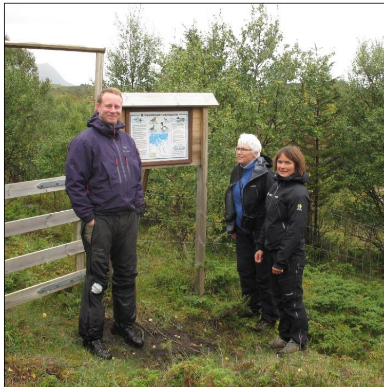
Bilde: Befaring i Holandsosen naturreservat