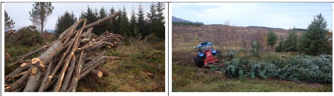
Bilder: Hogst og frakting av sitkaskog fra Kjellerhaugvatnet naturreservat