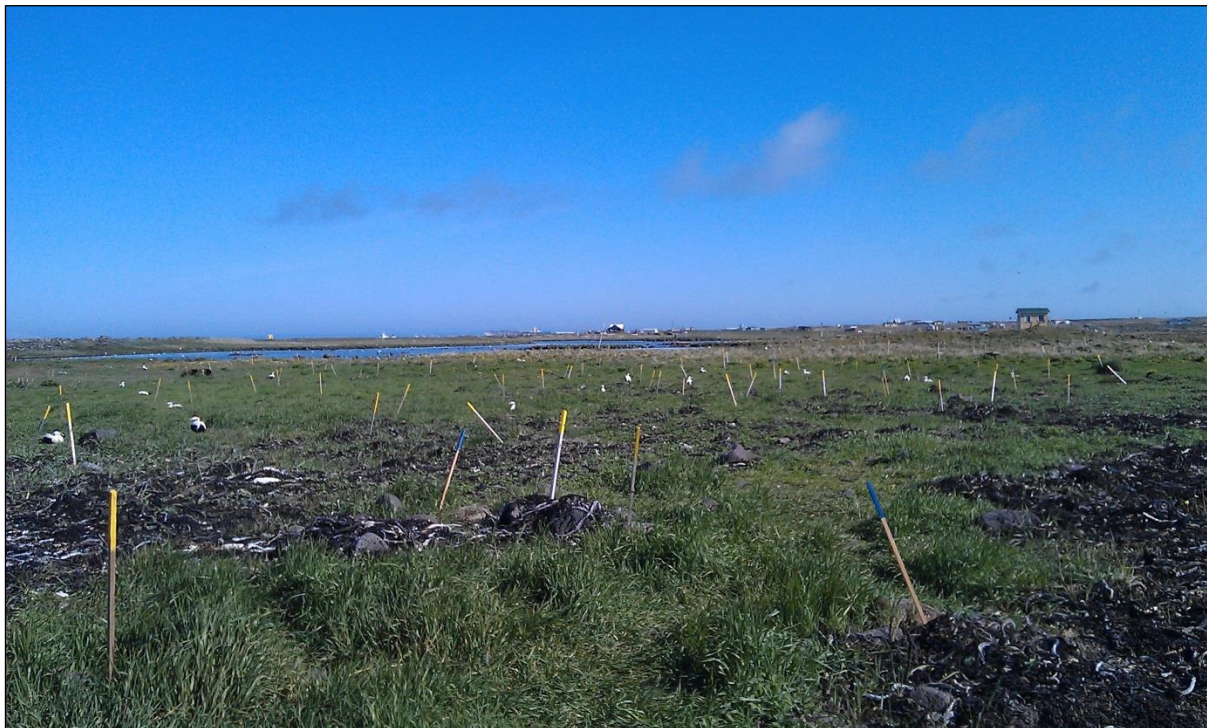
Bilde: Ærfugl farm i Island, mai 2012.

Verneområdeforvalter er med i arbeidsgruppe om kartlegging og verdisetting av friluftsområder på Vega.