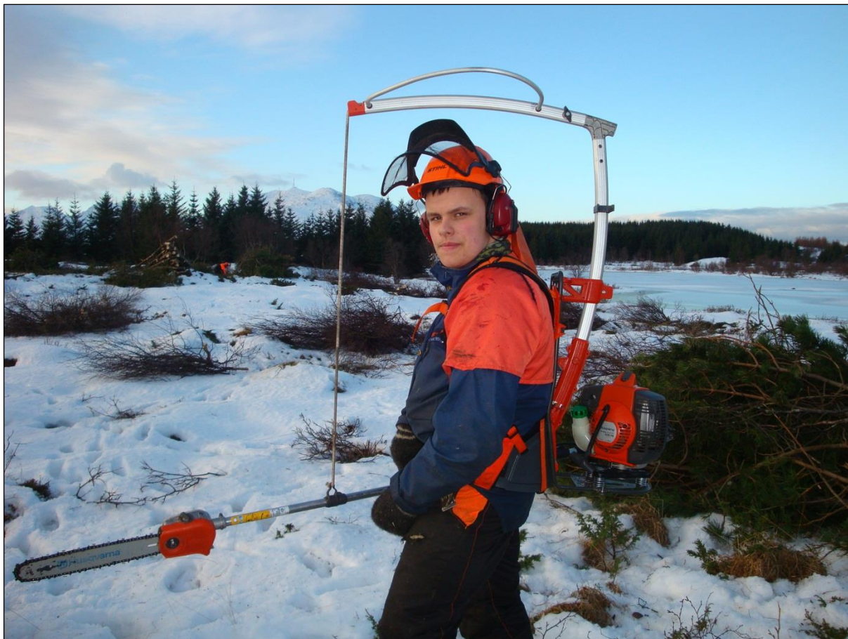
Bilde: Skogbrukselever fra Mosjøen vgs får praktisk erfaring i Kjellerhaugvatnet naturreservat, februar 2012.

Som vist i kapittel 2.0 fikk Vega verneområdestyre 80 000 kr til tiltaksmidler og styret prioriterte å bruke tiltaksmidlene til overvåking av fugl i Kjellerhaugvatnet (35 000 kr), søppelaksjoner (11 000 kr), vedlikehold/slutføring av gjerder i Holandsosen og Kjellerhaugvatnet (20 000 kr) samt til diverse uforutsette utgifter til tiltak i verneområdene.