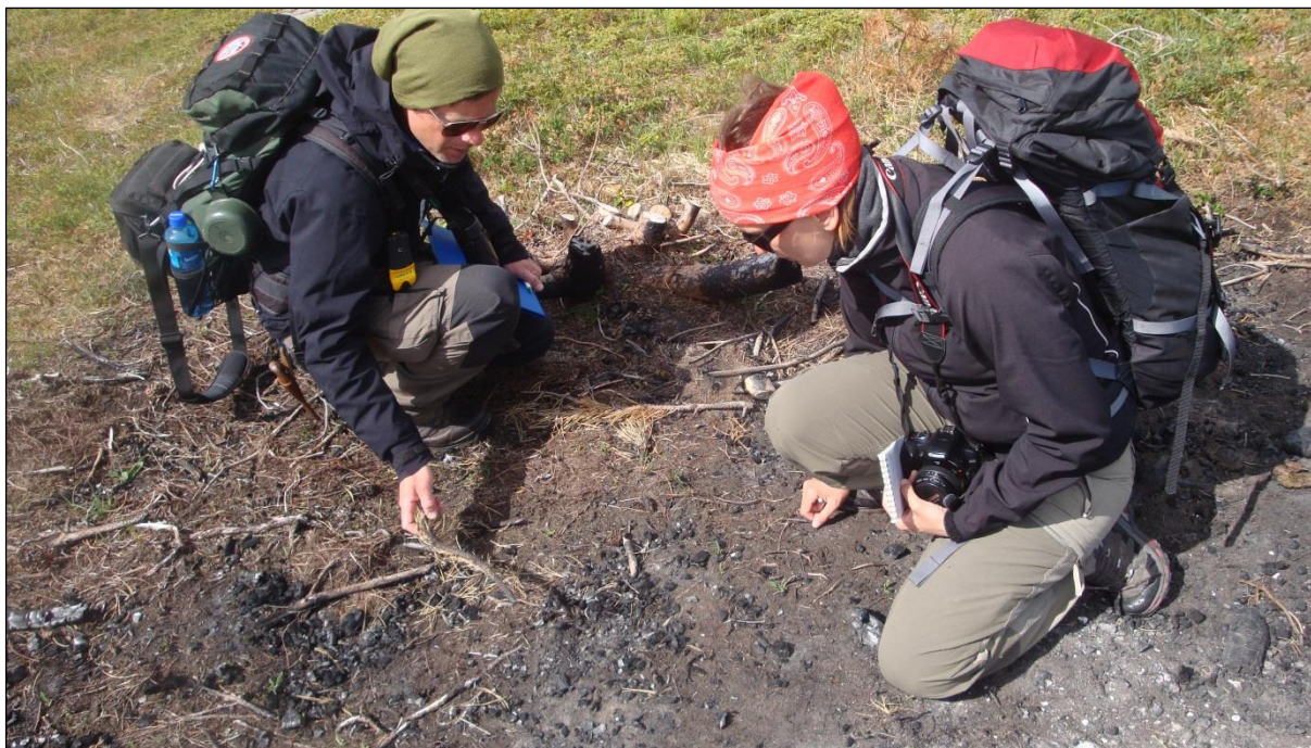
Bilde: Bioforsk Tjøtta overvåker svidd område i Holandsosen naturreservat.

I tillegg avtalte Vega verneområdestyre følgende prioriteringer for aktiviteten til SNO-lokalt: