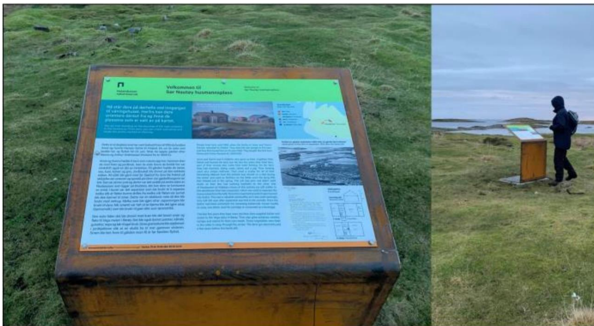
Bilde 3 Informasjonstavle om bosetting i Sør-Nautøya, Holandsosen naturreservat (desember 2020)

I Kjellerhaugvatnet finnes det to innfallsporter og en sti gjennom Kjellerhaugvatnet naturreservat. I tillegg har Vega verneområdestyre etablert en parkeringsplass ved hovedveien på Nes med informasjonstavle med vei/sti videre til gapahuken. Stien mellom Nes og Svea skal, ifølge Besøksstrategien for verneområdene på Vega, være lokal og skal ikke markedsføres.