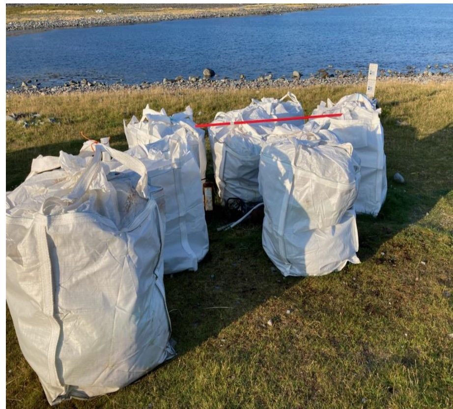
Persfjorden Vardø VGS