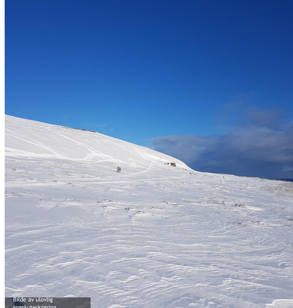
Bilde av ulovlig snøscooterkjøring