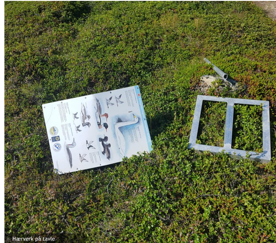
Hærverk på tavle