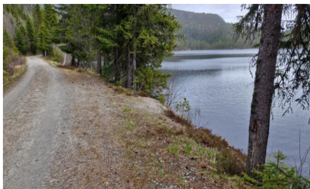
Figur 1: Foto som viser tiltakets plassering

Tegningene som fulgte opprinnelig søknad viser en konstruksjon som er 6 meter bred og som strekker seg 3 meter ut i vannet. Endret søknad vil redusere tiltaket til en brygge som er 5 x 2 m.