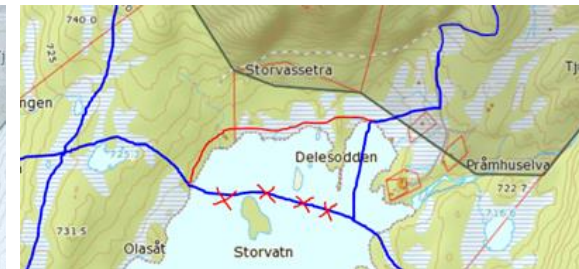
Fig. 2 Kartskisse som viser traseer jfr. forvaltningsplan