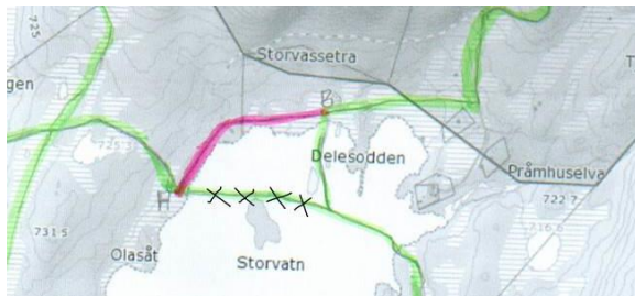
Fig. 1 Kartskisse som følger søknaden

Den nye løypetraseen erstatter eksisterende trase over vann. Søknaden viser til at eksisterende løype går på vestsiden av Delesodden ut i Storvatnet (Fig. 1), mens godkjent løypetrase i forvaltningsplan for verneområdet er kartfestet på østsiden av odden (Fig. 2). Vedlagte skjermdump skisserer forskjellen i innregnede traseer. Hvor denne traseen går har ingen stor praktisk betydning for ny løype slik den er beskrevet i søknaden.