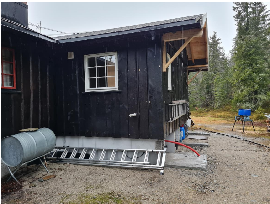
Bilde 2: Oppfølging av avvik, hytte Sinern.

Det har i år vært brukt 132 timeverk på tilsyn og kontroller i verneområdet. Mye av dette er oppfølging av forrige års avdekking av ureglementerte tiltak. I tillegg har SNO ført tilsyn på andre lokaliteter for å kunne avdekke om det har vært gjort tiltak det ikke er søkt om. Det er ikke avdekket andre forhold.