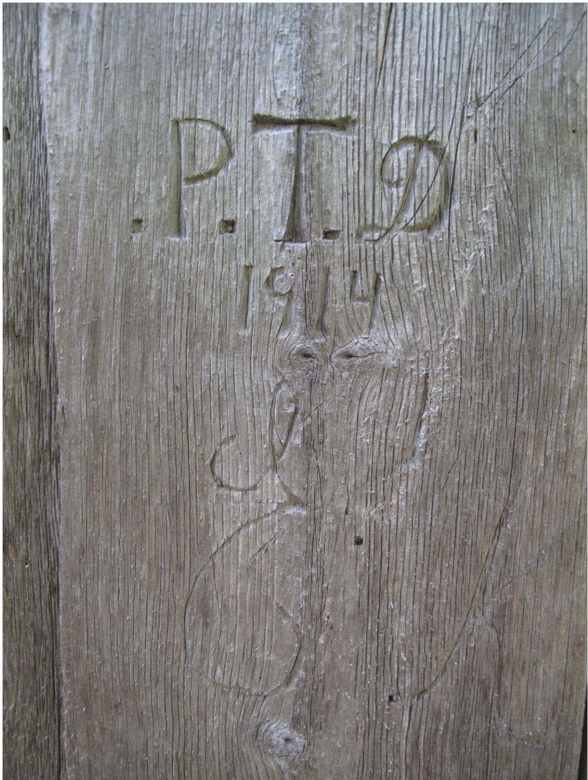
Detalj dør, Skårsetra.