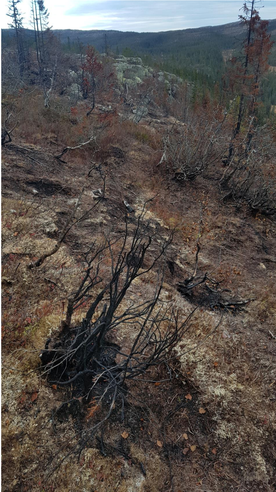
Brannflate sett fra sør mot nord