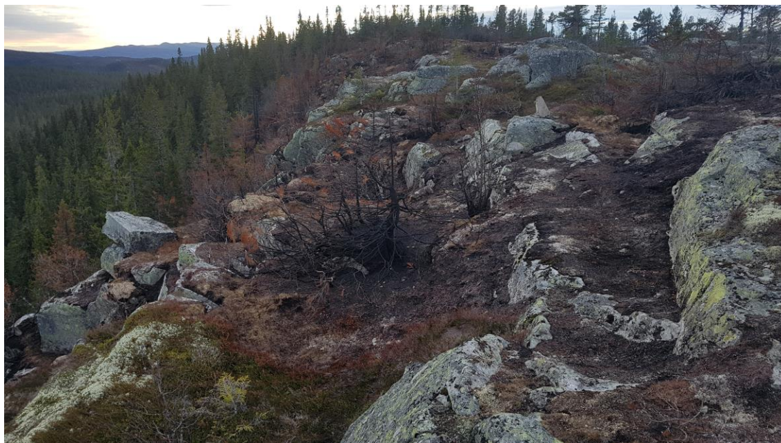
Brannflate sett fra nord mot sør.