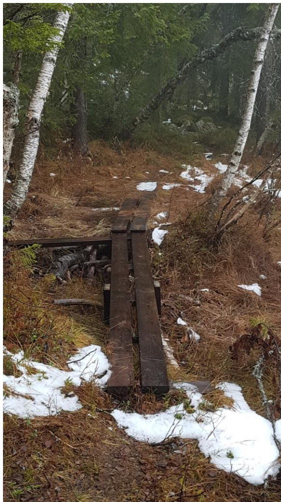
Klopp over liten bekk.

Gjennomført og lagt inn i verneområdeloggen.