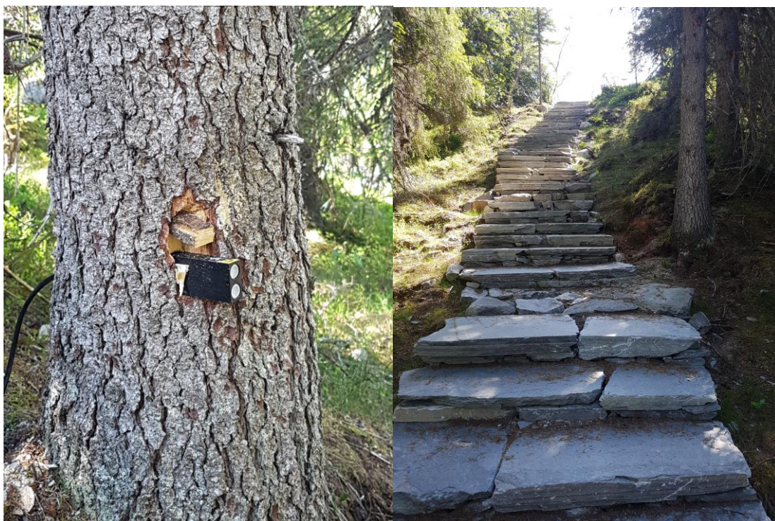
Plasseringen av ferdselstellersen ved Utvollan.

Det har i år vært satt opp ferdselsteller i stien opp til Madonnaen. Trafikken har vært enorm, og stien ble kåret til Norges beste tursti.