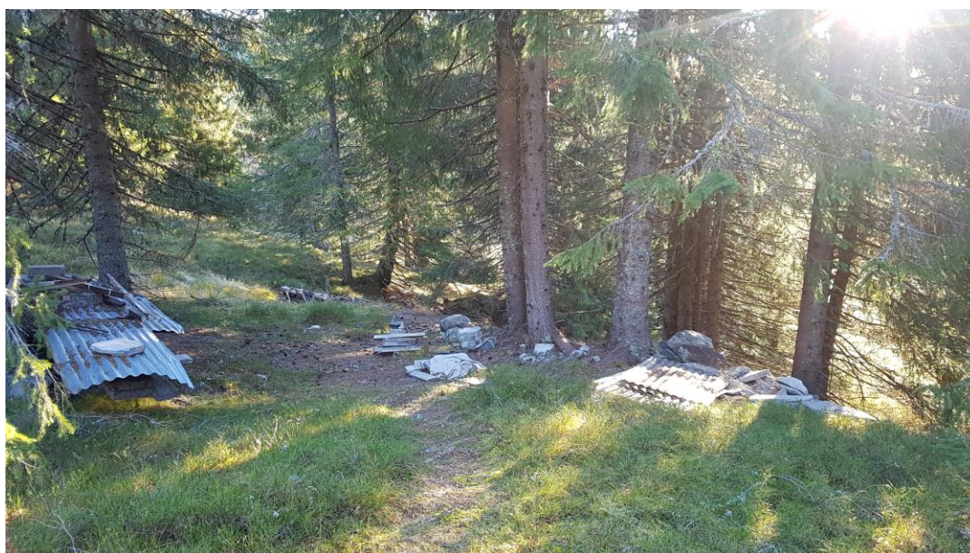
Bilde 2: Ulovlig utedo/uthus Øvre Bufjell er fjernet.

Pålegg om tilbakeføring/fjerning av utedo/uthus fra forvaltningen er fulgt opp med tilsyn. Det ulovlige bygget var fjernet, og pålegget var i så måte fulgt opp.