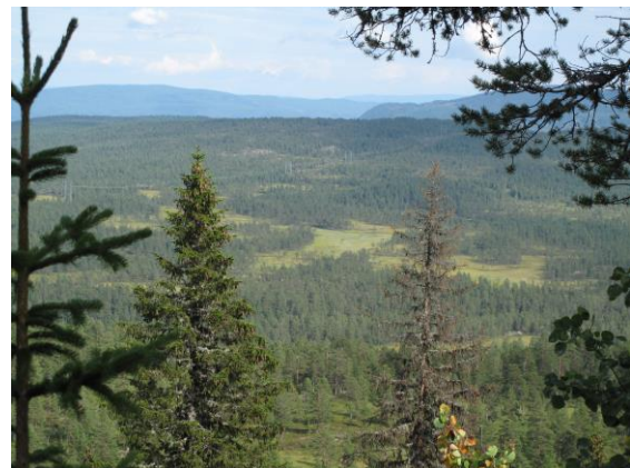
Strandemyrene, et av områdene hvor fiskeørna hekker.

Fiskeørnreiret og fiskeørna ved Buvatn er fulgt opp, og den ser ut til å trives. I tillegg er det registrert 3 reir til i eller tilknytning verneområdet.