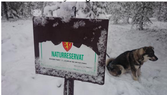
Enkelte løveskilt mister klistremerket. Nye skilt vil bli å sette opp i 2017.

SNO har ikke avdekket ureglementerte hendelser av betydning inneværende år.