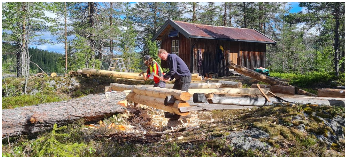
Tilsyn ifb med restaurering av stall ved Rollagstjønn.

Det har i år vært brukt 89 timeverk på tilsyn og kontroller i verneområdet. Det er anmeldt et forhold i forbindelse med graving av løype' i Vestmannskard.