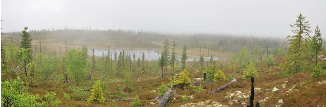
Nord for Gamleseeterdalen