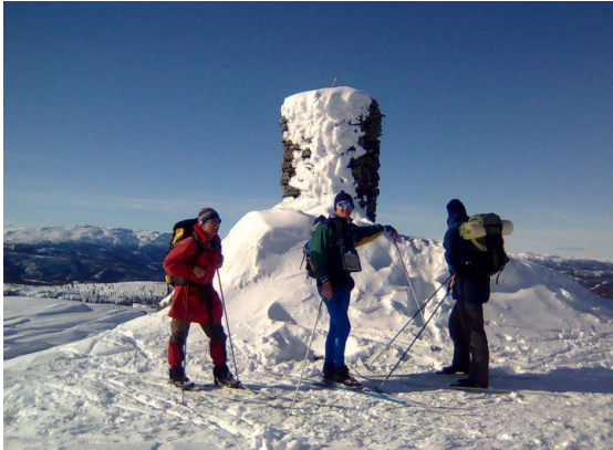
Deler av forvaltningsstyret på Vardefjell

Administrasjon og sekretariat kom først på plass et godt stykke ut i 2009. Flere aktuelle tiltak ble lagt på is i påvente av godkjent forvaltningsplan, og en del midler står derfor ubrukt og vil bli avsatt til senere bruk.