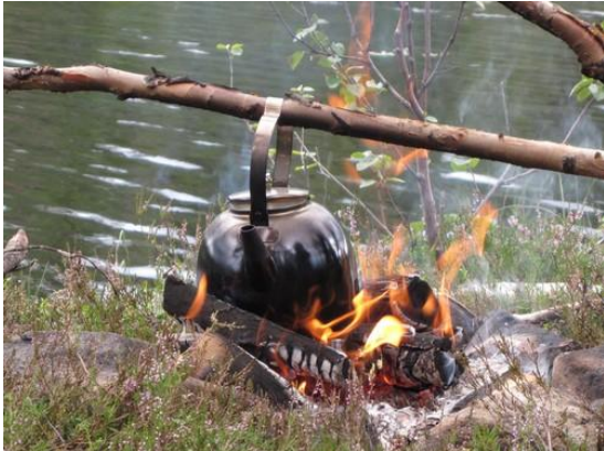
Svartkjelen til SNO