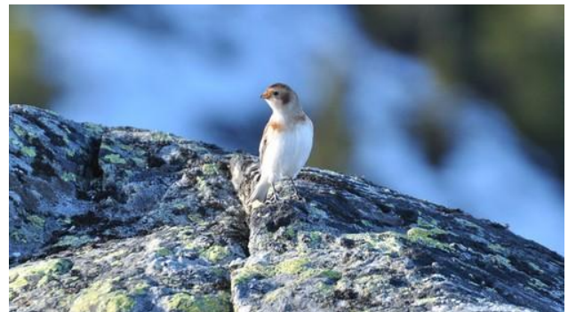
Snøspurv på Slettefjell