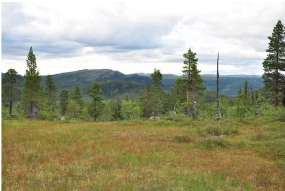
Nordlia ved Vardefjell mot Sølandsfjell