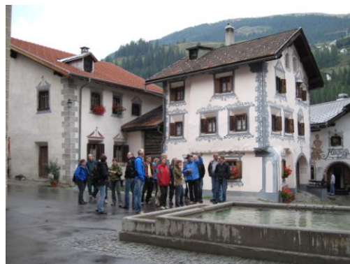
Besøk i landsbyen Bergün, Sveits

Forvalter deltok sammen med ett styremedlem på Studietur til Sveits 11-15 september for å se på forvaltning av verneområder og næringsutvikling i tilknytning til disse. Turen var initiert og organisert av UMB i samarbeid med Norsk landbruksrådgivning, og omfattet besøk i Parc Ela, forskningsinstituttet i Rapperswil og UNESCO Biosphere Entlebuch.