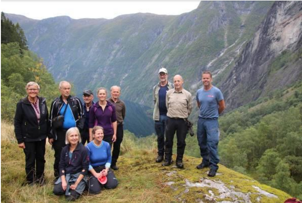
Møtedeltakarane på utsiktspunkt ved Botnastølen.