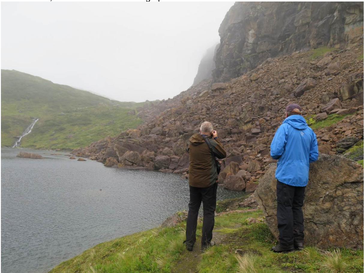
Figur 3 Ura under Raudberget, der den T-merka stien går gjennom.

Det har kome spørsmål til verneområdeforvaltninga om det er mogleg å utbetra stien gjennom ura under Raudberget. RU meinte det berre bør vera enkel tilpassing av stien gjennom ura for å gjera det betre å gå i ura. Det bør ikkje byggjast sti, men legge steinar i ura betre til rette, slik at det vert lettare å gå på steinane.