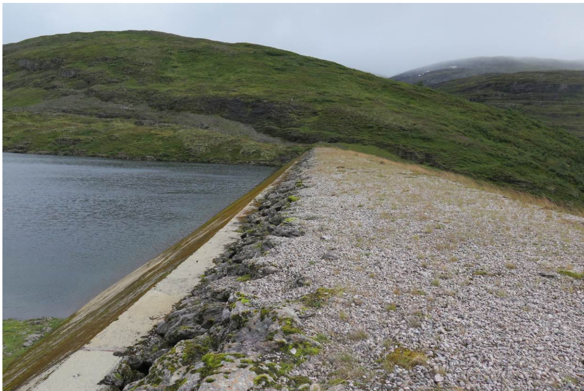
Figur 2 Damanlegg i sørenden av Vassøyane.

Verneområdestyret og RU hadde ingen vidare oppfølging etter orienteringa.