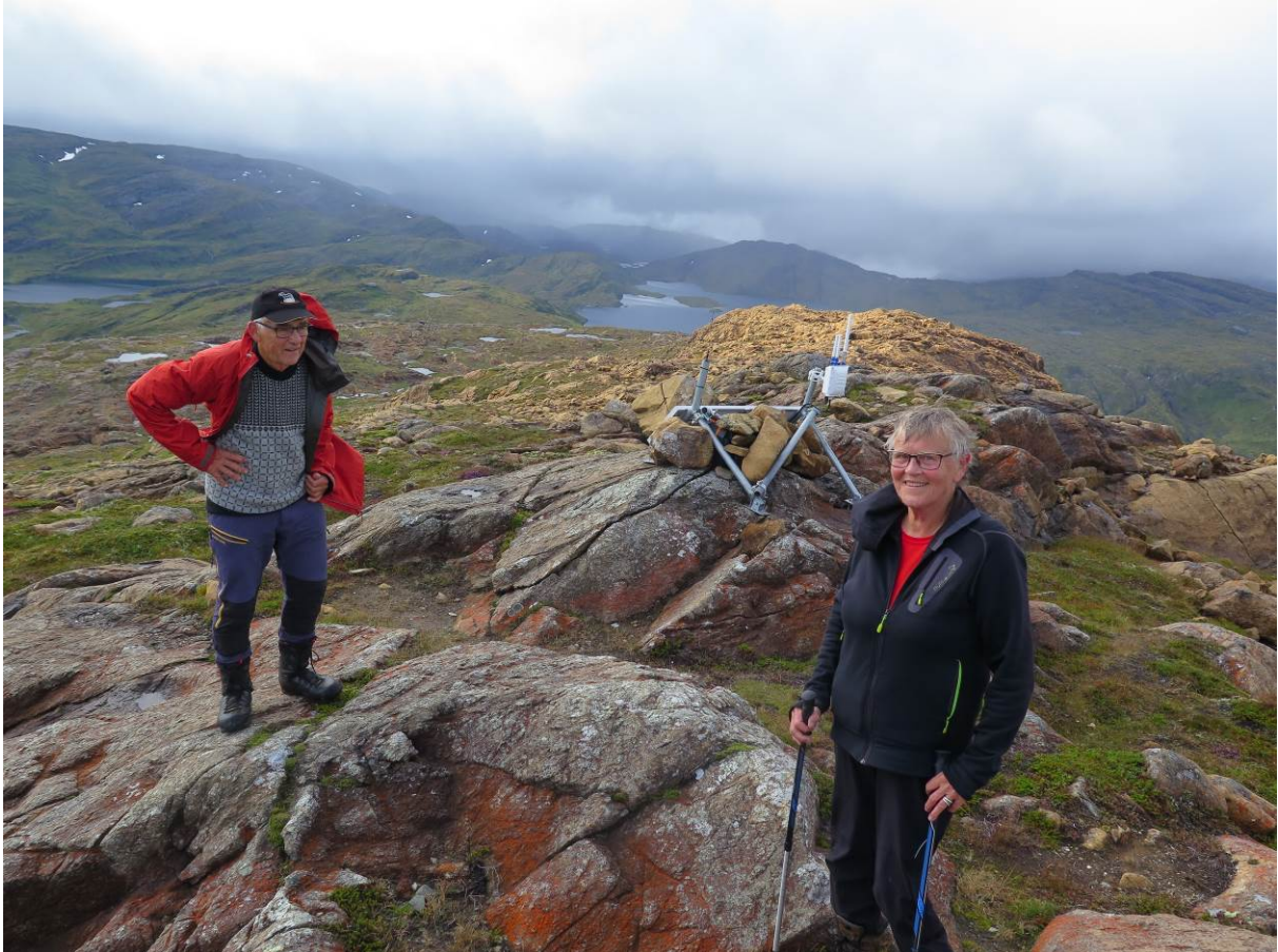
Figur 4 Toppen av Raudberget med antenneanlegget.

Ved varden på toppen av Raudberget har Vestland bjøllelag sett opp ei antenne for å få dekning for elektroniske bjøller på sauer som beitar i området. Anlegget er godt synleg når ein står på toppen, men er ikkje synleg på lang avstand. RU meiner tiltaket ikkje har stor verknad på landskapet. Det er eit godt tiltak for å få fleire beitedyr i Stølsheimen. Beitedyr er eit av dei viktigaste tiltaka for å ta vare på kulturlandskapet i Stølsheimen.