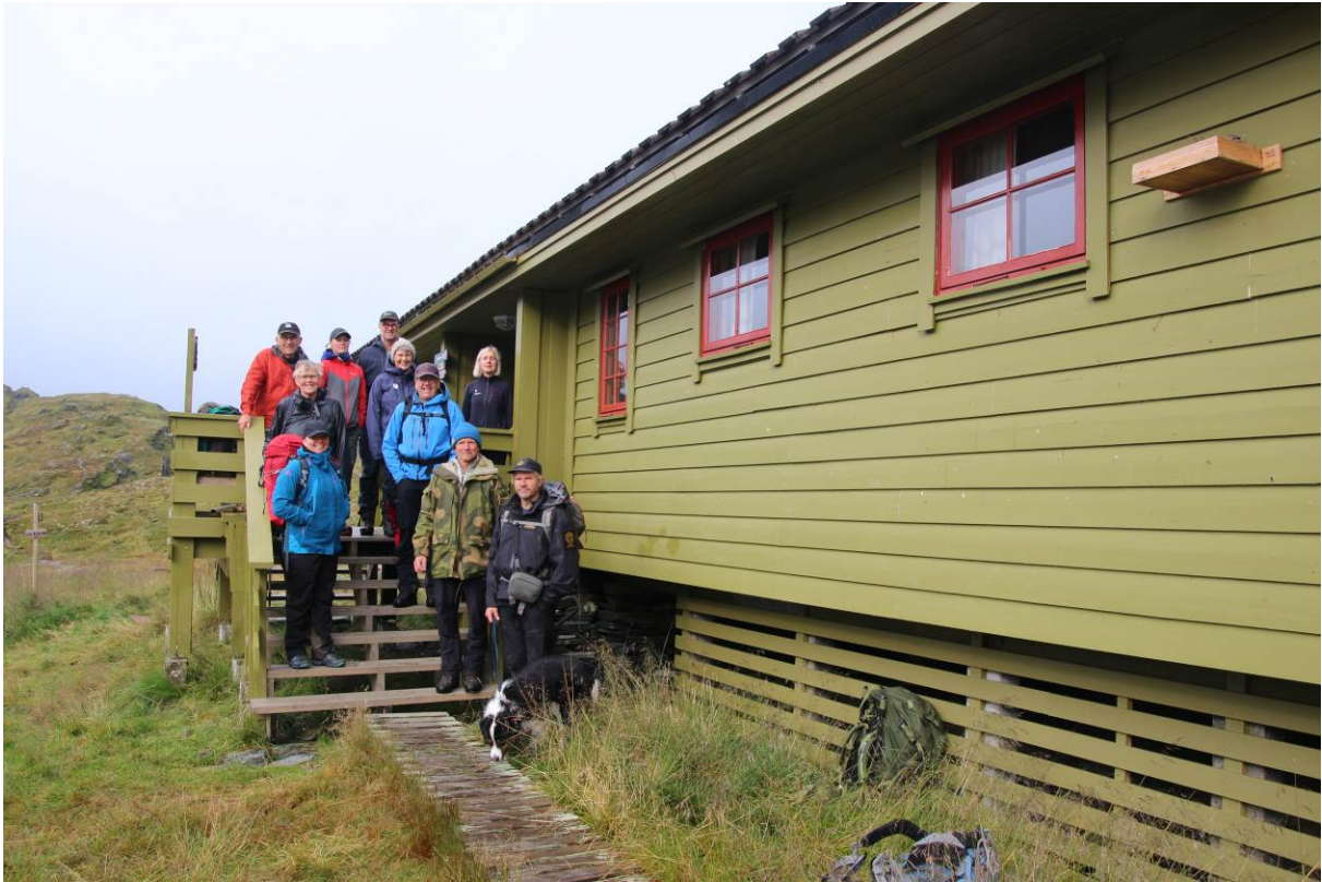
Figur 1 Møtedeltakarar utfor turisthytta på Selhamar.