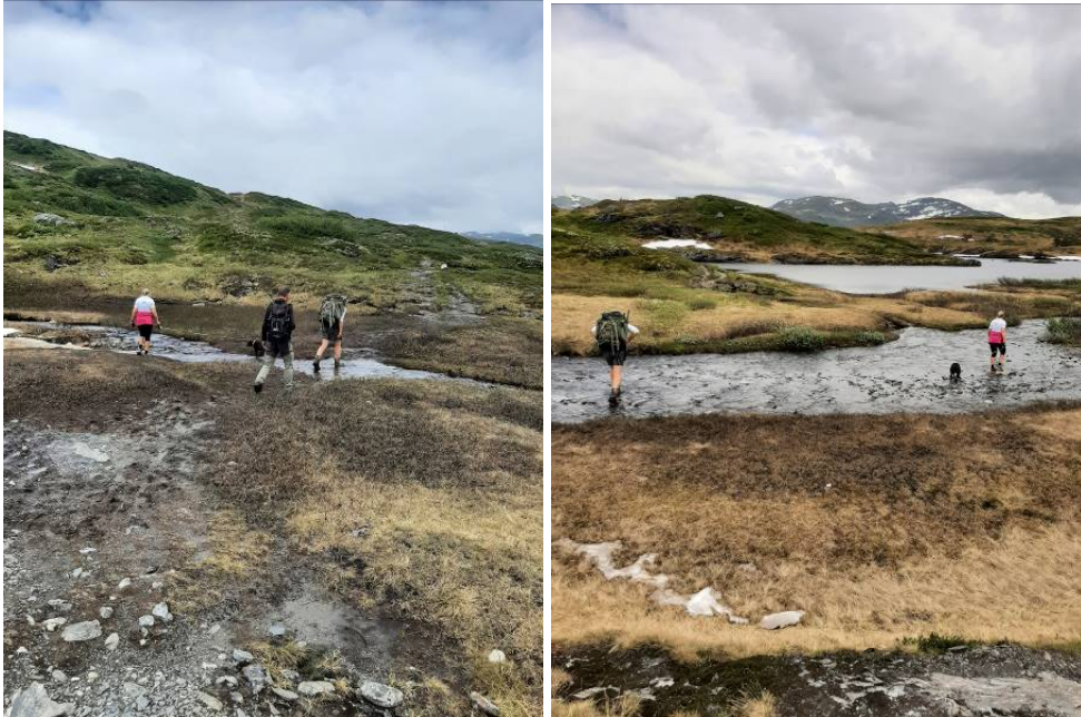
Bilete av området ved Lars-Olavatnet som treng steinleggjing.