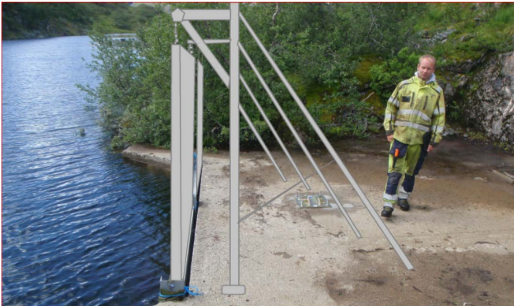
Figur 9 Illustrasjonen viser lukebukken sett fra siden. Høyden på lukebukken er ca. 3 meter.

Løftebukken er ca. 3 meter høy og 5 meter brei. Både løftebukken og lukebladene vil bli malt i grønn eller grå farge som Eviny benytter på installasjoner i terrenget..... Grønn eller grå farge demper synsinntrykket av installasjonen sommertid. På ettervinteren når det er skiferdsel i området, vil løftebukken vanligvis være delvis nedsnødd. Rundt baksiden av inntaket ligger terrenget høyere og dels dekket med busker og annen vegetasjon. Dette hindrer at løftebukken bli stående i «silhuett» mot himmelen og den vil være lite synlig på avstand».