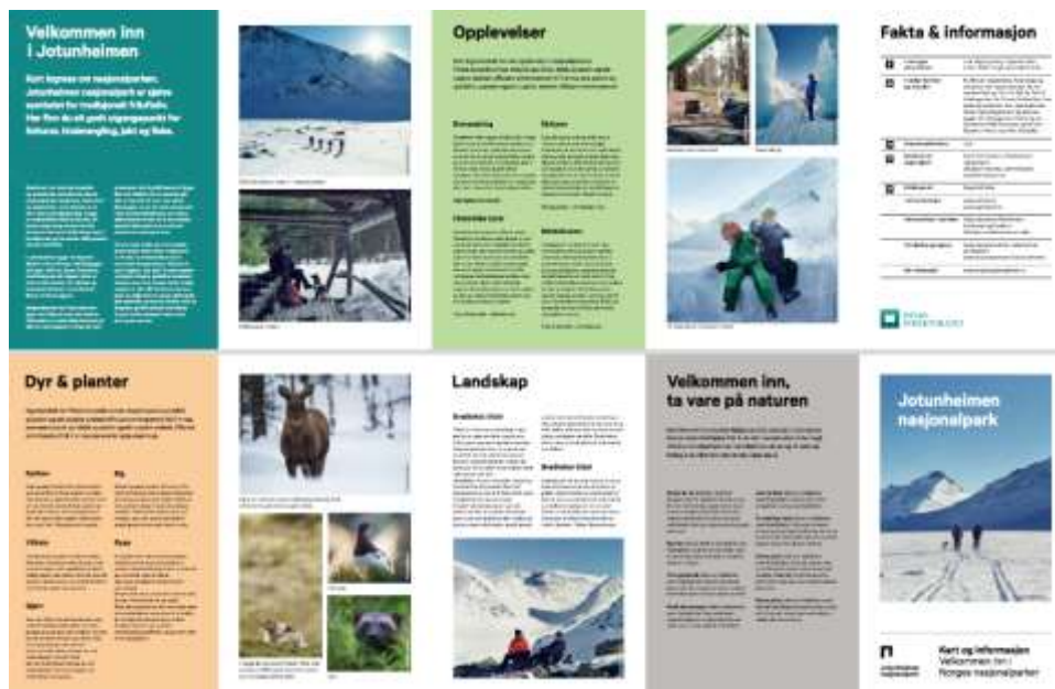
Figur 1: Eksempelbrosjyre frå Jotunheimen. På baksida vil det vere eit stort kart.