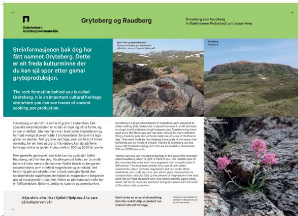
Figur 6: Kulturminneskiltet ved Gryteberg