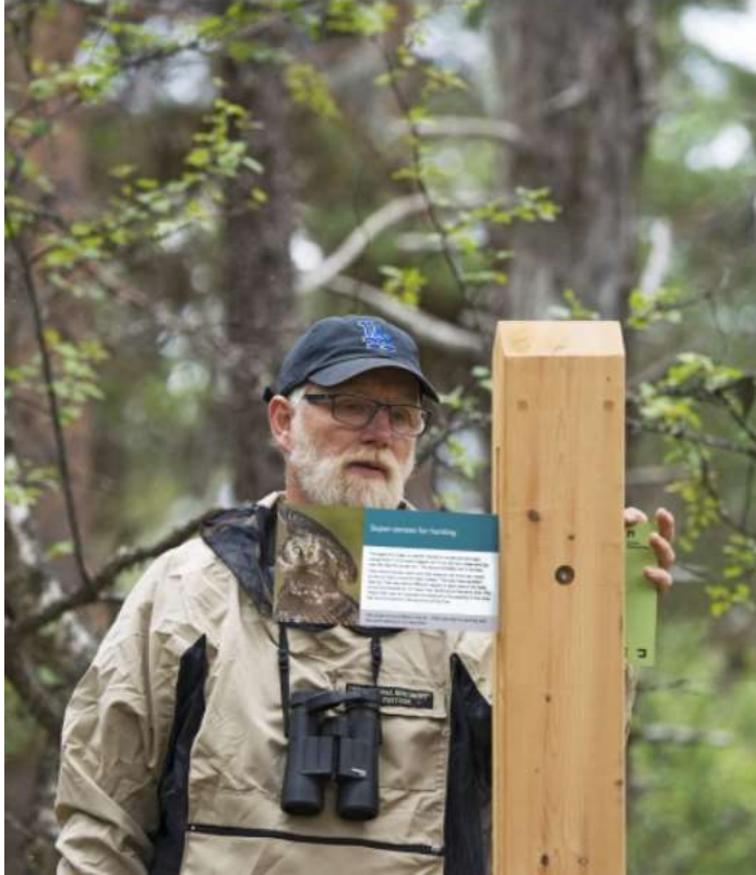
Figur 5: Eksempel på natursti.