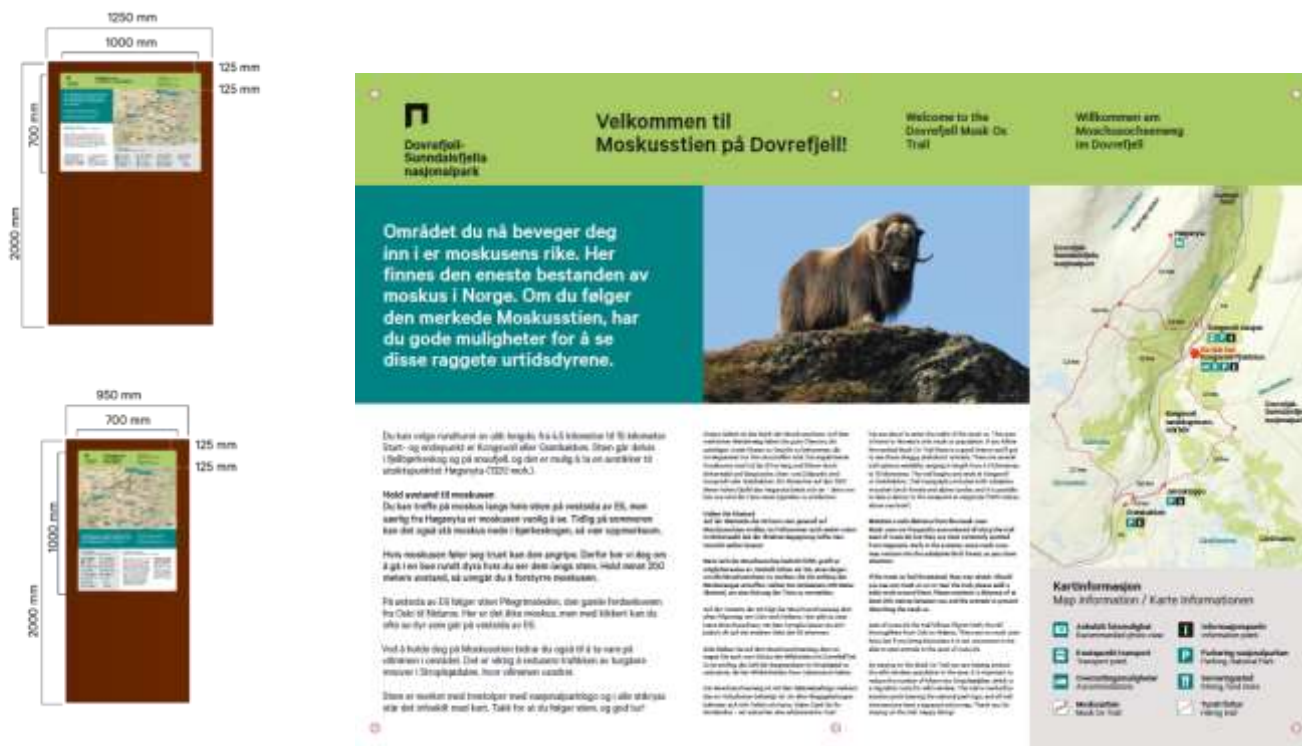
Figur 4: Utforming av stående og liggande tavler i cortenstål. Eksempel på startpunkt-tavle frå Dove.