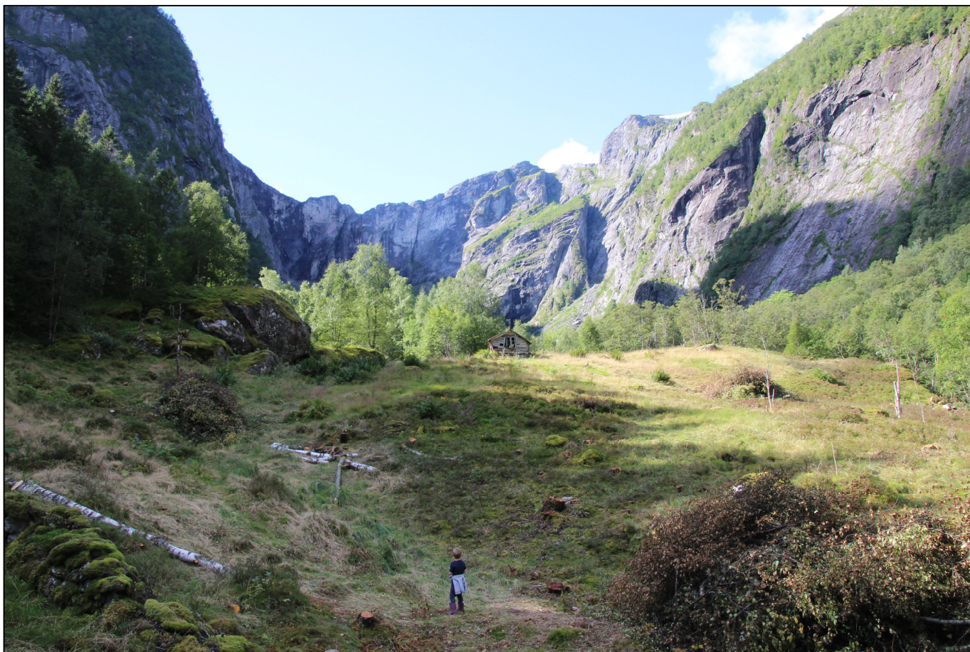
Botnadalen, restaurering av vegetasjonen kring selbøen 2020