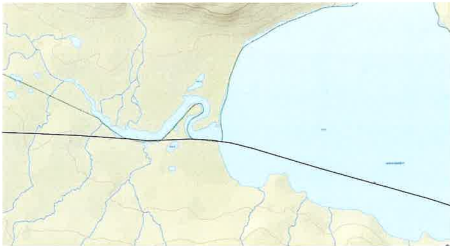
Figur 1: Snøskuterløyen ved Leavnašjávri som går langs nasjonalparkgrensen ved munningen.

Langs nordlige vannkant av Leavnašjávri vil det være behov for skilting, samt ved elvetilløpet hvor skuterløypa også går ved nasjonalparkgrensen (se figur 1). Her bør det skiltes og at det fremgår av forskrift at 300 m regelen ikke gjelder på den ene siden av løypen, for å unngå ulovlig kjøring i nasjonalparken.