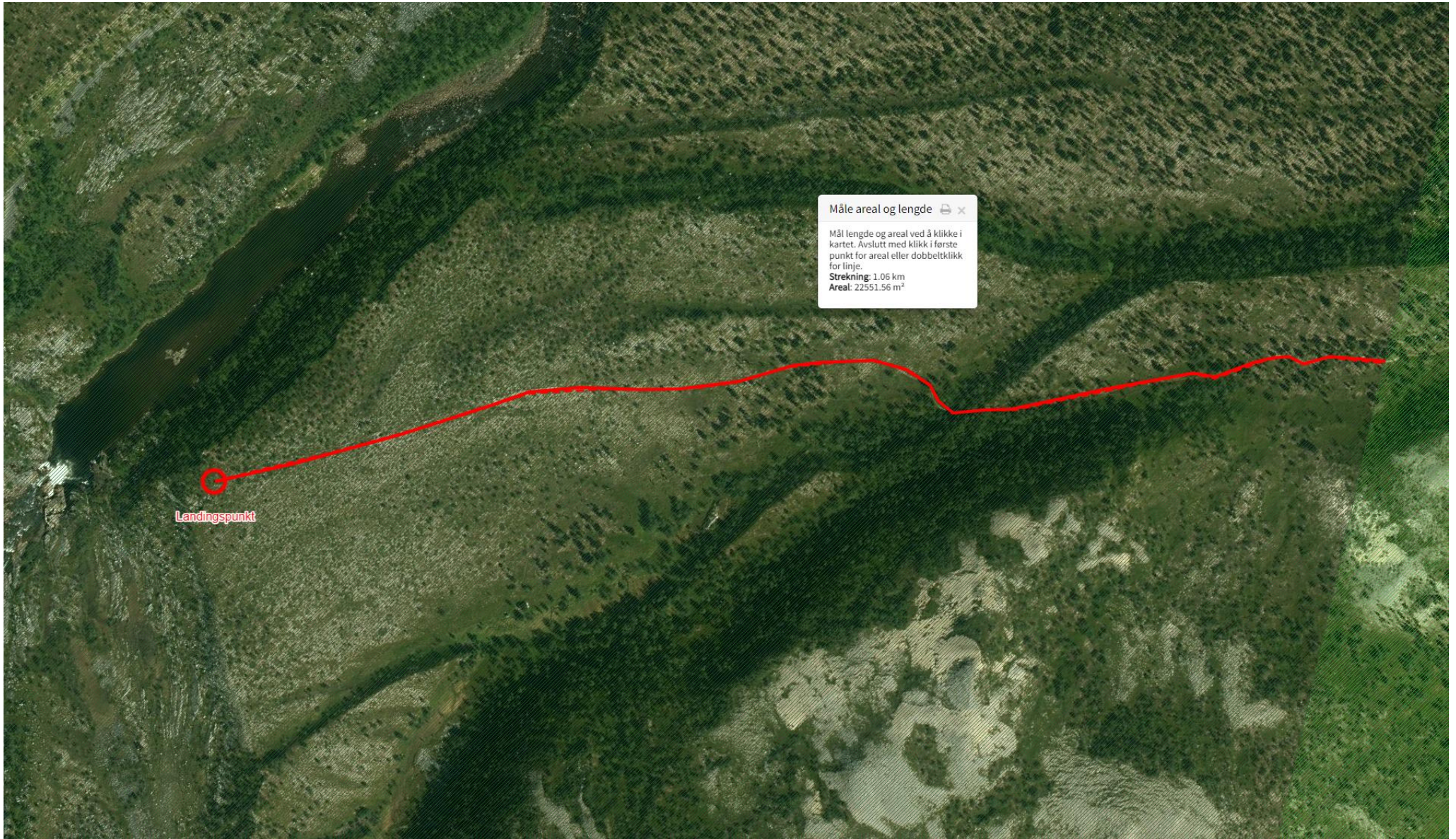
Kart over traseen i Stabbursdalen nasjonalpark. Lengden på traseen i nasjonalparken er ca. 1 km fra landskapsvernområdet til landingspunkt for helikopteret.