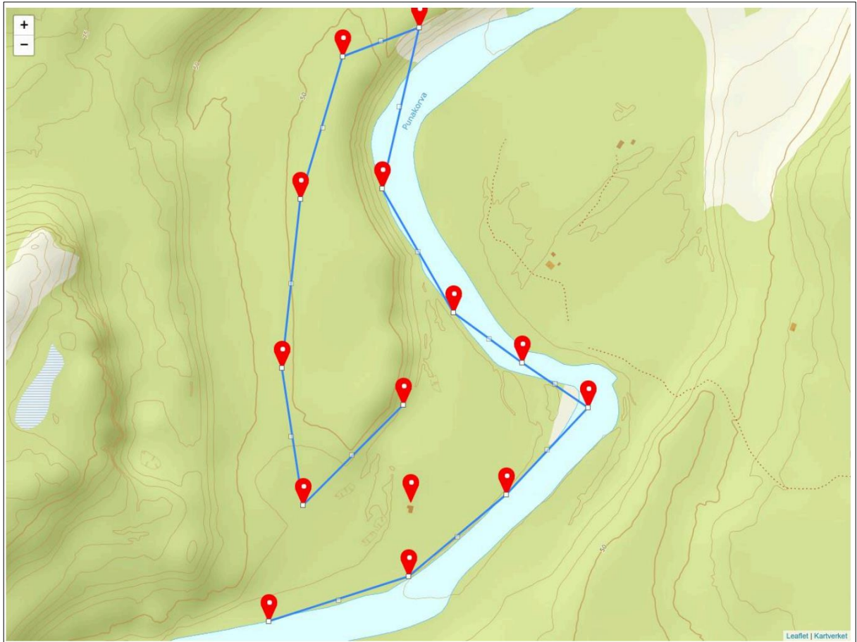
Kart vedlagt søknaden om bruk av drone som beskriver hvor det er ønsket å fly dronen.