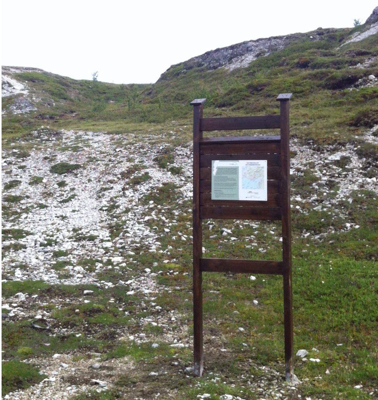
Bilde av omsøkt utforming av informasjonstavle.