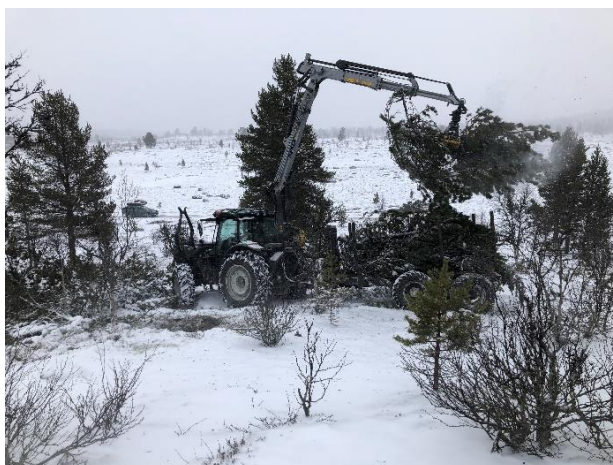
Bilde 9 & 10: Uttak av buskfuru ved Skånborket.