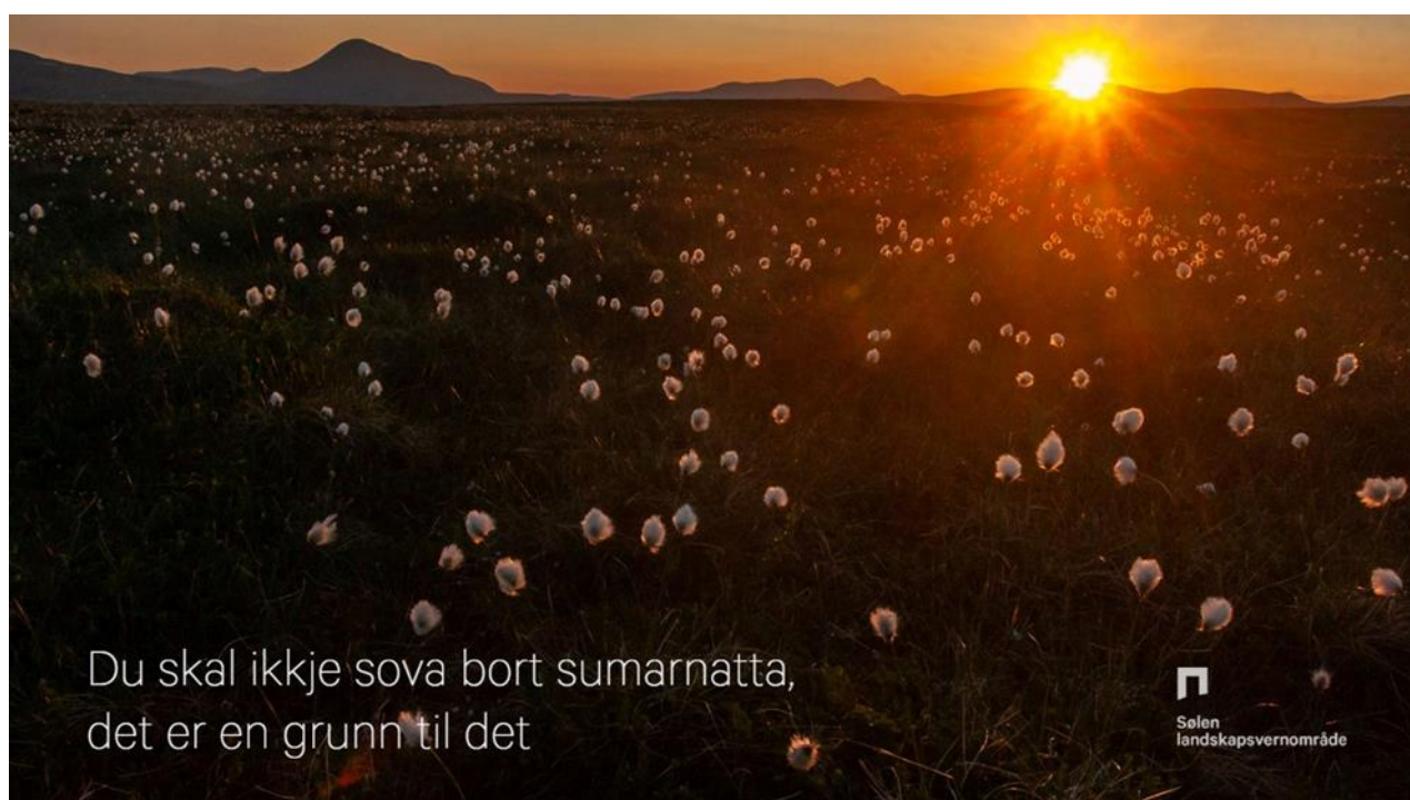
Bilde 5: Bildespill

I anledning Sølen landskapsvernområde 10 år har Tur og Natur laget 7 flotte bildespill som tar oss gjennom de ulike årstidene innenfor landskapsvernområdet. Bildespillene ble lagt ut på facebook siden og instagram i 2022.