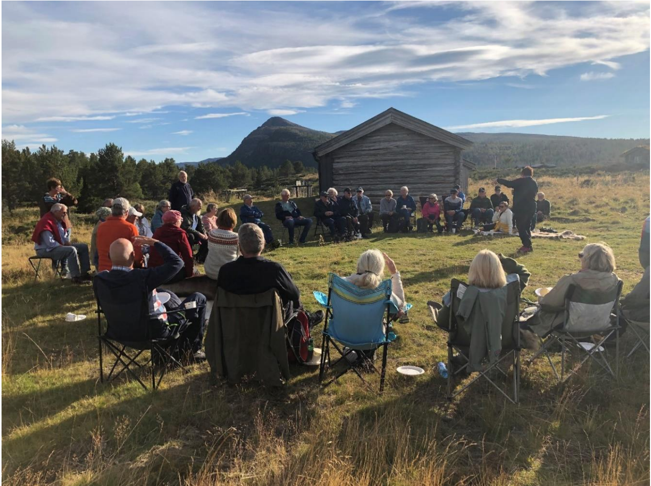
Bilde 12: Fin kveld i Misterdalen med tema byggeskikk.

Forollhogna NP og LVO til Rendalen og Sølen landskapsvernområde. I tillegg er det satt av midler på fond i kommunen til dette arbeidet.