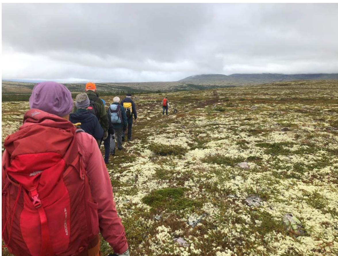
Bilde 8: Tematur – vandring på gamle ferdselsveier – kløvveien til Fiskevollen.

Verneområdestyret arrangerte i september en fin tur langs den gamle kløvveien fra Stonga og inn til Nysetra under Veidekulturfestivalen.