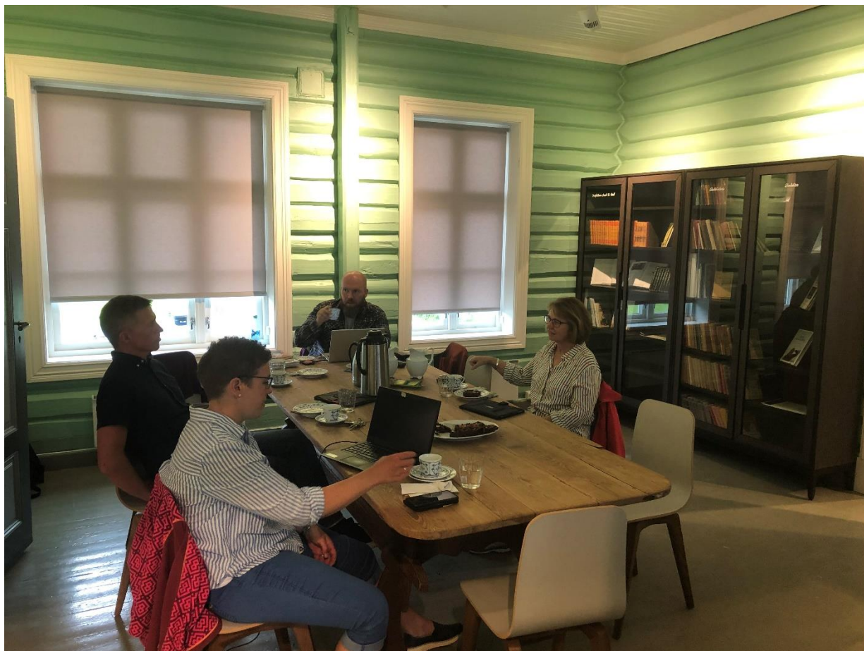
Bilde 1: Møte i verneområdestyret på Rendalstunet i juni.

Sølen verneområdestyre har i 2022 hatt 2 fysiske styremøter og 6 elektroniske møter. Styremøtet i juni ble avholdt på Rendalstunet med flott foredrag om hubro av Utmarkskonsulent Øyvind Fredriksson.