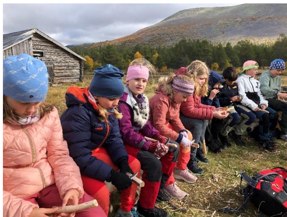
Bilde 6 & 7: Skoleprosjekt i Mistedalen