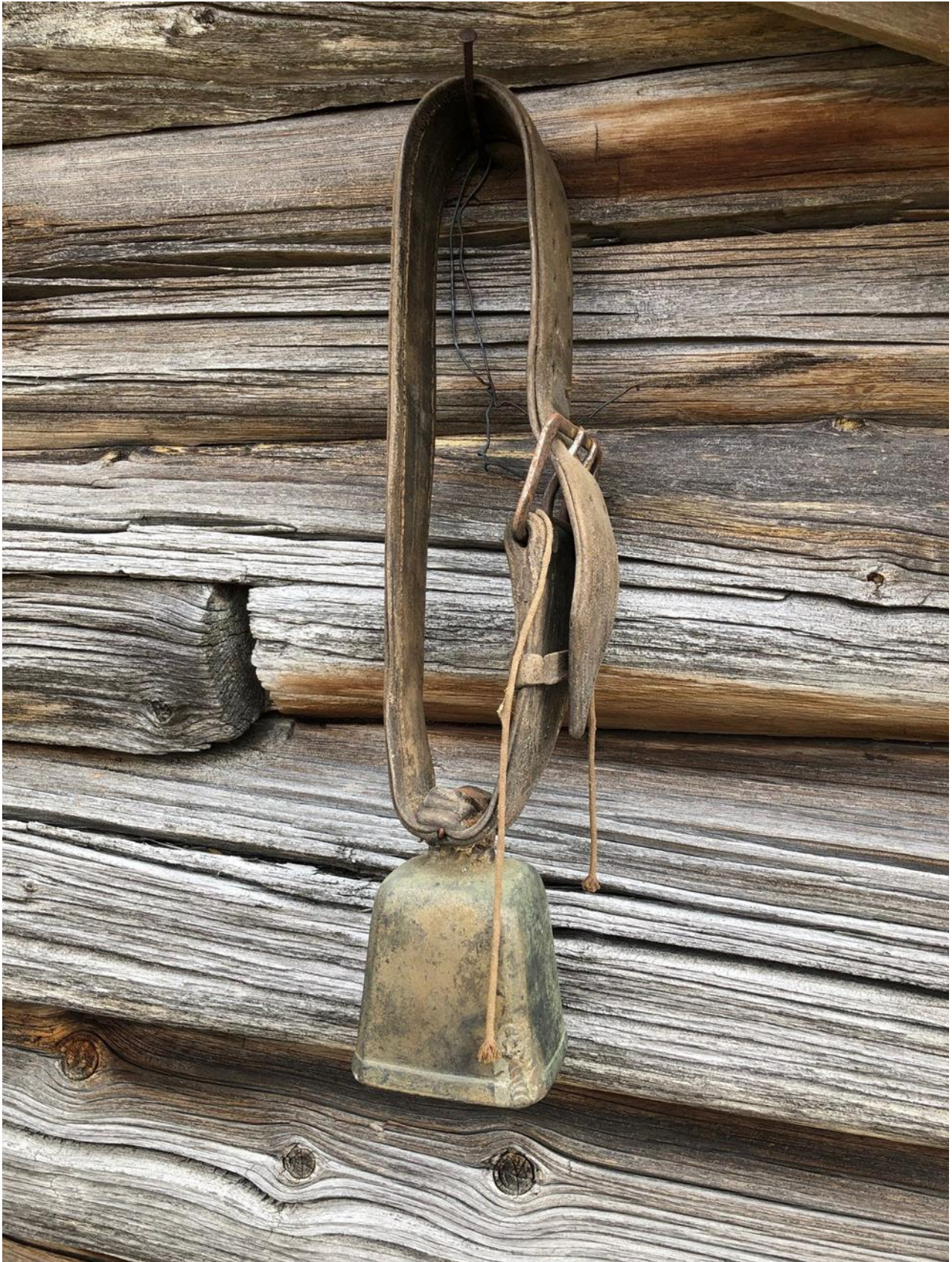
Bilde 4: Kubjelle