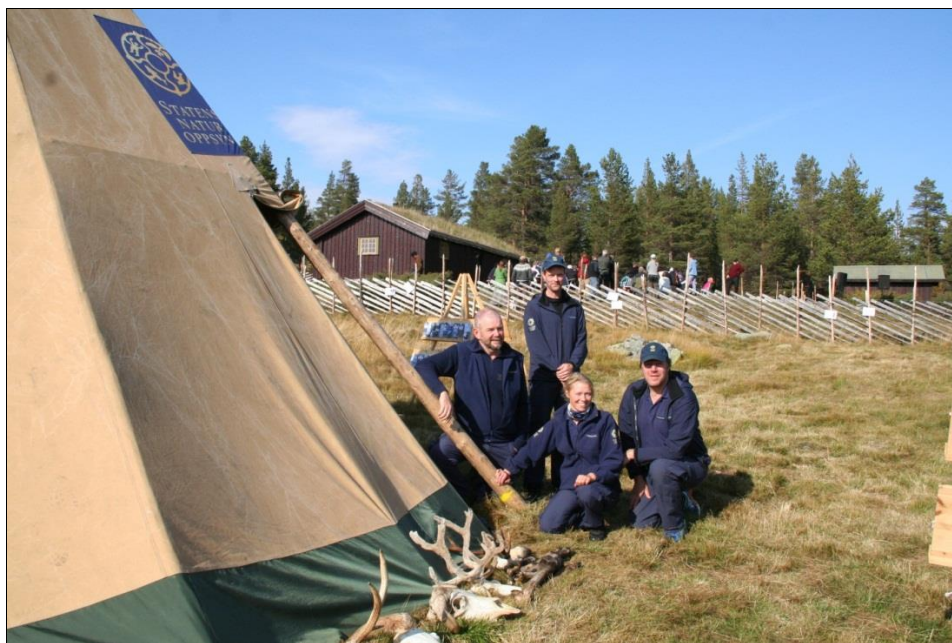
Bilde 2: Statens naturoppsyn og naturveiledere fra Hjerkinns bidro på åpningen av Sølen landskapsvernområde 20. september og gjennomførte et flott opplegg for ungdomskoleelevene 19. september.

Naturoppsynet har bistått med oppsetting av informasjonstavler ved 10 innfallsporter. Ellers utfører SNO rene oppsynsoppgaver, informasjonsarbeid og gjennomfører tiltak for verneområdestyret. SNO utarbeider egne årsrapporter der dette gjennomgås.