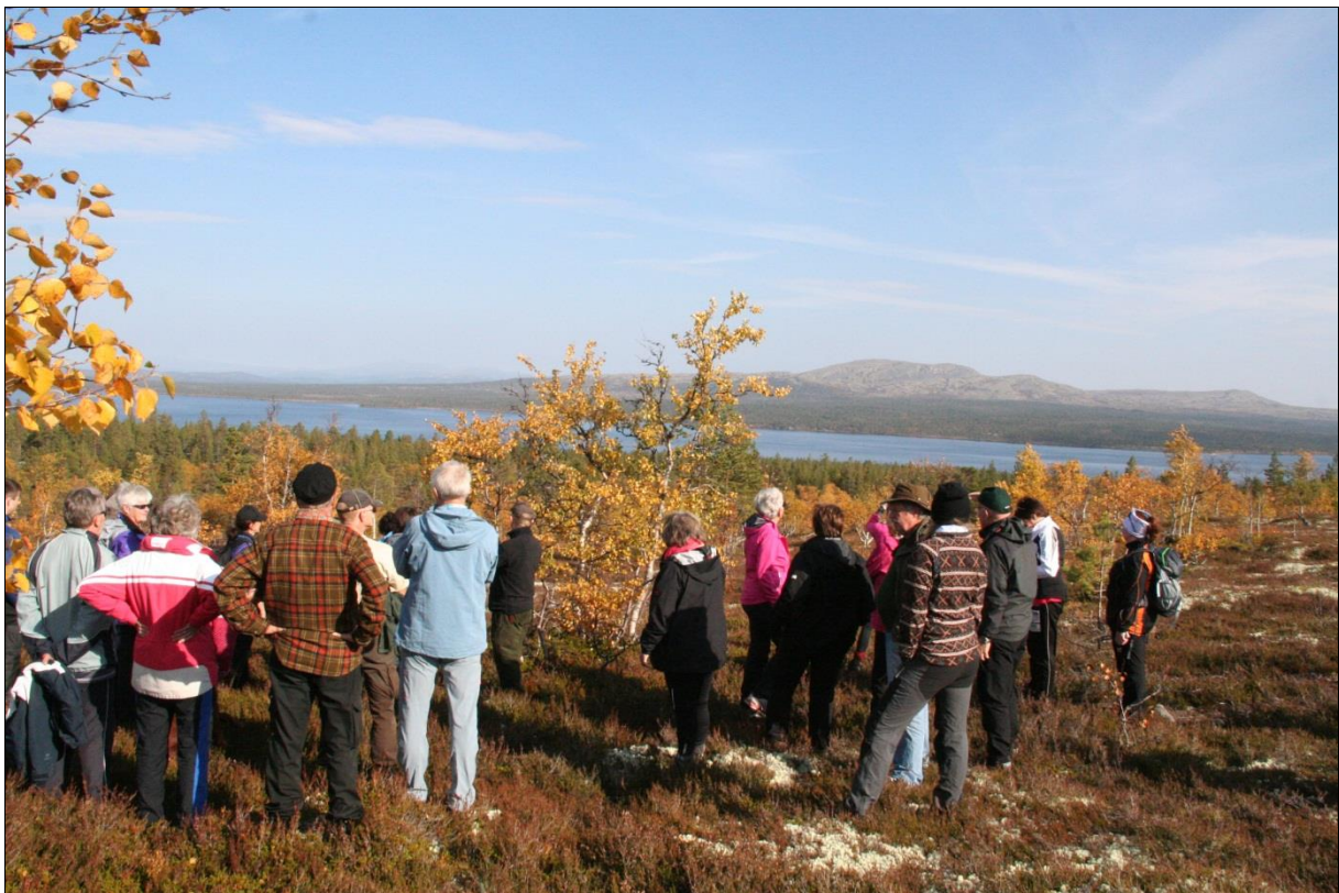
Bilde 10: Guidet tur med tema landskap, geologi og kulturminner innenfor Sølen landskapsvernområde

Forvaltningsplanen blir sendt til Miljødirektoratet for godkjenning i 2015. Ellers vil det bli satt fokus på arbeidet med besøksstrategi, besøksforvaltning og merkevarestrategi framover. Det vil være viktig å få kartlagt mer om bruken/brukerne av området. Hjemmeside for Sølen verneområdestyre er også under utarbeidelse.