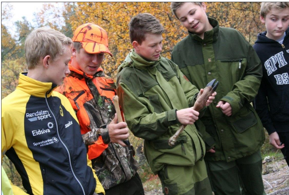
Bilde 4: Nysgjerrige ungdomsskoleelever på skoledagen ved Åkrådalen 19. september 2014.

Fredag 19. september holdt SNO og naturveilederne på Hjerkin en skoledag i landskapsvernoprådet for ungdomskola i Rendalen. Basen for dagen var Åkrådalen seter med tema kulturminner, rein og verneopråder. 56 elever og 5 lærere deltok på dagen. Verneoprådeforvalter deltok på dagen og verneoprådestyret bidro med lunsj og buss-skyss av elevene. At barn og unge får et eierforhold til landskapsvernoprådet og at de blir glad i å være ute, er det beste vernet vi kan gi naturen. Å få mulighet til å bruke landskapsvernoprådet som formidlingsarena i skolen og på fritida er noe verneoprådestyret mener er viktig. Derfor prioriterer forvalter og SNO å stille på samarbeidsprosjekter med skolene.