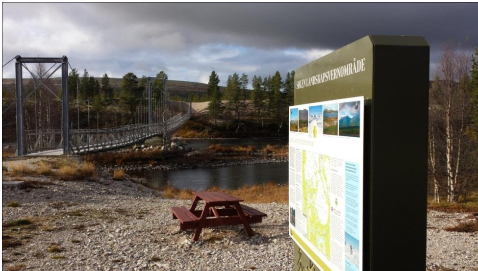
Bilde 3: Informasjonstavle for Sølén landskapsvernopråde ved innfallsporten fra Sølénstua i Engerdal kommune