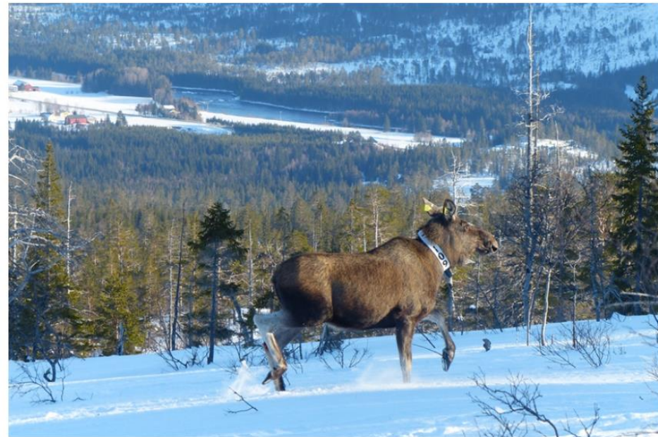
Elg i Trøndelag er merket, blant annet for å se hvilke områder elgen bruker. Data viser at den beveget seg over lengre avstander da landet var stengt ned som følge av COVID-19.

Menneskelig atferd endret seg til dels dramatisk under nedstengninger i de første ukene og månedene av den globale COVID-19-pandemien. Det resulterte i at pattedyr på land endret atferd, viser en studie publisert i Science av et stort internasjonalt forskerteam. Flere NINA-forskere har bidratt med data fra prosjektene sine om hjortevilt og bjørn.