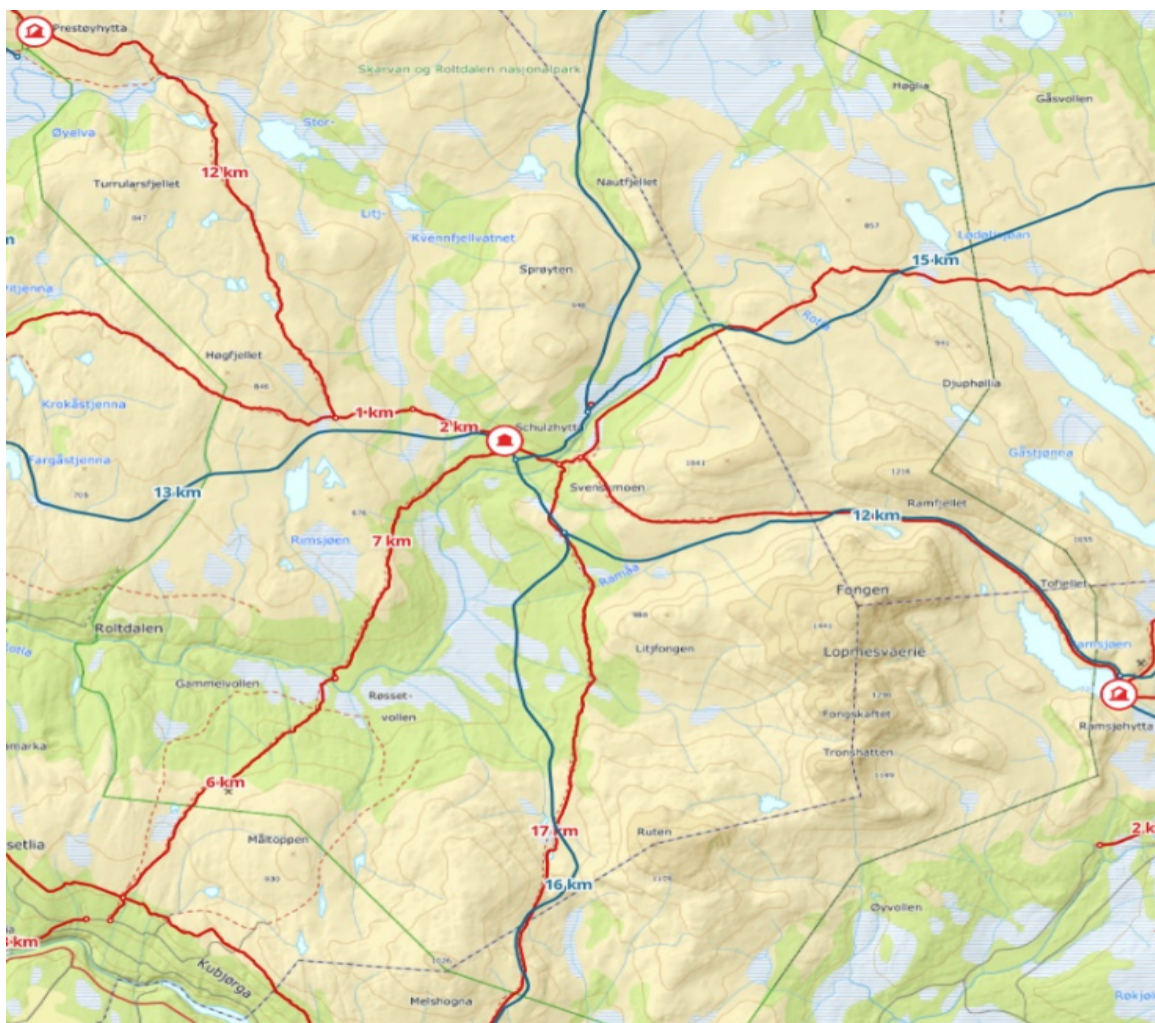
Schulzhytta med sommer- og vinterruter inntegna. Kart fra UT.no