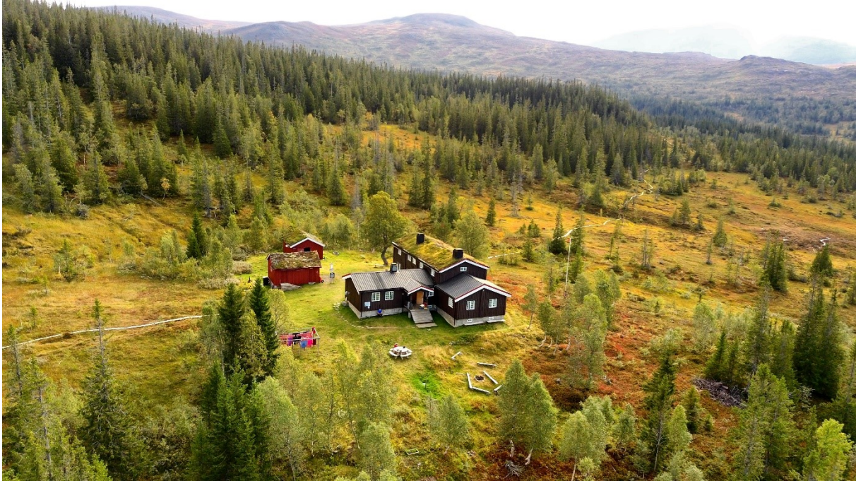
Schulzhytta 6. september 2019. Bildet er tatt mot sørøst.

Den lille hytta med det store hjertet. Schulzhytta er ei av Norges minste, betjente turisthytter. Den er også Norges nordligste betjente hytte. Den ligger sentralt til i den vestligste delen av Sylan, midt i hjertet av Skarvan og Roltdalen Nasjonalpark. Dette er det siste større naturområdet i Trøndelag uten kraftutbygging og veiforbindelse. Hytta ble bygd i 1948. Anlegget består av tre hus: hovedhytta med peisestue og hundrom, uthuset med gass og ved, og den gamle stallen med utedo og lager. Det er gjort få endringer på hytta i de 75 årene den har stått der.