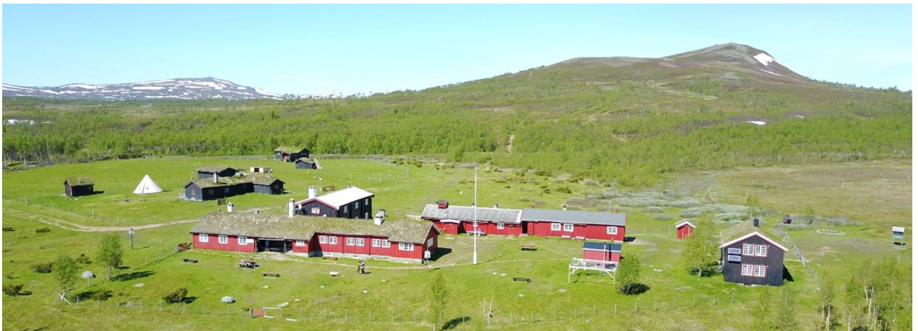
Storerikvollen 30. juni 2017. Bildet er tatt mot vest. Blåkkåkleppen bak til høyre.

Betjent turisthytte som har hatt eget bygg på Storerikvollen sia 1896. Anlegget består av hovedhytta fra 1923 (med påbygg i alle retninger fra 1937,1954, 2001), Uthuset med aggregatrom, hundrom, Størhus, urinal, lager og vedbu, Utedo med 4 båser fra 1985, ei lita gassbu og Sjølholdet fra 1996.