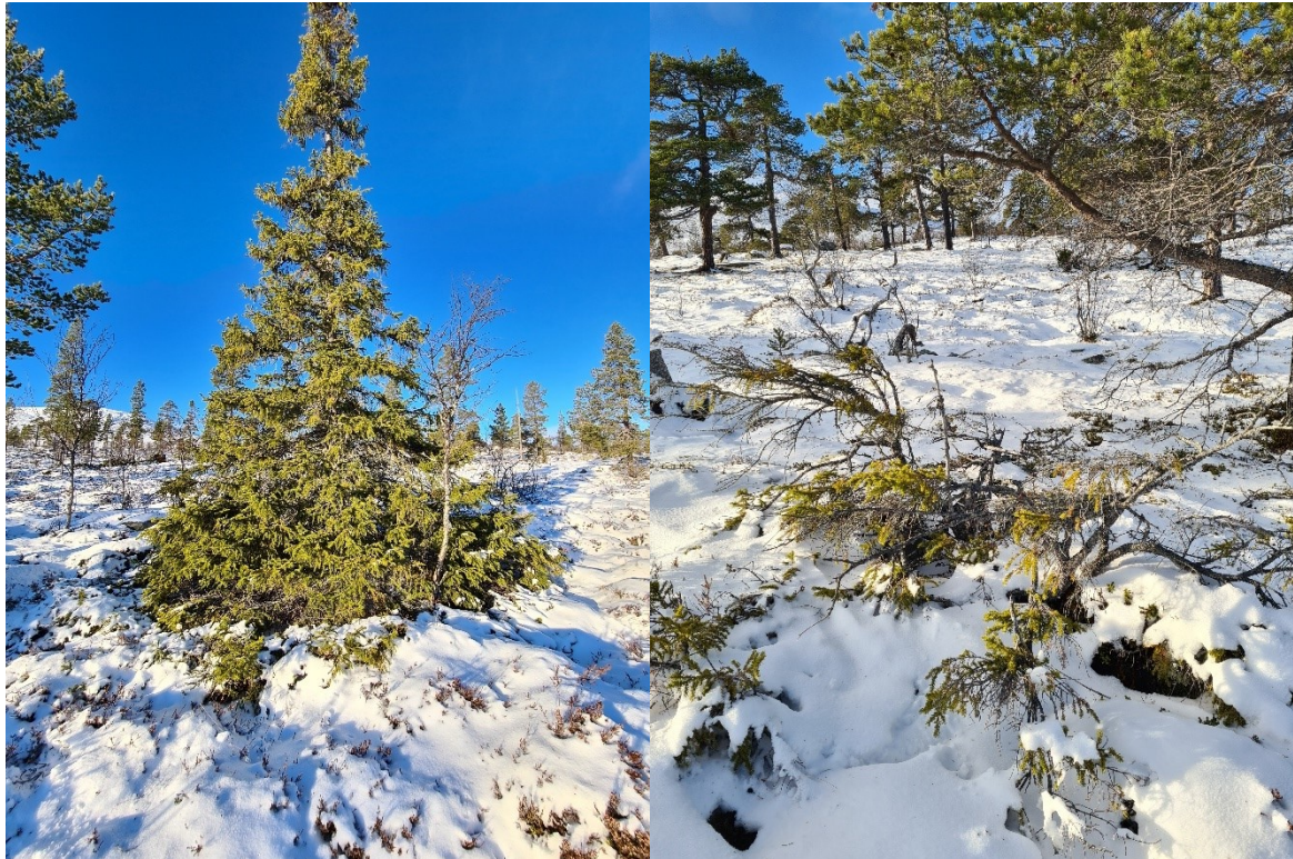
Senkegruppene av gran fortoner seg veldig ulikt. Her fra Kvennlia naturreservat vest for Femundsmarka.

Gran kan forynge seg ved at den slår nye røtter ut fra greinene, den kloner altså seg selv. Det er på den måten disse granene har overlevd så lenge. Under varmere perioder har granen stått mer oppreist som et tre. Når det har vært kaldere har granen levd som en busk som kan overleve vinteren i beskyttelse under snøen. Stammene vi ser i dag er som regel noen hundre år gamle. Det er derfor interessant å ta prøver fra rotsystemet og gamle trebiter under bakken.