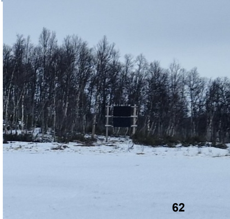
Utsnitt av bilde med solcellestativet