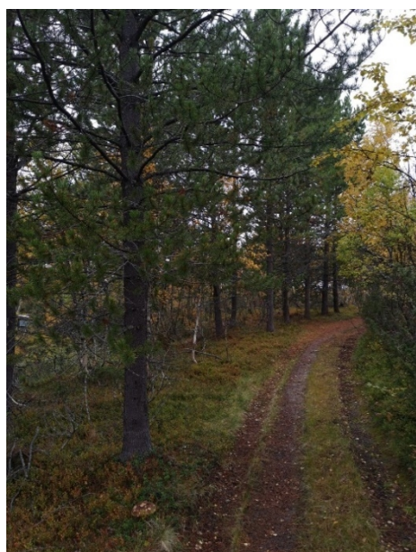
Figur 3. Vrifuru

Tiltaket gjennomføres av grunneier og ser ut til å bli gjennomført innen gitt tidsfrist. Det er registrert spredte forekomster av vrifuru også i andre deler av verneområdet. Det er viktig at oppsynet får fullmakt til å fjerne disse.