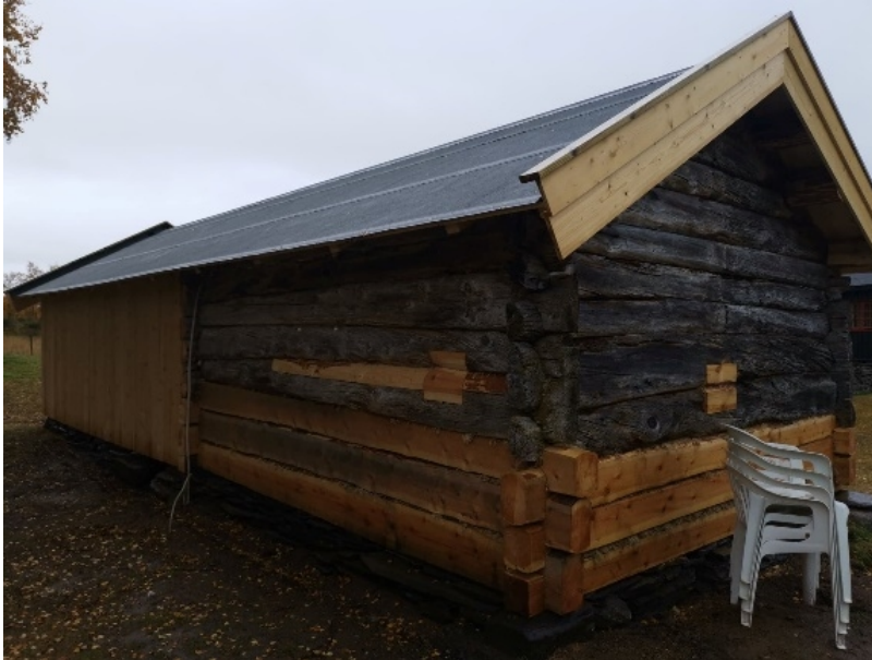
Figur 2. Restaurering av stall

Det er gjennomført kontroll med restaurering av stall på en setervoll. Restaureringen er i henhold til hva det er gitt tillatelse til.