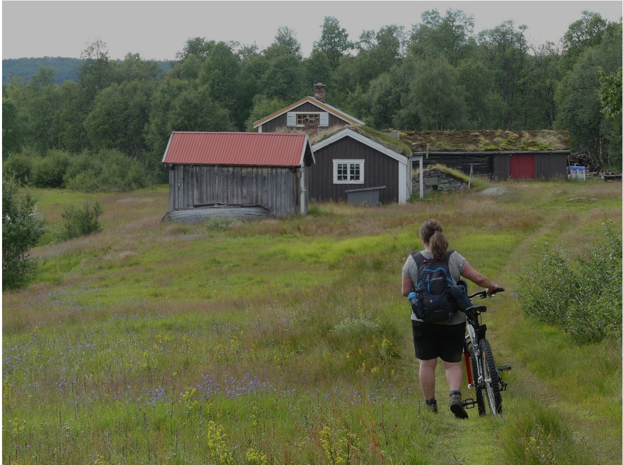
Figur 6. Traseen gjennom Haugavollen