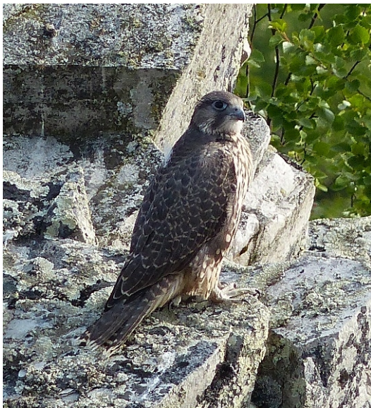
Figur 5. Jaktfalk

Det er ønskelig å videreutvikle et samarbeid på tvers av riksgrensa når det gjelder overvåking av disse artene.