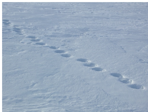
Figur 8. jervespor

Grensefjellene i gamle Sør-Trøndelag har i mange år vært et viktig leveområde for jerv. I 2020 ble det registrert en antatt yngling innenfor verneområdet.