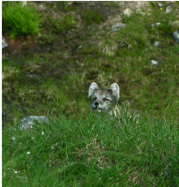
Figur 7. Fjellrev

Det ble ikke registrert yngling av fjellrev i Skardsfjella på norsk side i 2020 men en yngling ble registrert ikke langt fra grensa på svensk side.