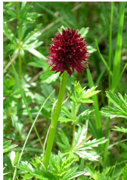
Figur 6. Svartkurle