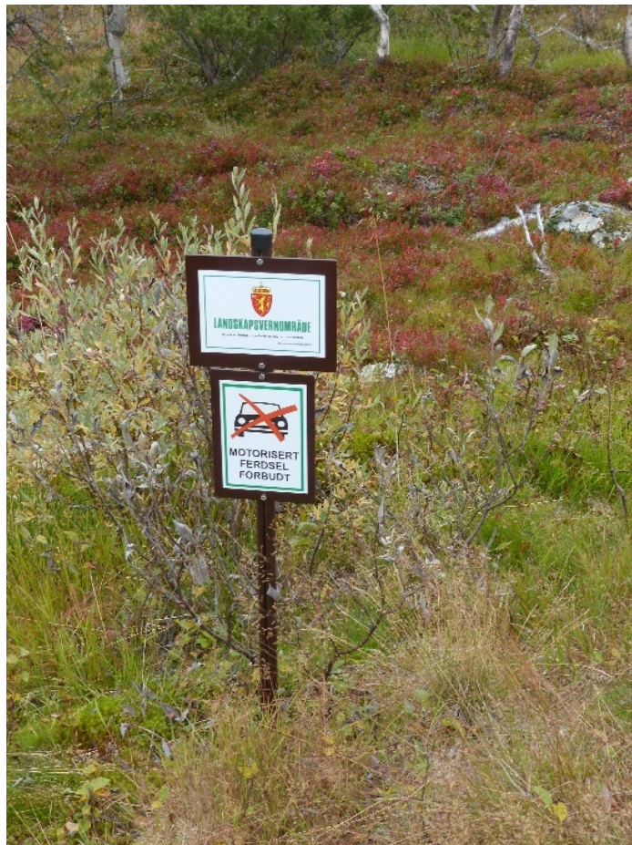
Figur 1. Løveskilt med underskilt.

Det er ikke gjennomført egne motorferdselkontroller i Skardsfjella og Hyllingsdalen, men oppsynsturer legges i stor grad til områder med erfaringsmessig mye ferdsel. Også i 2020 har det vært fokus på Hyllingsdalsveien. Ingen er anmeldt for ulovlig motorferdsel i 2020.