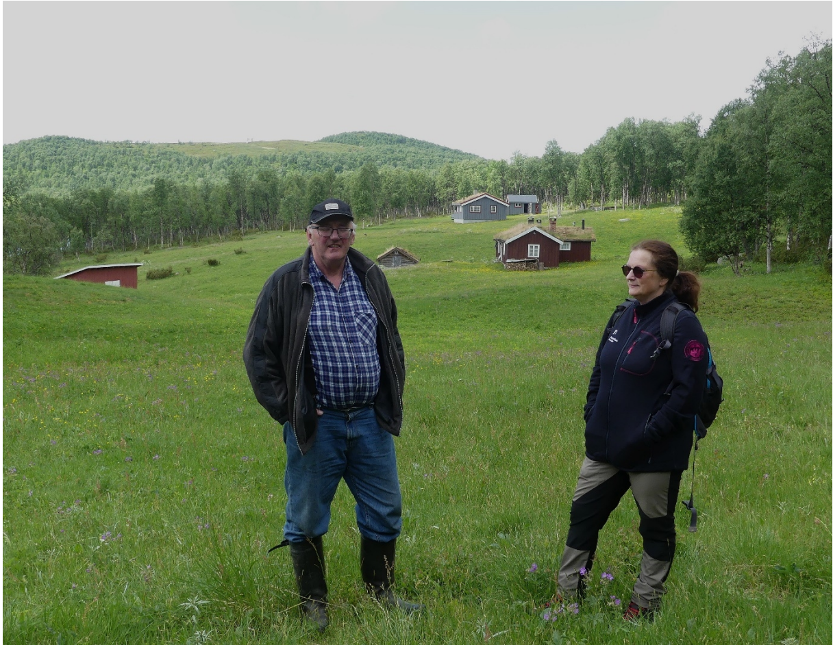
Figur 5. Grunneier og forvalter på Rihåvollen