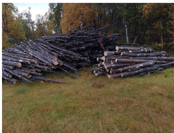
Figur 4 Tømmerlunne med vrifuru