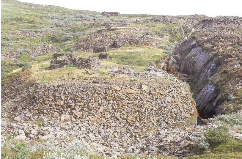
Fig 6: Kvernsteinsbrudd, kalt Bruntytdalen, i Høgfjellet, et verneverdig kulturminne.