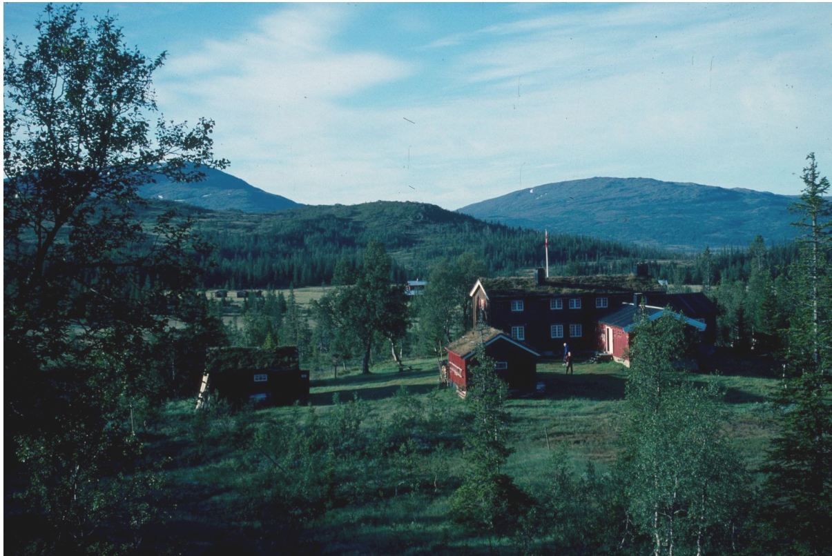
Fig 11: Trondhjem Turistforening sin hytte "Schulzhytta" i Roltdalen.

besøkende) og sammen med TTs rutenett i Sylene med Storerikvollen og Nedalshytta. Ramsjøhytta i Tydal har også kommet til i TTs rutenett. På Schulzhytta er det årlig omkring 600 overnattinger og hytta er betjent i deler av året.