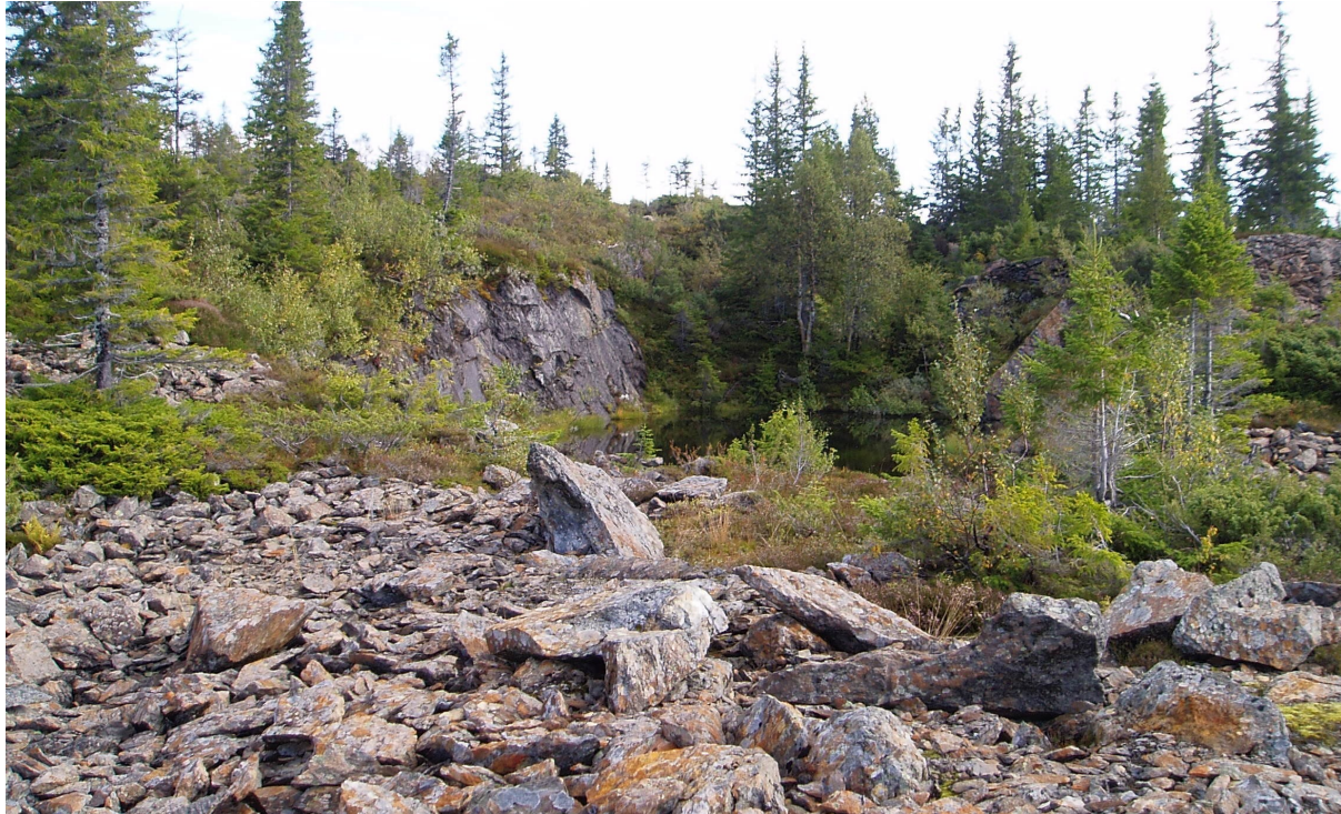
Fig 4: Gammelt kvernsteinsbrudd fra Nerfjellet.