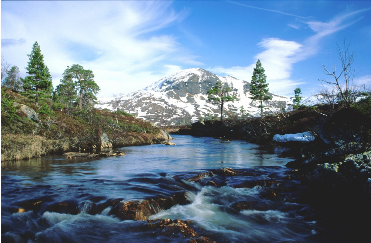
Fig 2: Elva Skrøya med Vålåkleppen i bakgrunnen, Meråker kommune, er et eksempel på område som er definert som et villmarkspreget område.