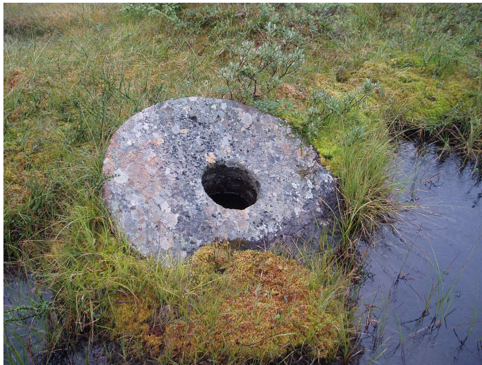
Fig 14: Kvernstein fra bruddene ved Nerfelet.

Områdene i og i nær tilknytning til nasjonalparken er i varierende grad preget av jordbruk opp gjennom tidene. Beiting og setring har satt sitt preg på landskapet, noe som har skapt en stor diversitet i floraen, spesielt gjelder dette Roltdalen.