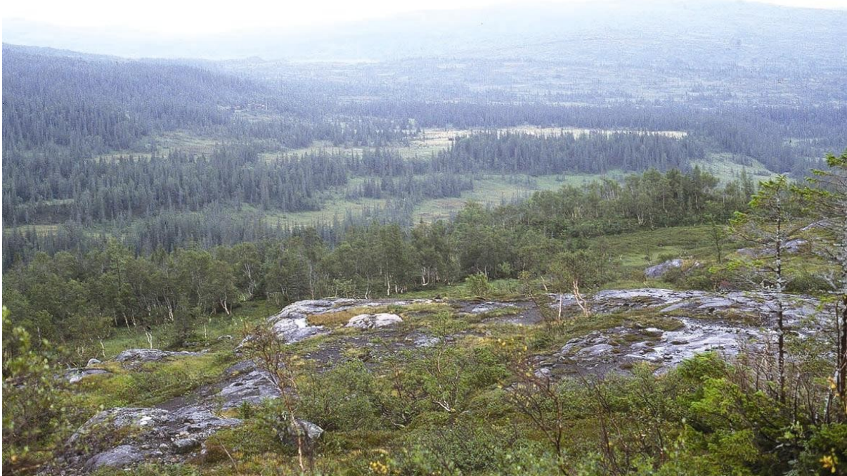
Fig. 12: Skog er en dominerende naturtype i selve Roltdalen, her fra Stormoen-området. Det ligger derfor til rette for å kunne tillate noe uttak av ved.

Reindriftas uttak av virke reguleres av reindriftslovens § 13 om brensel og trevirke, såfremt denne ikke kommer i konflikt med retningslinjene i forvaltningsplanen. Reindrifta har ikke gjerder i området pr. i dag, men de peker på at et slikt behov kan oppstå. Verneområdet, herunder forskriften, må ses i et langt tidsperspektiv og det er relevant å tilpasse forskriften i forhold til sannsynlige tiltak. Retningslinjene som er trekt opp vil også gjelde for et eventuelt fremtidig behov fra reindriftnæringen. Reindriftsutøverne i Skarvan og Roltdalen nasjonalpark har få anlegg innenfor parken og derfor beskjedne behov for trevirke. Det bør ikke brukes store selvtørrende bartrær, tørrgadder (furu), store vindfall etc.