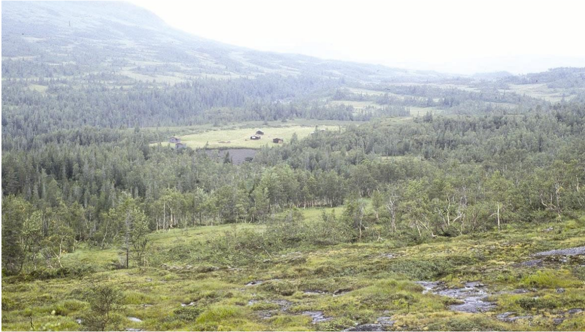
Fig 5: Svenskmoen, setervoll nordøst i Selbu kommune.