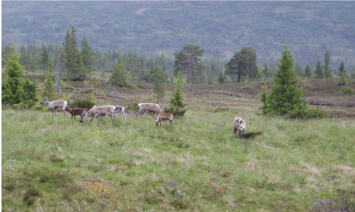
Fig 7: Beitende rein på Kallarvollen.