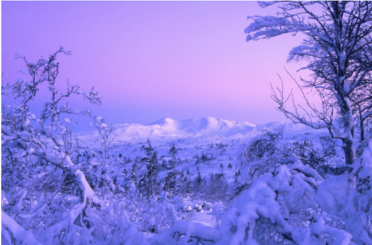
Fig 3: Skarvan i romjulslys.