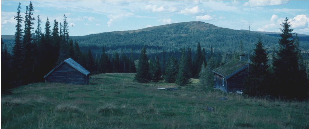
Fig 8: Liavollen i Roltdalen, Selbu kommune.

På arealene i Tydal kommune har det i de senere år ikke beitet husdyr, men områdene har tidligere vært utnyttet til utmarksbeite. I Stjørdal kommune var det fra gammelt av flere setervoller rundt Sonvatna. Setervollene er i dag ikke i bruk til seterdrift. Tidligere var det store flokker bufe som beitet i traktene. Myrslått var utbredt. I dag beiter det på det meste ca. 500 sau på beite i området. I Meråker kommune ligger en rekke setervoller i Torsbjørkdalen. Seterdriften i dag er knyttet til sauehold. Om lag ti bruk har sau på beite i tilknytning til planområdet, til sammen ca 300 sau og 400 lam.