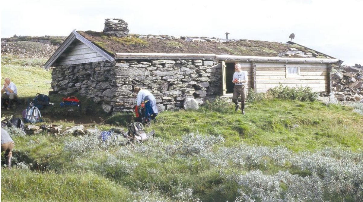
Fig 13: Rekonstruert hus slik det var under kvernsteinsdrifta, Høgfjellet i Selbu kommune.