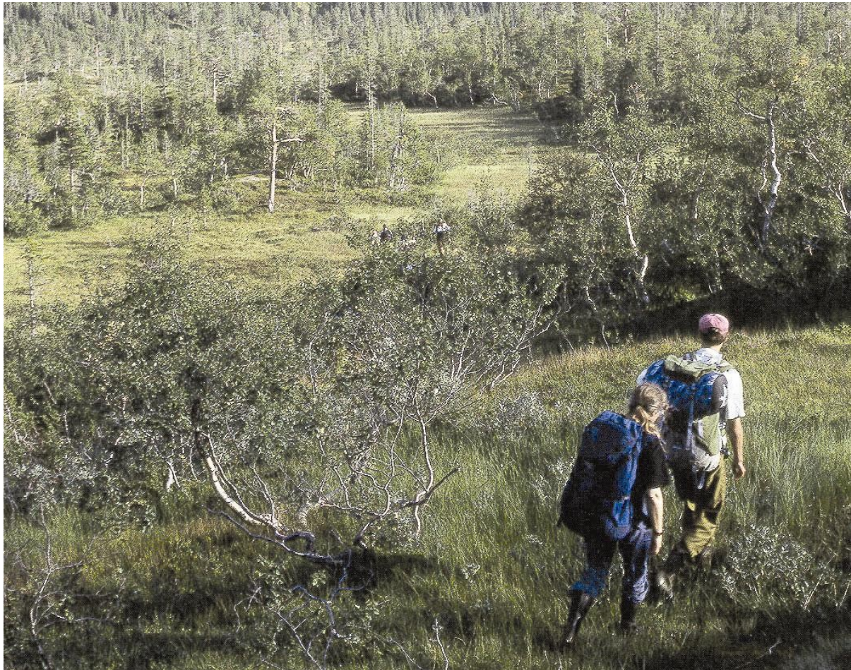
Fig 10: Retten til fri ferdsel i utmark ( Allemannsretten ) har vært og er en viktig forutsetning for den norske friluftslivstradisjonen.

I bestemmelsene heter det at annen organisert og ferdselsformer som kan skade naturmiljøet krever særskilt tillatelse fra forvaltningsmyndigheten, dvs. at det må søkes om slike aktiviteter. Bakgrunnen for dette er at organisasjoner, institusjoner, lag, etablissementer m.m. i stadig større omfang utvikler organiserte turer og større arrangementer der naturopplevelse og friluftsliv står sentralt. I motsetning til det tradisjonelle friluftslivet innebærer dette et større antall mennesker på samme sted på samme tid. Det kan f. eks. gjelde organiserte fotturer og rideturer, teltleirer, treningsleirer for hundekjøring, mer spenningsbaserte aktiviteter som krever spesiell kunnskap, utstyr og tilrettelegging, som den «vanlige» turvandrer ikke har eller krever.