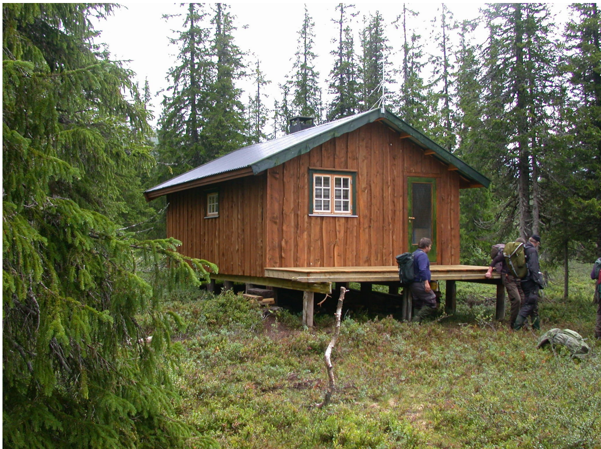
Fig. 9: Tilsynsbu ved Stormoen.

I bestemmelsen heter det at forvaltningsmyndigheten kan gi tillatelse til bruk av luftfartøy i forbindelse med beitedyrleting. Behovet for å lete opp beitedyr fra fly vil trolig dukke opp fra tid til annen. Søknader om bruk av luftfartøy skal være i regi av beitelag/sankelag.