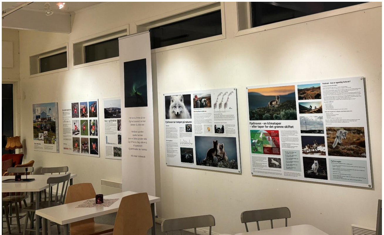
Bilde viser veggen med nye plakater om fjellrev på 705 Senteret.

Vi har også i 2023 hatt utstillinger inne på 705 Senteret. Det er generell informasjon om verneområdene, reindrifta i området og fjellreven. I tillegg har vi i 2023 hatt utstillingen «Natur under press» oppe. På slutten av året fikk vi opp en utvidet utstilling om fjellreven finansiert av midler fra ordningen «Tilskudd til trua arter». Tekstutforming til denne fjellrevutstillingen ble utført av Fjelldriv AS og grafisk design av Studio705.