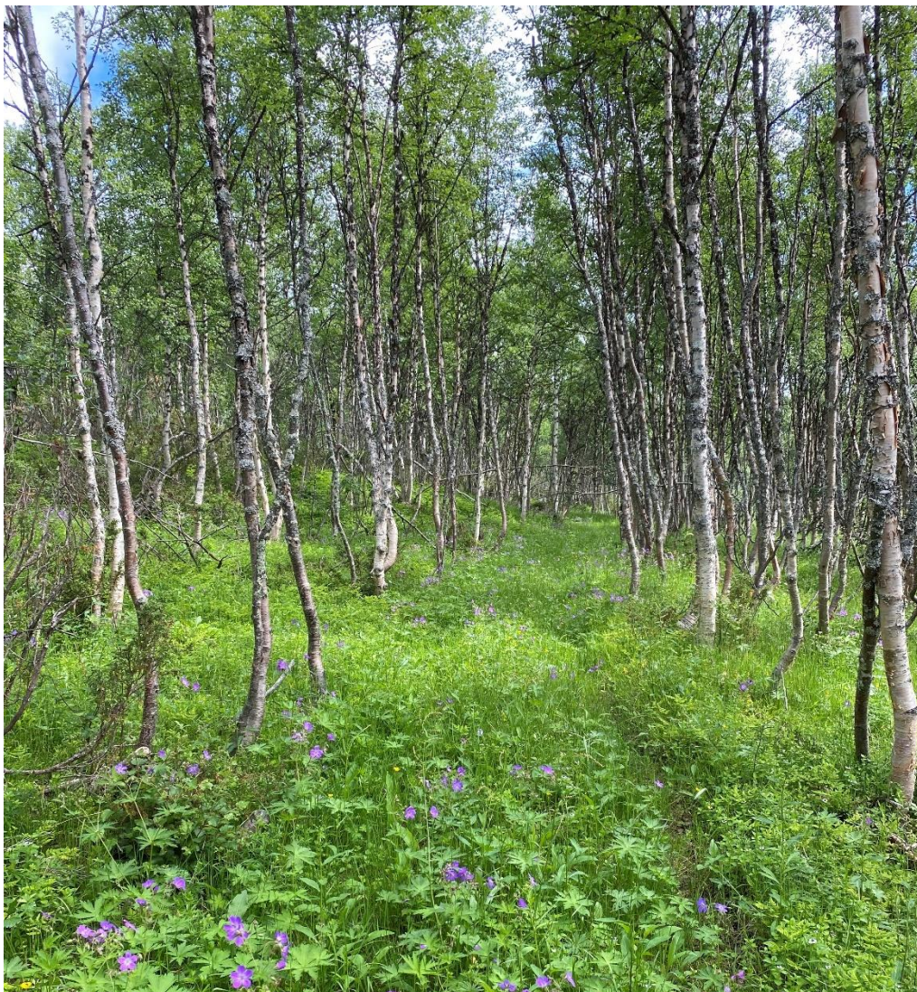
Hyllingsdalsveien – ryddet gammel veitrase forbi Haugavollen.

Verneområdestyret for Skardsfjella og Hyllingsdalen