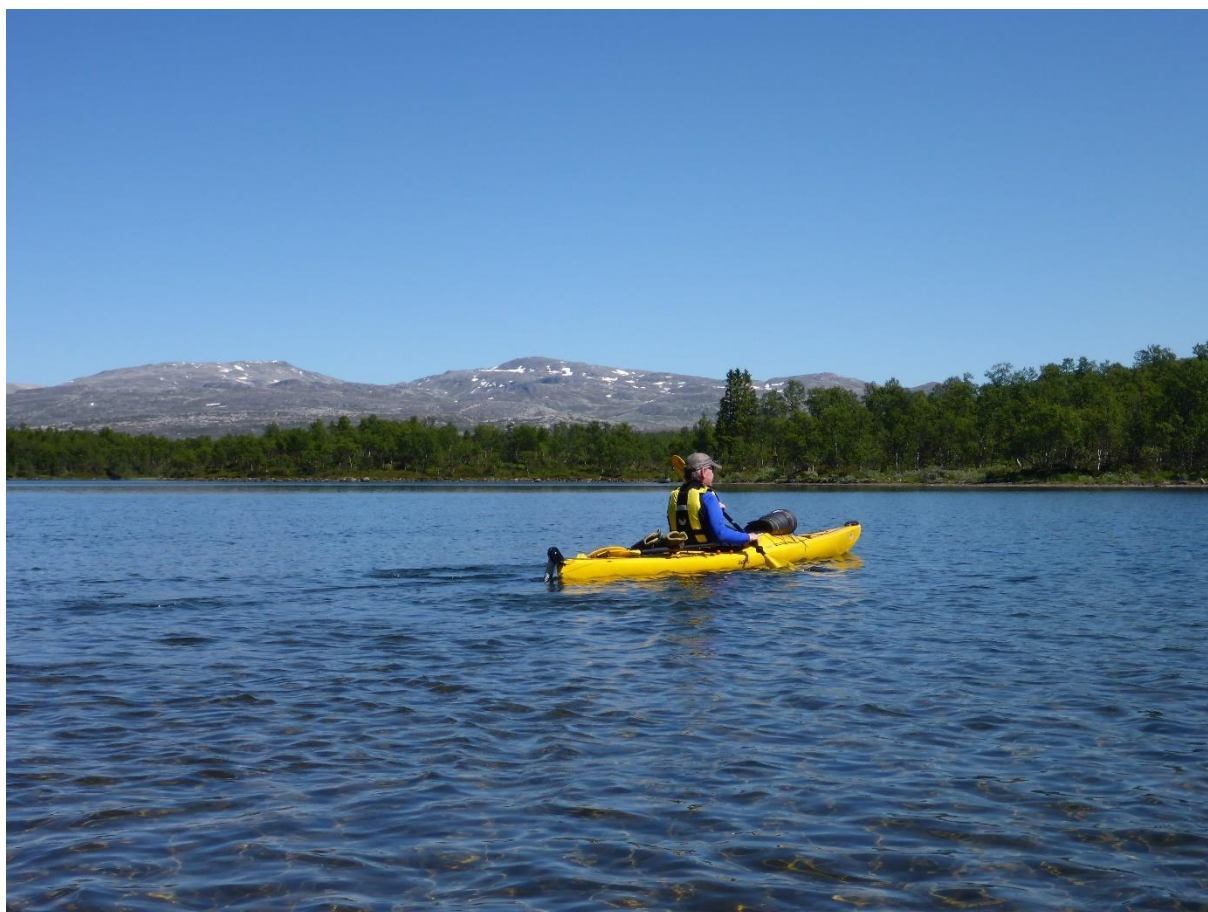
Padling på Storhåen, Rien.

Verneområdestyret for Skardsfjella og Hyllingsdalen