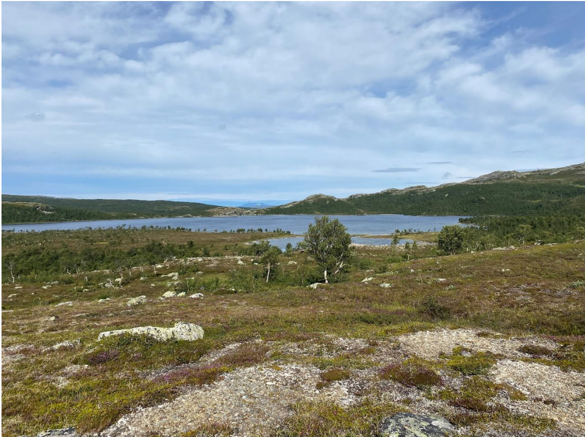
Utsikt mot Møsjøen

Årsrapporten gir en samlet framstilling av verneområdestyrets og nasjonalparkforvalternes arbeid, og gjennomførte tiltak og møter i 2022. Dette er første året det er laget årsrapport for dette styret.