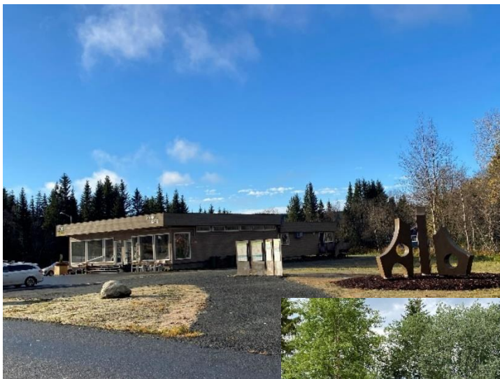
Informasjonspunktet ved 705 Senteret i Tydal

Dette gjelder utvendig informasjon ved forvaltningsknutepunktet på 705 Senteret i Tydal, og er et fellesprosjekt med Nasjonalparkstyret for Skardsfjella og Hyllingsdalen og Sylen. Dette ble så å si ferdigstilt sommeren 2022. Kartplakat for Skardsfjella og Hyllingsdalen vil bli satt opp så snart vi får produsert et kart i tråd med godkjent besøksstrategi. Teksten på temaplakaten for reindrift må justeres noe slik at den også omtaler Riast/Hylling reinbeitedistrikt.