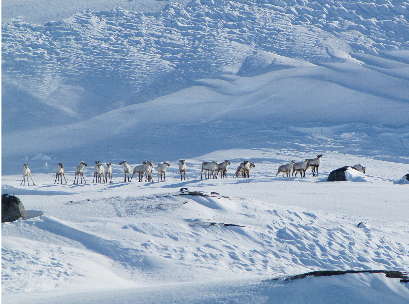
Dyreflokk i vinterlandskap.