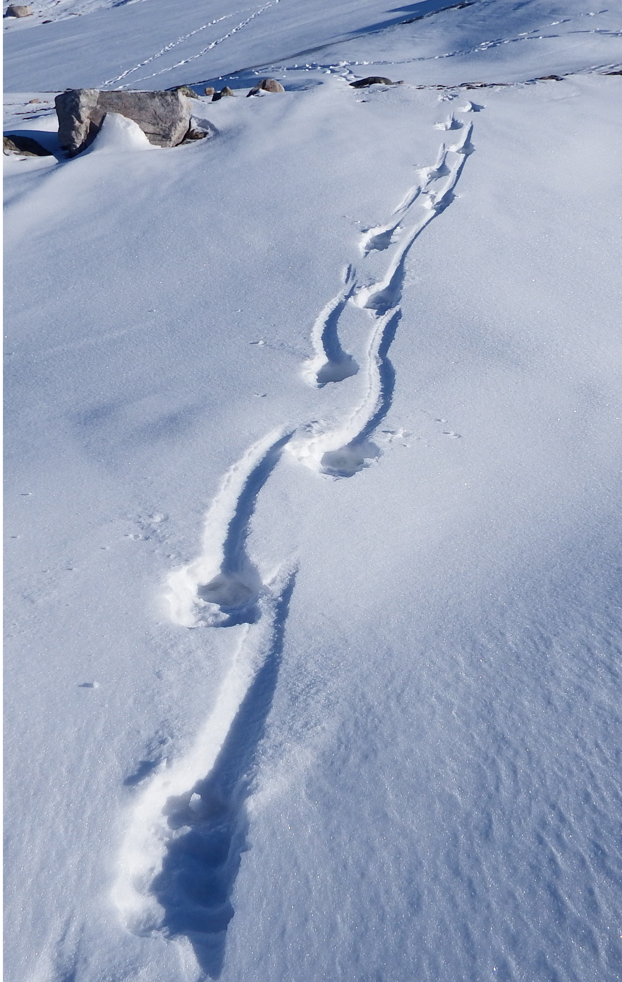
Vister etter villrein. Foto: Ragnar Djuvik. Neste side: Foto: Per Magne Sinnes.