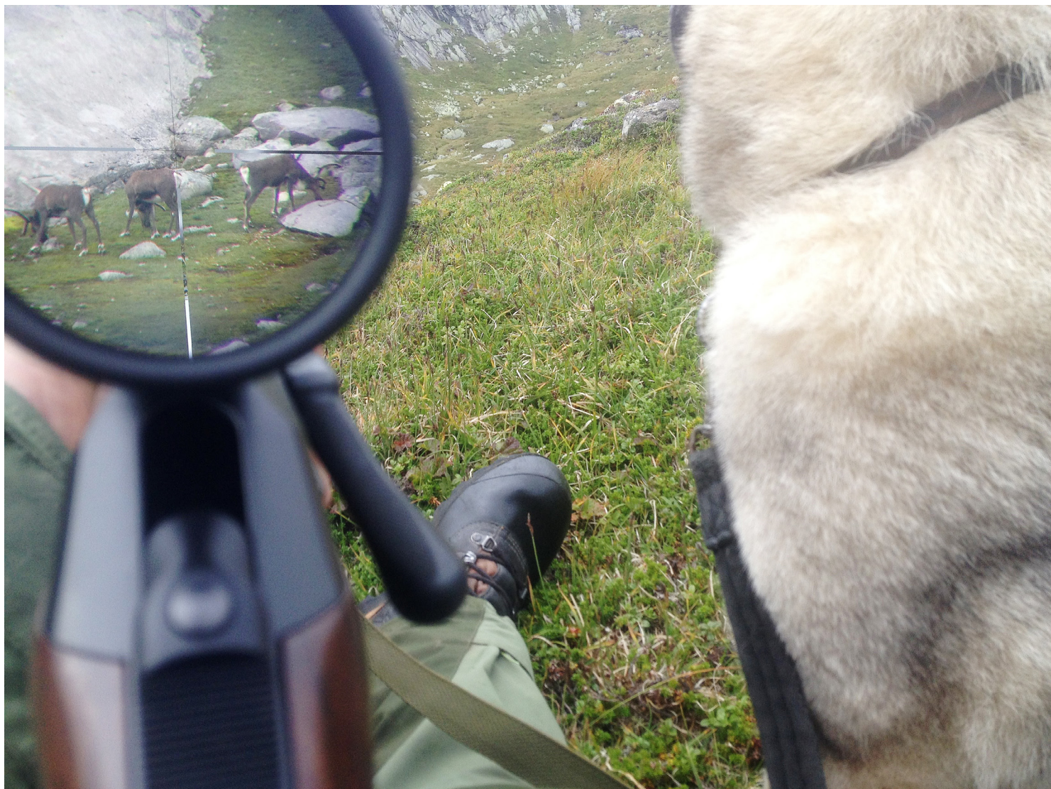
Kva ser me i framtida?

Tabellen syner at om lag halvparten av det private arealet var leigd ut til andre. Svært ofte var det jaktlag som leigde terreng og fekk fellingskvote. Jaktleiaren står oppført som den som fekk fellingskvoten.