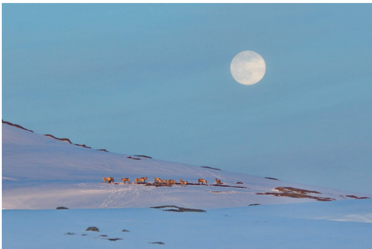
Villrein og måne

Eventuelt forfall må meldes snarest på tlf. 90505902. Vararepresentanter møter etter nærmere beskjed.