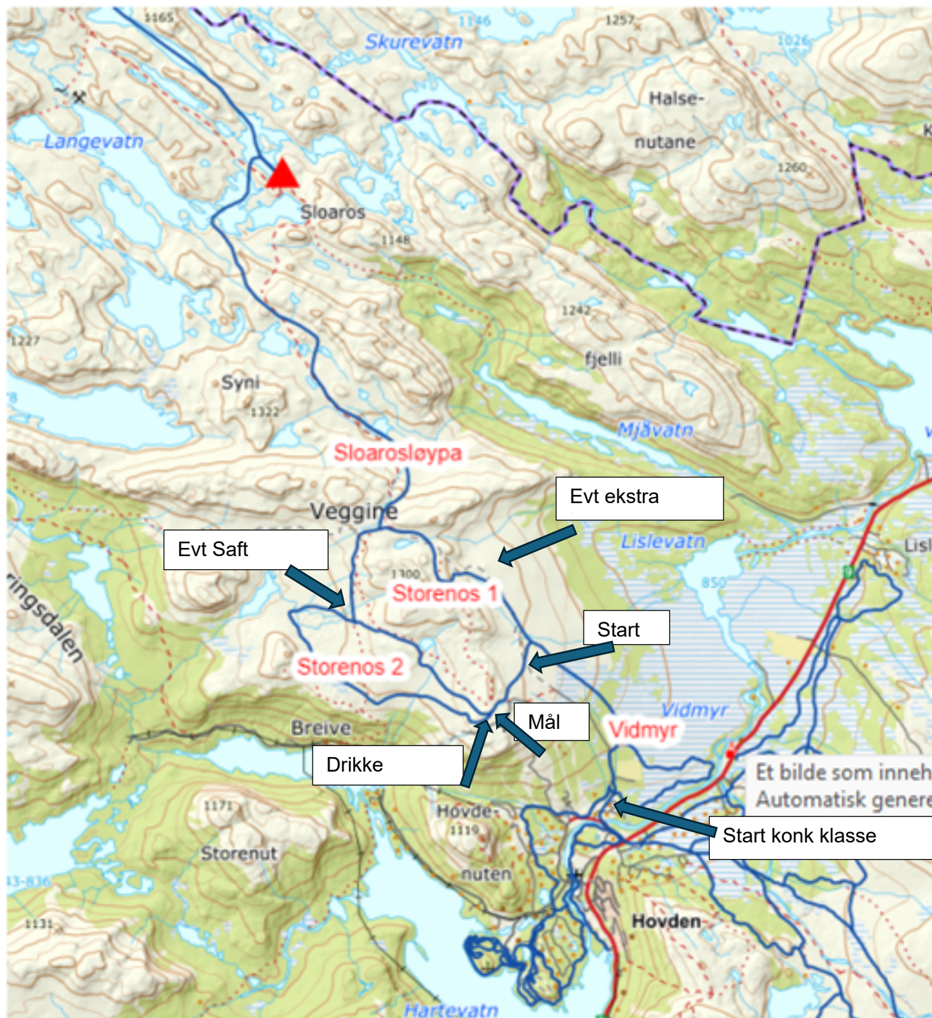
Kart med godkjende trasear. Sloarosløypa, Storenos 1, Storenos 2 og Vidmyr merka med blå linje